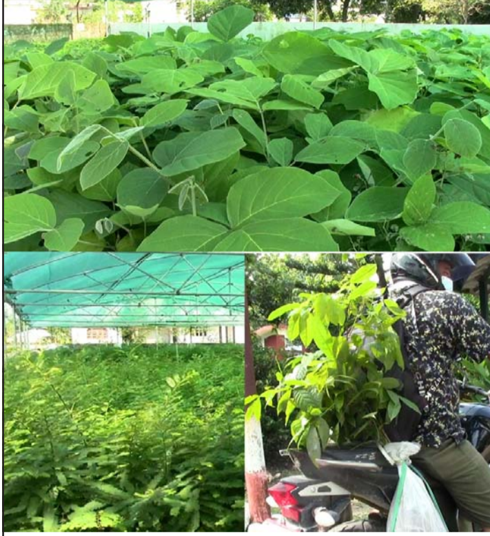
डिभिजन वन कार्यालय बारालेको नर्सरीमा उत्पादन गरिएका विभिन्न प्रजातिका बिरुवा।

उत्पादित बिरुवा आवश्यकता अनुसार खाली वन क्षेत्र, नदी उकास क्षेत्रलगायतका ठाउँमा योजनाबद्धरूपमा रोपण भइरहेको डि.एफ.ओ सिंहले बताए। गत आवामा बारालेका विभिन्न स्थानमा गरी ४४६.१६ हेक्टर अर्थात् ६६९.२४ बिघा वन क्षेत्रमा तारबार गरी वृक्षारोपण गरिएको छ। जसमध्ये निजगढमा १३६.५५, कोल्हवीमा १२६.५५ र जीतपुरसिमरामा १८३.०६ हेक्टर वन क्षेत्रमा वृक्षारोपण सम्पन्न भएको डिवका, बाराले जनाएको छ।