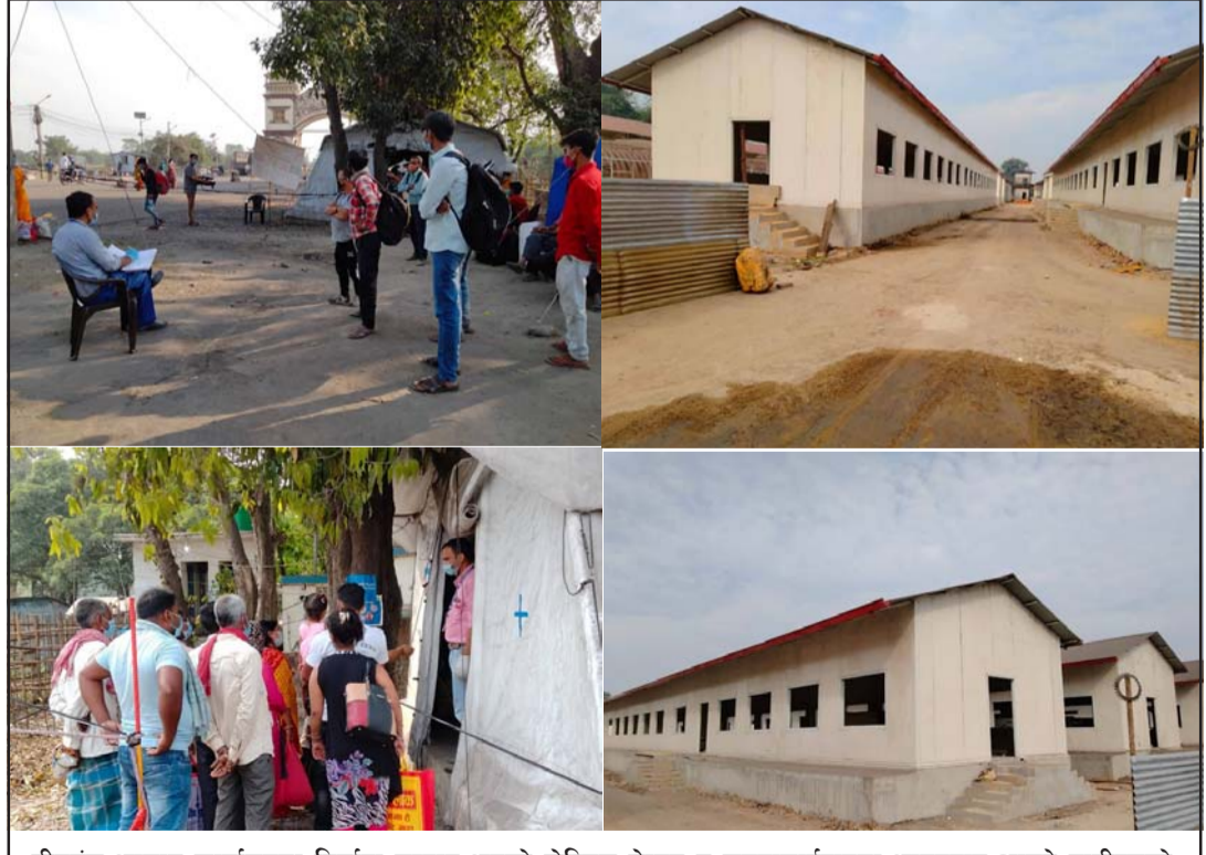
वीरगंज भन्सार कार्यालयमा निर्माण सम्पन्न भएको होल्डिङ सेन्टर र शङ्कराचार्यद्वारा भारतबाट आउने यात्रीहरूको कोरोना परीक्षण गरिँदै ।