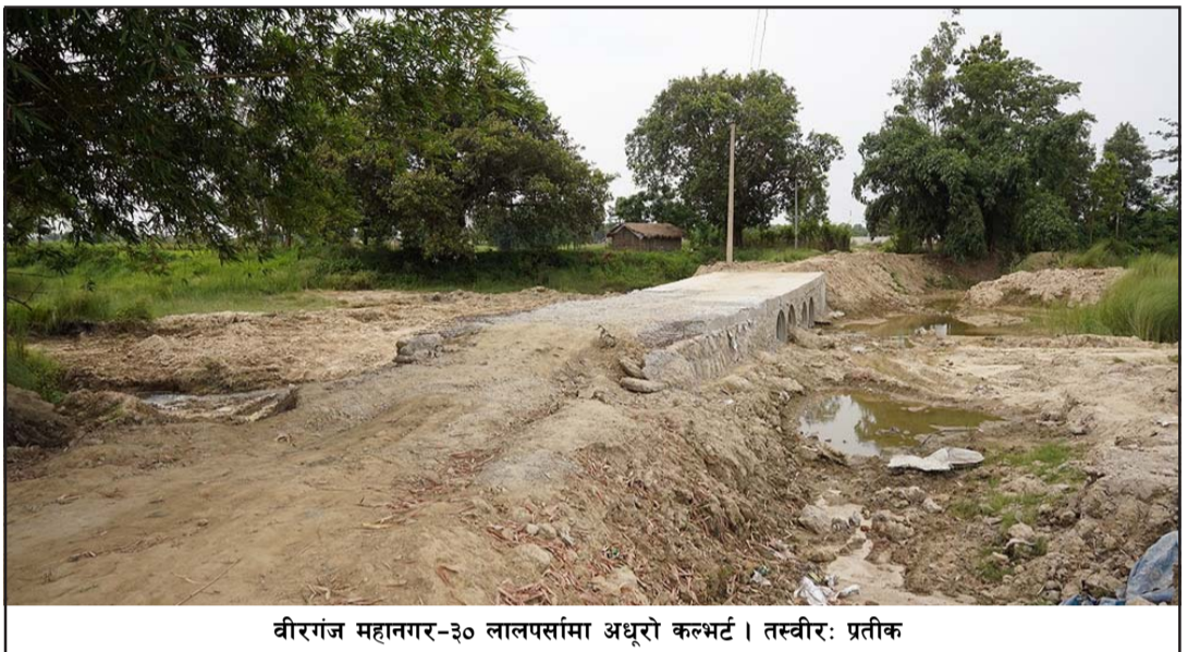
वीरगंज महानगर-३० लालपर्सामा अधूरो कल्भर्ट ।

प्रस, वीरगंज, १३ साउन / बाटोघाटो, पुल, सडक ढलान, भवन कार्यक्रमा अन्तर्गत सो बजेट आएको हो । सङ्घ, मधेश प्रदेश र स्थानीय निर्माणलायत पूर्वाधार निर्माणका काम कामको प्रवृत्ति हेर्दा उपभोक्ता समितिलाई