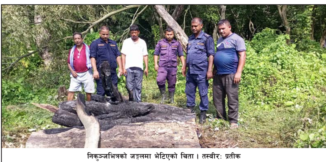
निकुञ्जभित्रको जङ्गलमा भेटिएको चिता।

पटेवांसुगौलीको संयुक्त टोलीले एकजना महिलाको जलेको अवस्थामा शव बरामद गरेको छ।