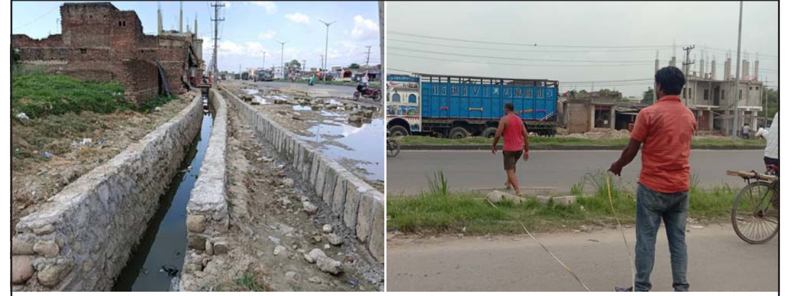
सडकको चौडाइ घटाएर निर्माण गरिएको नाला र छानबिन टोलीले सडकको नापजोख गर्दै ।

साहले विवाद सिर्जना भएको ठाउँमा पथलैया कार्यालयमा गएको टोलीलाई पचास मिटर चौडाइ हुने गरी सडक भनेका छन् ।