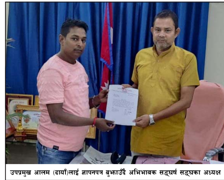
उपप्रमुख आलम (दायाँ)लाई जापनपत्र बुझाउँदै अभिभावक सङ्घर्ष सङ्घका अध्यक्ष

गरिएको छ । महानगरपालिकाका शैक्षिक प्रशासन