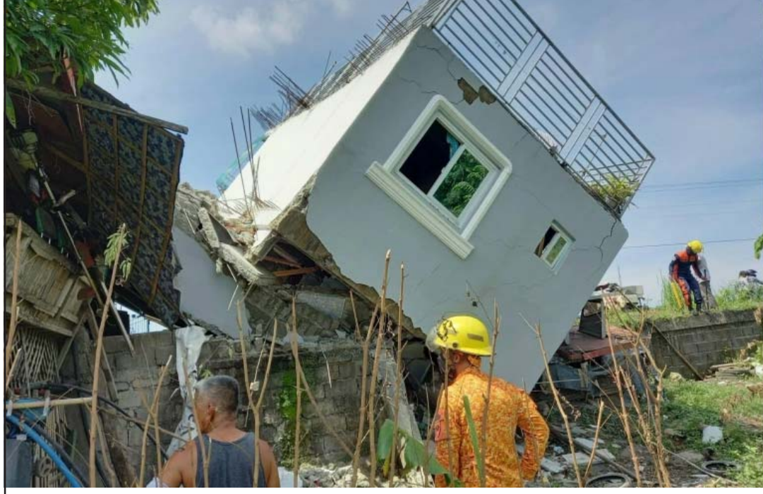
फिलिपिन्सको आब्रा प्रान्त भर्खरै गएको भूकम्पले ढालेको घर।

जनाइएको छ। घटनास्थलमा खोजी तथा उद्धारका लागि ठूलो सङ्ख्यामा