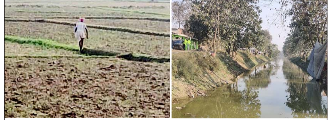
साउन महीनामा खेतमा धूलो उड्दै र गण्डक नहरमा पानीको अवस्था ।

सडकको पश्चिमतर्फको फुटपाथ घटाएर चौडाइ कम गरिएको र सडकछेउका जग्गाधनीको जग्गा बचाउन चौडाइ घटाएको हुन सक्ने छानबीनको प्रारम्भिक अनुसन्धानमा देखिएको छ ।