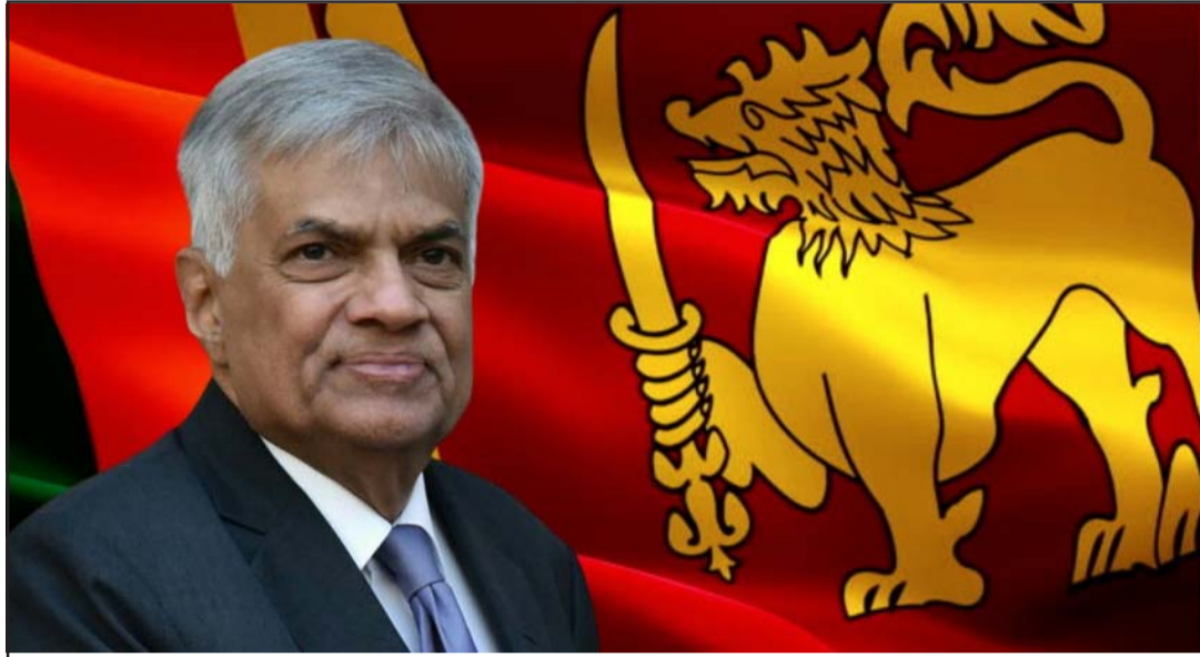
कार्यवाहक राष्ट्रपति रनिल विक्रमासिङ्घे ।

कोलम्बो, ४ साउन/सिन्धवा बुधवार श्रीलङ्काको संसद्मा भएको निर्वाचनमा कार्यवाहक राष्ट्रपति रनिल विक्रमासिङ्घे बुधवार नयाँ राष्ट्रपति निर्वाचित भएका छन्। संसद्का सभामुख महिन्दा यापा अबेवर्देनाले विक्रमासिङ्घे १३४ मतले विजयी भएको घोषणा गरेका छन्। गेटाबाया राजापाक्षेले राष्ट्रपति पदबाट राजीनामा दिएपछि संसद्मा निर्वाचन भएको हो। रासस