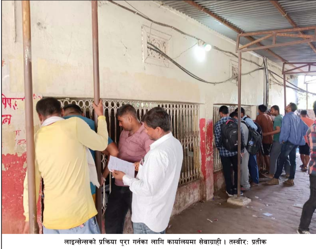
लाइसेन्सको प्रक्रिया पूरा गर्नका लागि कार्यालयमा सेवाग्राही ।

गर्नुको कारण निशुल्क निरोगिताको प्रमाणपत्र सिफारिश गर्ने चिकित्सकले दुई/तीन वटा शीर्षकमा पैसा कमाउने दाउमा निशुल्क टेन्डर भरेको बुझिएको छ । मानिसविनाको मेडिकल सिफारिश गर्ने,