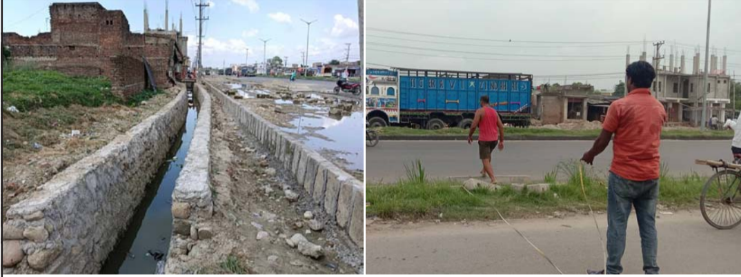
सडकको चौडाइ घटाएर निर्माण गरिएको नाला र छानबीन टोलीले नापजोख गर्दै ।

साढे तीन सय क्युसेक मात्र पानी आइरहेकोले पर्सा, बाराका किसानहरूलाई