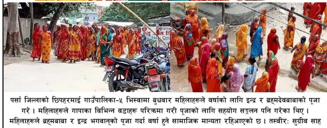
पर्साले जिल्लाको छिपहरमाई गाउँपालिका-५ भिसवामा बुधवार महिलाहरूले वर्षाको लागि इन्द्र र ब्रह्मदेवबाबाको पूजा गरे। महिलाहरूले गापाका विभिन्न वडाहरू परिक्रमा गरी पूजाको लागि सहयोग सङ्कलन पनि गरेका थिए। महिलाहरूले ब्रह्मबाबा र इन्द्र भगवानको पूजा गर्दा वर्षा हुने सामाजिक मान्यता रहिआएको छ।