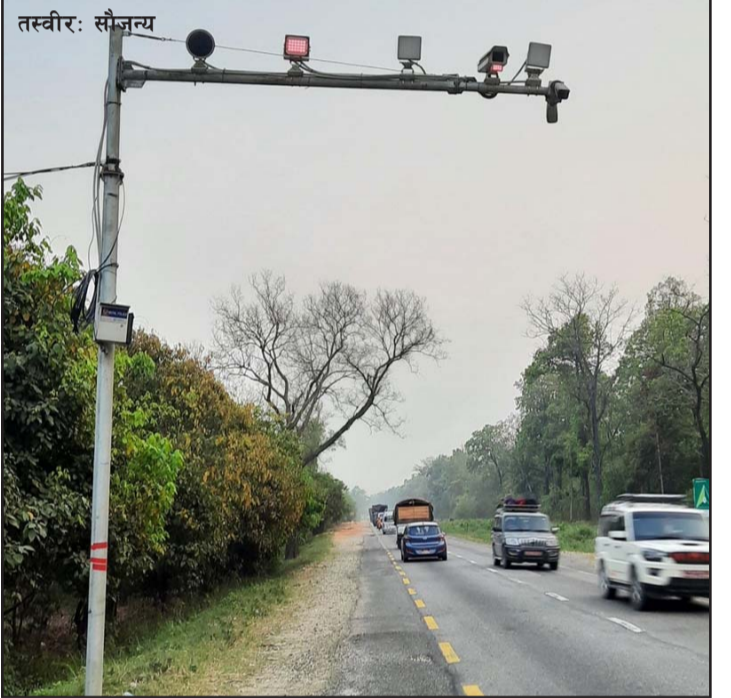
जिप, यात्रुवाहक सवारीसाधनलाई तीव्र गतिविरुद्धको कारबाईमा ८०४ प्रतिशत वृद्धि भएको जनाएको छ।

हेन्डलहेल्ड राडार गनभन्दा सिसिटिभी सञ्चालन गरी तीन लाख ३९ हजार राडार गनको प्रयोगबाट निजी कार, ९२८ जनालाई सचेत पारिएको जानकारी