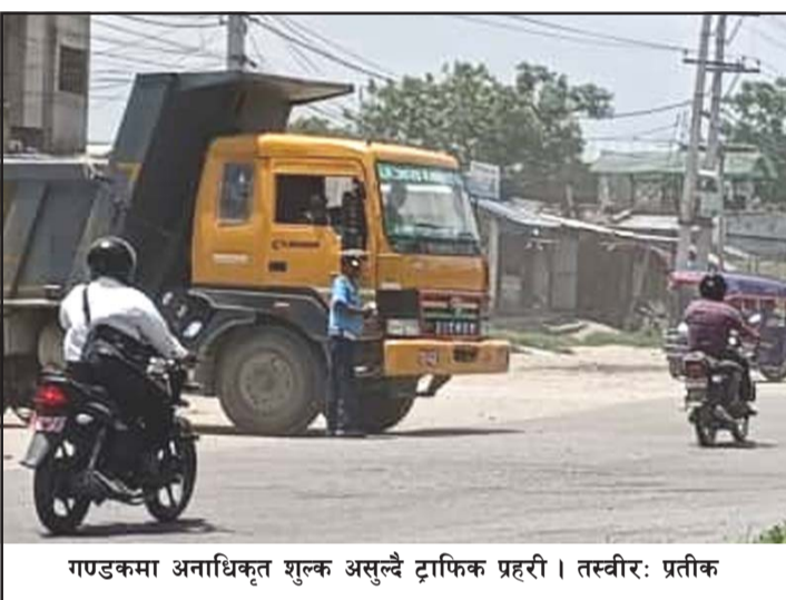
गण्डकमा अनाधिकृत शुल्क असुलै ट्राफिक प्रहरी।

त्यहीं ओभरलोड भारतीय गाडीहरूसँग रकम असुली ट्राफिक प्रहरीले