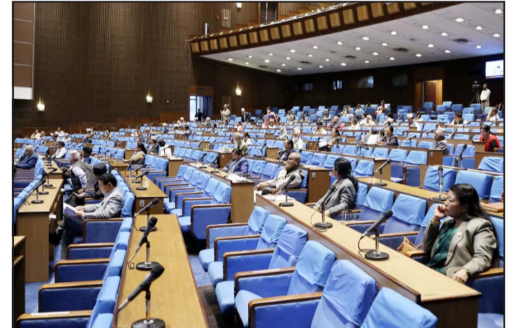
प्रतिनिधिसभाको बुधवार बसेको बैठकमा सहभागी।

राख्ने छोरछोरी पनि साथमा नहुन सक्ने अवस्था रहेकाले पनि समस्या बढेर गएको उल्लेख गरे।