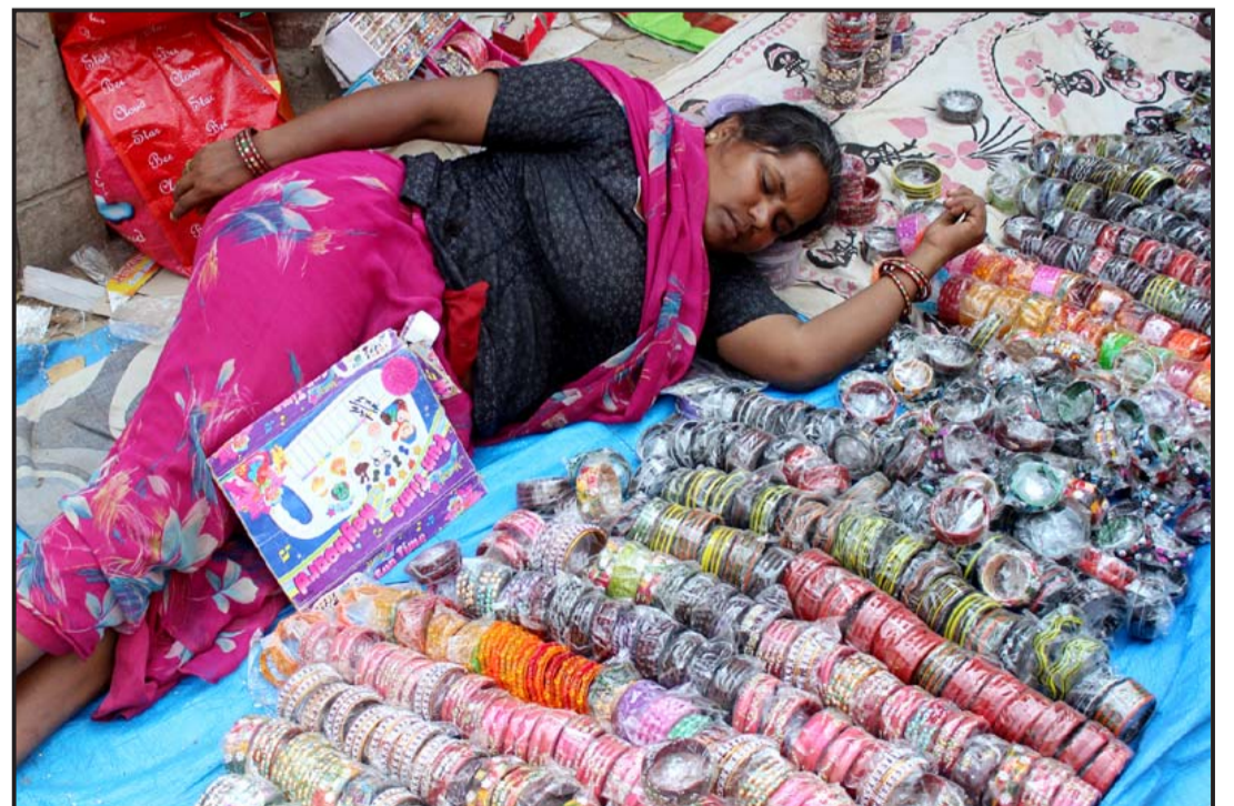
वीरगञ्जको घण्टाघरछेउमा रहेको फुटपाथे बजारमा चुरा बिक्री गर्दा गर्दै थकाइ लागेपछि आराम गर्दै महिला व्यापारी । साउनमा चुराको अत्यधिक बिक्री हुने गरेको छ ।

सो खोलामा हीराचन/रोशन कन्स्ट्रक्सन पालिमारपंत रोशन कन्स्ट्रक्सनले पुल निर्माणको काम गर्दै