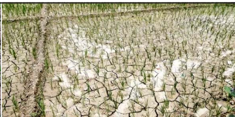
साउनको शुरुमा पनि पानी नपरेको कारण बर्दिया, गुलरिया नगरपालिका-११, गणेशपुरमा धान रोपन नपाएर बाँझो रहेको किसानका जमीन।