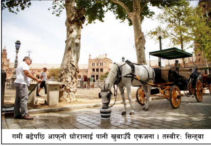
गमी बढेपछि आफ्नो घोरालाई पानी खुवाउँदै एकजना।