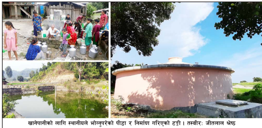
खानेपानीको लागि स्थानीयले भोग्नुपरेको पीडा र निर्माण गरिएको टङ्गी।