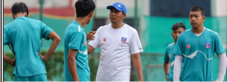
च्याम्पियनशिपका लागि प्रशिक्षण लिदै खेलाडी।

भारतमा आयोजना हुने साफ यु-२० पुरुष च्याम्पियनशिपका लागि अखिल नेपाल फुटबल सङ्घले सोमबार २३ सदस्यीय नेपाली फुटबल टोली घोषणा गरेको छ।