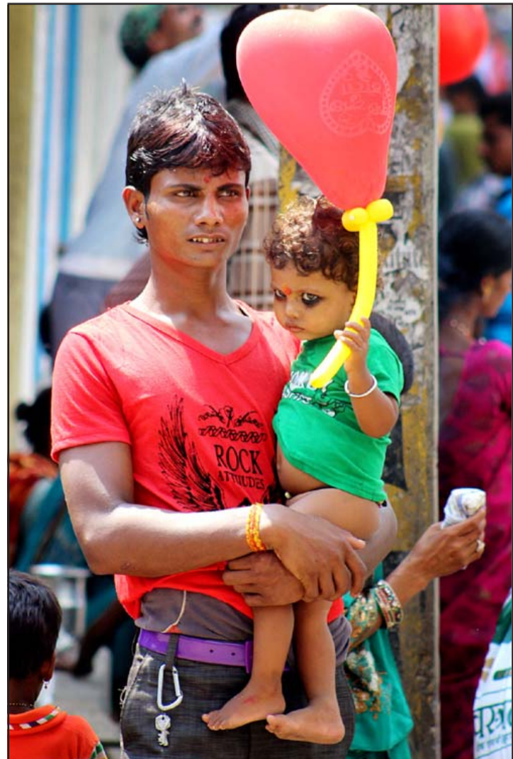
हावाको खेलौना: वीरगंजको माईस्थानमा कुनै पनि चाडपर्वमा लाग्ने मेलामा बेलुन बेच्ने गरिन्छ। सस्तो, हलुको र बालबालिकाहरूलाई आकर्षित गर्ने बेलुन अभिभावकको पहिलो रोजाइमा पर्ने गर्छ।

दाता संस्थाले यहाँ निश्शुल्क शल्यक्रिया सेवा शुरू गरेदेखि प्रत्येक महिना औसतमा १५/२० जना महिलाको निश्शुल्क शल्यक्रिया गरेर बच्चा जन्माउन सेवा प्रदान गरिएको थियो भन्दै स्टाफ नर्स अधिकारीले अब यो सेवा बन्द भएपछि यहाँका गरीब, विपन्न महिला जटिल अवस्थामा कहाँ जाने र कसरी प्रसूति हुने भन्ने चिन्ता व्यक्त गरिन्। यस सम्बन्धमा मेसु डा साहले आफूले उक्त संस्थाको सेवा निरन्तर राख्न स्थानीय, प्रदेश तथा सङ्घीय सरकार, सरोकारवाला स्वास्थ्य निकायसँग कुरा गरे पनि यस संस्थाले निरन्तरता नपाउने भएको गुनासो गरे। उनले यसको विकल्पमा प्रदेश सरकारको स्वास्थ्य मन्त्रालयले चाँडै अस्थायी दरबन्दीसहितको ५० शय्याको व्यवस्था गरेर शल्यक्रियासहितको प्रसूति सेवा चालू गर्न आश्वासन दिएको जानकारी दिए। आजदेखि शल्यक्रिया सेवा बन्द भएपछि जलेश्वरवासीमा चिन्ता बढेको छ।