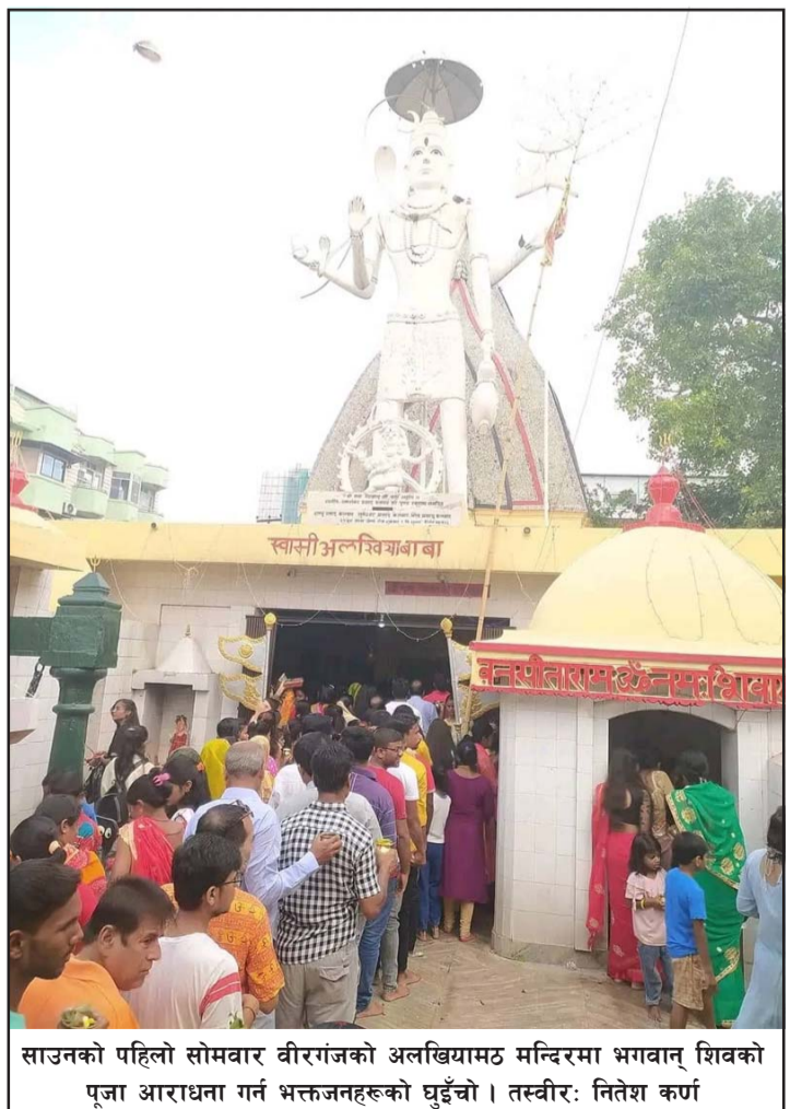
साउनको पहिलो सोमवार वीरगंजको अलखियामठ मन्दिरमा भगवान् शिवको पूजा आराधना गर्न भक्तजनहरूको घुइँचो।