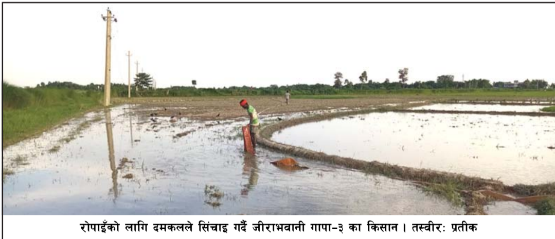
रोपाईको लागि दमकलले सिंचाइ गर्दै जीराभवानी गापा-३ का किसान ।

प्रस, सेढवा, ३१ असार / सवारीसाधन र यात्रीहरू चाप निकै घटेको रोगीहरूमा टाउको, हातखुट्टा र जीउ दुख्ने समस्या भएको बताए ।