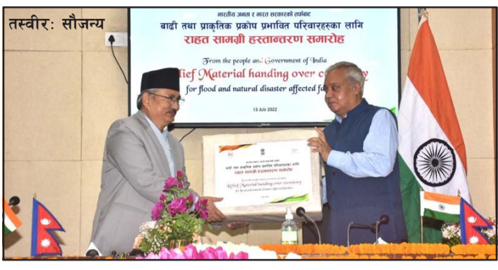
भारतद्वारा राहत सामग्री हस्तान्तरण गरेका छन्। शुक्रवार सिंहदरबारमा आयोजित कार्यक्रममा तीन हजारवटा ठूला आकारका टेन्ट तथा १०