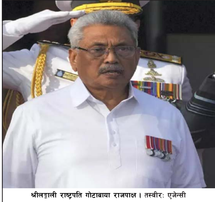
श्रीलङ्काका राष्ट्रपति गोटाबाया राजपाक्ष ।

कोलम्बो, ३१ असार/एएनआई तथा १९८१ को विशेष प्रावधानको ऐन नं श्रीलङ्कामा देशभरि बृहत् विरोध २ बमोजिम राष्ट्रपति चयन गरिने