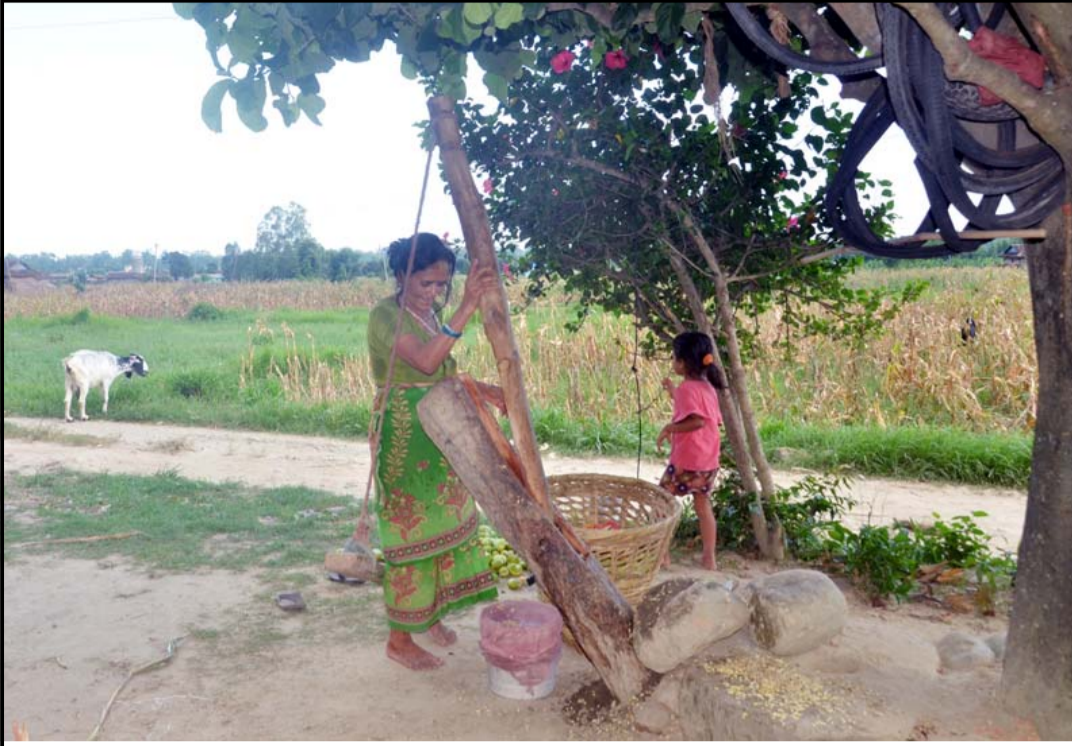
परम्परागत लोपोन्मुख अवस्थामा रहेको कोलमा कागती च्यापेर रस निकाल्दै निजगाढ नगरपालिका-१० लालकी महिला । यसरी निकालिपछि रसबाट चुक अमिलो बनाइन्छ । अहिले गाउँघरमा चुक अमिलो प्रतिमानाको रू एक हजारमा बिक्री हुने गरेको छ ।