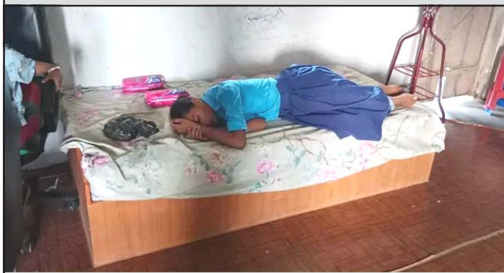
विद्यालयमा बेहोस भएकी छात्रा आराम गर्दै ।

पकाहामैनपुर गापा-३ स्थित रामचरित्र भगत माविमा अध्ययनरत छात्रा