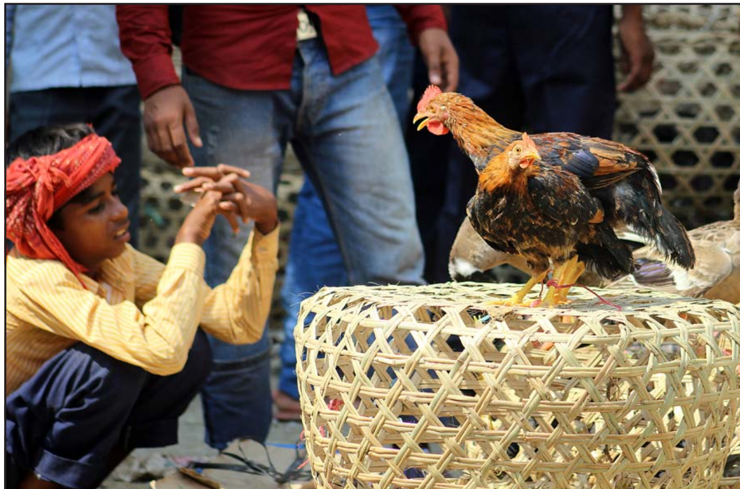
देहाती कुसुरा: वीरगंज बजारमा कुसुराको मासु अत्यधिक खपत हुन थालेपछि दूरदराज गाउँबाट देहाती कुसुरा बिक्रीको लागि शहरको बजारमा ल्याएर प्रतिकिलो रु सात सयदेखि आठ सयसम्म बिक्री गरिन्छ।

अनुसार सेवा प्रदान गर्न एनसेलले देशभरि ३१ वटा एनसेल सेन्टरबाट ग्राहक सेवा प्रदान गर्दै आएको छ।