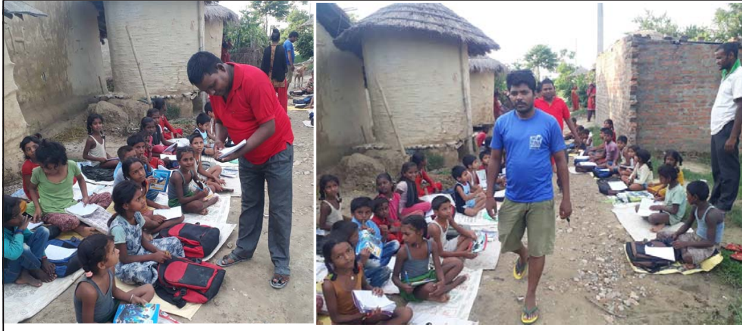
फूटपाथमा दलित बालबालिकालाई निशुल्क ट्युशन पढाउँदै।

फाउन्डेशनले जीराभवानीका साथै सखुवाप्रसौनी गापा-३ कौवा वनकटैयामा