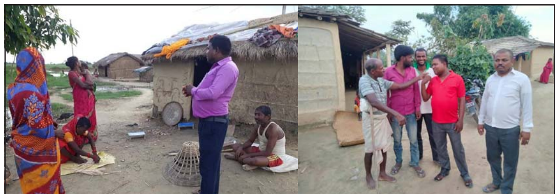
फाउन्डेशनले पर्साका दलितहरूको सामाजिक अवस्थाबारे बुझ्दै ।

अहिले पनि पर्सा जिल्लाका विद्यालयहरूमा दलित भएकै कारण बालबालिकाहरूमाथि