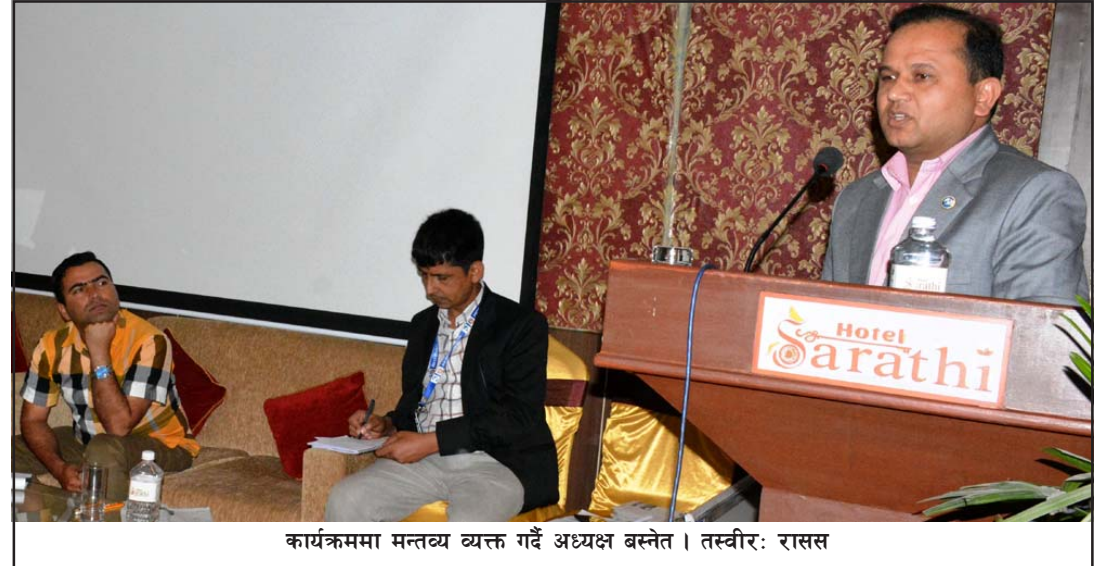
कार्यक्रममा मन्तव्य व्यक्त गर्दै अध्यक्ष बस्नेत।

आचारसंहितालाई ख्याल नगर्नु समस्या रहेको भन्दै उनले स्थानीय विज्ञापन स्थानीय सञ्चारमाध्यमलाई नै दिनुपर्ने