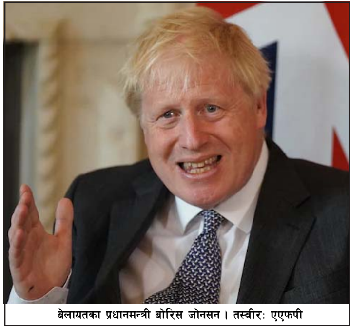
बेलायतका प्रधानमन्त्री बोरिस जोनसन।

पहिलो मतदानमा ३० जना सांसदको समर्थन सुरक्षित गर्न नसकेका कुनै पनि उम्मेदवारहरू दोस्रो चरणको प्रतिस्पर्धामा सहभागी हुन पाउने छैनन्। रासस