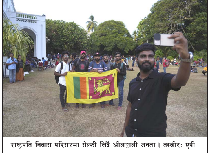
राष्ट्रपति निवास परिसरमा सेल्फी लिँदै श्रीलङ्काली जनता।

कोलम्बो, श्रीलङ्का, २९ असार/सिन्धुवा प्रधानमन्त्रीको कार्यालयका एक श्रीलङ्का राष्ट्रपति गोटाबाया अधिकारीले बताए।