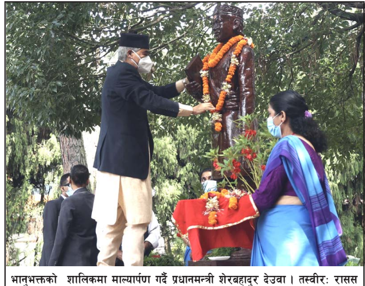
भानुभक्तको शालिकमा माल्यार्पण गर्दै प्रधानमन्त्री शेरबहादुर देउवा।

हो—उनले भने—“भन्काएर इतिहास मेट्न हुँदैन, संरक्षणमा लाग्नुपर्छ।”