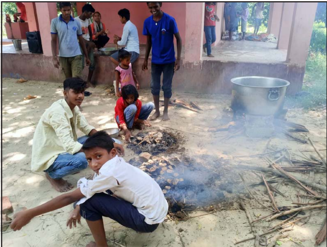
ब्रह्मबाबाको पूजा: पर्सगढी नगरपालिका-४, बर्वाटौँडीमा स्थानीयवासी ब्रह्मबाबाको पूजाको लागि लिटी बनाउँदै। यो पूजा असार महीनाको शुरू अथवा मसान्तमा हुने गरेको पण्डित सञ्जय पाण्डेले बताए। गाउँभरिका मान्छे मिलेर पूजा गर्ने र प्रसादको रूपमा लिटी र खीर बनाएर ब्रह्मबाबालाई चढाउँदा गाउँमा सुखशान्ति हुने बताइन्छ।

भट्टीमा खानतलाशी गर्ने क्रममा सो परिमाणको घरेलु मदिरा बरामद गरेको हो। प्रहरीका अनुसार चारवटा रक्सी भट्टीबाट कच्चा पदार्थ ५०० लिटर, तयारी मदिरा २००० लिटर, स्टीलको भाँडो चारवटा, प्लास्टिकको भाँडो २० वटासमेत बरामद गरी नियन्त्रणमा लिएर नष्ट गरिएको छ।