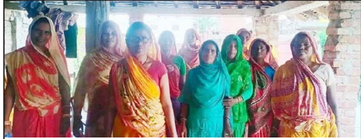
लुघवित्त संस्थामा आबद्ध महिलाहरू ।

पहिलेको सहज अवस्था परिवर्तन भएर बेरोजगारी बढ्नु अर्को कारण भएको