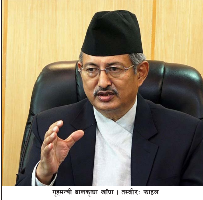
गृहमन्त्री बालकृष्ण खॉण।

विपद् व्यवस्थापनदेखि, पर्यटकको सुरक्षा, कानून तथा फैसला कार्यान्वयनमा समेत महत्त्वपूर्ण उपलब्धि हासिल भएको छ। कतिपय कानून, निर्देशिक निर्माण र भड्कुरहेका कानून समयानुकूल संशोधनमा सरकारको ध्यान गएको छ। आफ्नै तौरतरीकामा सञ्चालन हुँदै आएका उपचार तथा पुनर्स्थापन केन्द्रलाई गृह मन्त्रालयमा आबद्ध गराएको छ। मन्त्रालयको लागूऔषध शाखासँग आबद्ध नभएका लागूऔषध प्रयोगकर्ताको लागि सञ्चालित १९५ उपचार तथा पुनर्स्थापना केन्द्र मन्त्रालयमा आबद्ध गरिएको छ।