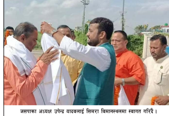
जसपाका अध्यक्ष उपेन्द्र यादवलाई सिमरा विमानस्थलमा स्वागत गरिँदै।

वीरगंजमा भने बहुमत सदस्यहरूको सहभागिता रहने बताइएको छ।