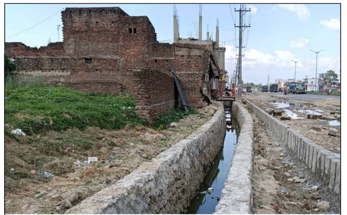
परवानीपुर सडकखण्डमा बाझो गरी निर्माण गरिएको नाला।

पर्साको उत्तरी भेगका पसांगढी नगरपालिकालगायत आसपासका क्षेत्रमा आकाशो वर्षा नहुने हो भने यस वर्ष सयौं बिघा धानखेती योग्य जमीन बाँझो रहने देखिएको छ।