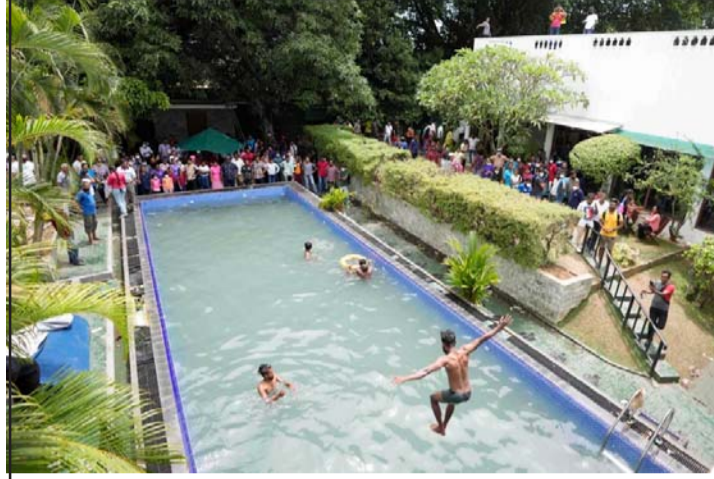
राष्ट्रपति निवासको स्वीमिङ पूलमा पौडिदै प्रदर्शनकारीहरू ।

उम्मेदवार बन्ने पुष्टि भइसकेको छ । प्रेमदासाले देशको अर्थतन्त्र पुनर्निर्माण