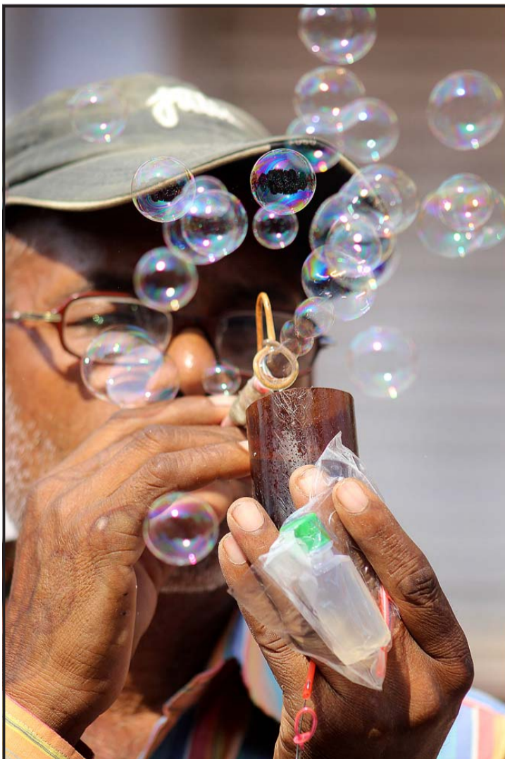
पानीको फोका : वीरगंज माईस्थानचोकमा पानीको फोका उडाउने सेलौना बिर्री वितरण गर्दै व्यापारी। तराई-मधेसमा लाग्ने ठेलाहरुमा चरस्ता सेलौनाप्रति बालबालिकाहरु आकर्षित हुने गर्छन्।

नागरिकलाई अनुरोध गरेको छ। राति देशभर आंशिकदेखि सामान्य बदली रही देशका थोरै स्थानमा हल्कादेखि मध्यम वर्षाको सम्भावना र सुदूरपश्चिम प्रदेशको एक वा दुई स्थानमा भारी वर्षाको सम्भावना रहेको बताइएको छ।