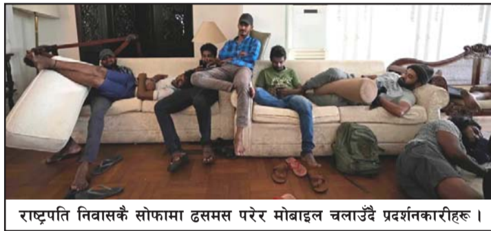
राष्ट्रपति निवासकै सोफामा ढसमस परेर मोबाइल चलाउँदै प्रदर्शनकारीहरू ।

पनि पदबाट राजीनामा दिने घोषणा गरेका थिए । राष्ट्रपति र प्रधानमन्त्रीको निवास कडुमा लीएका आन्दोलनकारीले पदबाट राजीनामा नदिएसम्म त्यहाँबाट बाहिर ननिस्कने स्पष्ट पारेका छन् । शनिवार राष्ट्रपति गोटाबाया देश छोडेर भागेको बताइएको थियो ।