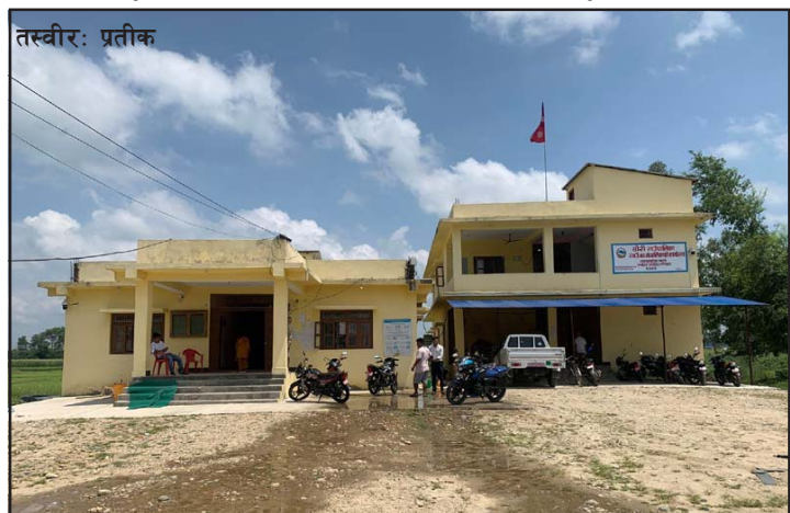
सेवाग्राहीका कारण भीड हुने ठोरी गाउँपालिका कार्यालय यस वर्ष सुनसान सेवाग्राहीको सङ्ख्या स्थानीय तह (बाँकी अन्तिम पातामा)

दैनिक सेवा लिन आउने सेवाग्राहीबाहेक भुक्तानी लिन आउने