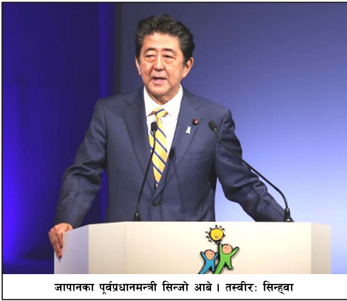
जापानका पूर्वप्रधानमन्त्री सिन्जो आबे ।