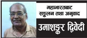
महाभारतवाटिका सञ्चालन तथा अनुवाद उमाशङ्कर द्विवेदी

धनुषलाई काटिदिए। अनि अश्वत्थामाले अर्को धनुष धारण गरेर घटोत्कचमाथि