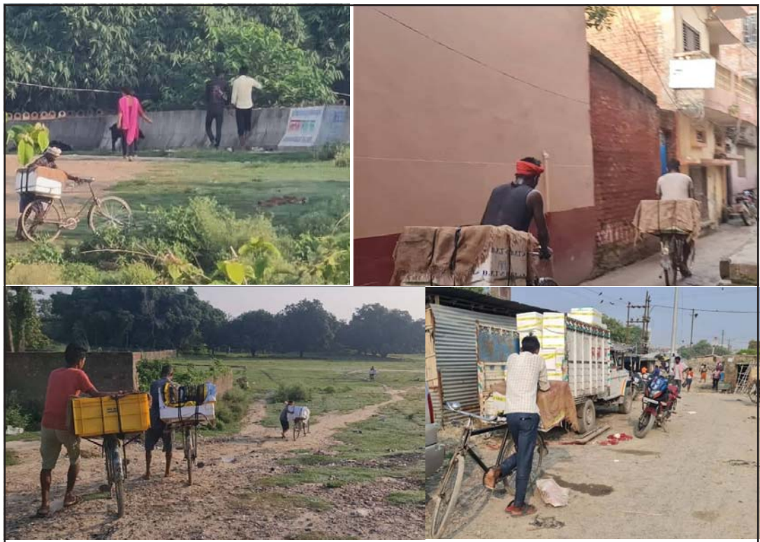
चोर नाकाबाट भारतबाट नेपालतर्फ माछा तस्करी गर्दै ।

काठमाडौं पुऱ्याउने गरिन्छ । माछाको निकासीमा राजस्व छलीको ठूलो अंश रहेको छ । पहिले कारोबारीहरूले मूल