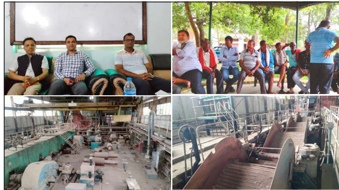
पत्रकार सम्मेलनमा अध्ययन टोली, कारखानाका कर्मचारीहरू र वीचिकालीको हालको अवस्था ।

वीरगंज चिनी कारखाना सञ्चालन गर्ने सरकारको मनसाय रहेको बताएका छन् ।