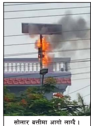
सोलार बत्तीमा आगो लाग्दै।

सोलार बत्ती जडान भएको ५-७ महीनापछि समस्या आउन थालेको थियो।