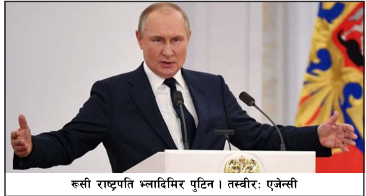
रूसी राष्ट्रपति भ्लादिमिर पुटिन।

भिस्वा- बिहान ७:४० बजे भिस्वा- बिहान १०:०० बजे भिस्वा- मध्यहान १२:०० बजे भिस्वा- दिउँसो १:३० बजे दसौला- दिउँसो २:३० बजे सेहवा- दिउँसो ३ बजे देउरिया- दिउँसो ३:१५ बजे भिस्वा- दिउँसो ३:४० बजे