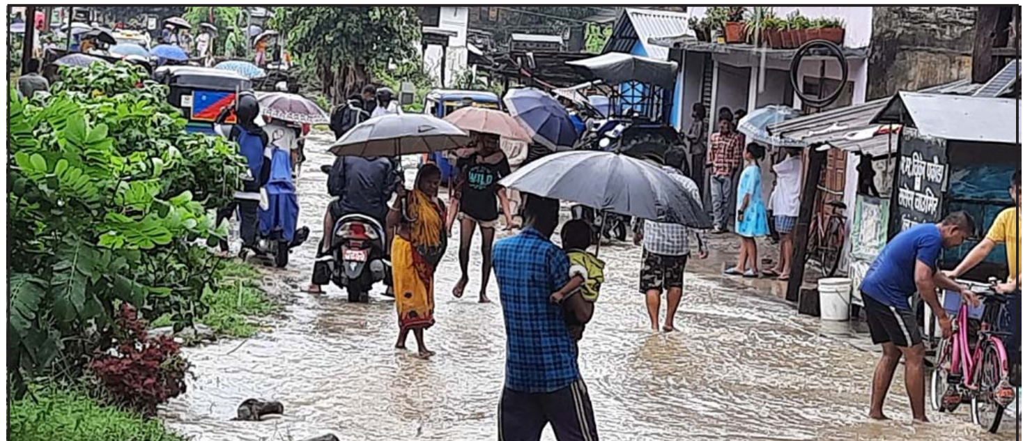
अविरल वर्षाका कारण निजगढका विभिन्न होचा स्थानमा रहेको बस्ती बुधवार डुबानमा परेको छ । कअईहलसँगै वैकल्पिक पुल प्रयोग गरेर आवतजावत गर्दै स्थानीय ।

रातको समयमा देशभर सामान्यदेखि पूर्ण बदली भई धेरै स्थानमा मेघगर्जन, चट्याङसहित हल्कादेखि मध्यम वर्षाको सम्भावना छ । गण्डकी र लुम्बिनी प्रदेशका थोरै स्थानमा साथै मधेश प्रदेश, बागमती प्रदेश र सुदूरपश्चिम प्रदेशका एक-दुई स्थानमा भारी वर्षाको सम्भावना छ । मौसम पूर्वानुमान महाशाखाको पछिल्लो विवरण अनुसार कास्कीमा २३.८, धनगढीमा ४२.९, विराटनगरमा ३९.६, नेपालगंजमा ३.२, सिमरामा ९.८, र काठमाडौँमा ४.९ मिलिमिटर वर्षा मापन भएको छ ।