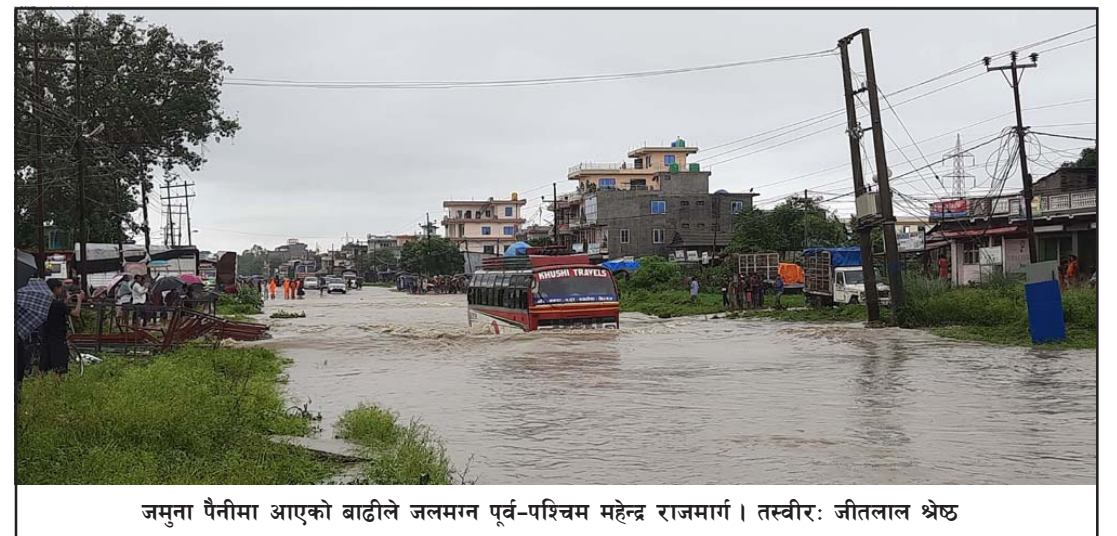
जमुना पैनीमा आएको बाढीले जलमग्न पूर्व-पश्चिम महेन्द्र राजमार्ग ।

निजगढ नगरपालिकाले बेलैमा ध्यान नदिदा अहिले निकासविनाको विकास देखिएको छ । सडकछेउमा नाला निर्माण गरिए पनि नाला भरिएर पानी सडकमा