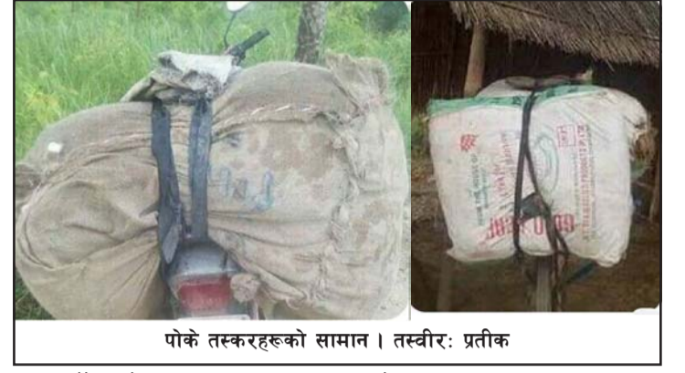
पोके तस्करहरूको सामान।

नेपाली मदिराहरू बरामद गर्ने गरेका छन्। इलाका प्रहरी कार्यालय,