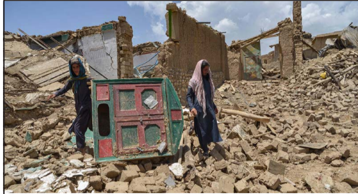
भग्नावशेष खोतल्दै अफगानी नागरिक।

राष्ट्रसङ्घका महासचिव एन्टोनियो गुटेर्रेसका प्रवक्ता स्टेफान डुजारिकले दिएको जानकारी अनुसार संयुक्त राष्ट्रसङ्घीय निकायहरूले अफगानिस्तानका भूकम्पपीडितहरूलाई खाद्यान्न तथा अन्य आवश्यक सहयोग गरिरहेका छन्। रासस