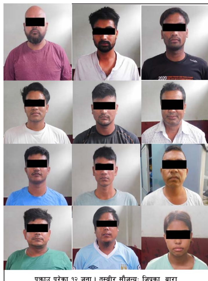
पक्राउ परेका १२ जना ।

जिल्ला अदालत बाराले आदेशमा पक्राउ परेका ११ जनालाई कैद भुक्तानको लागि वीरगंज कारागार पठाइएको छ