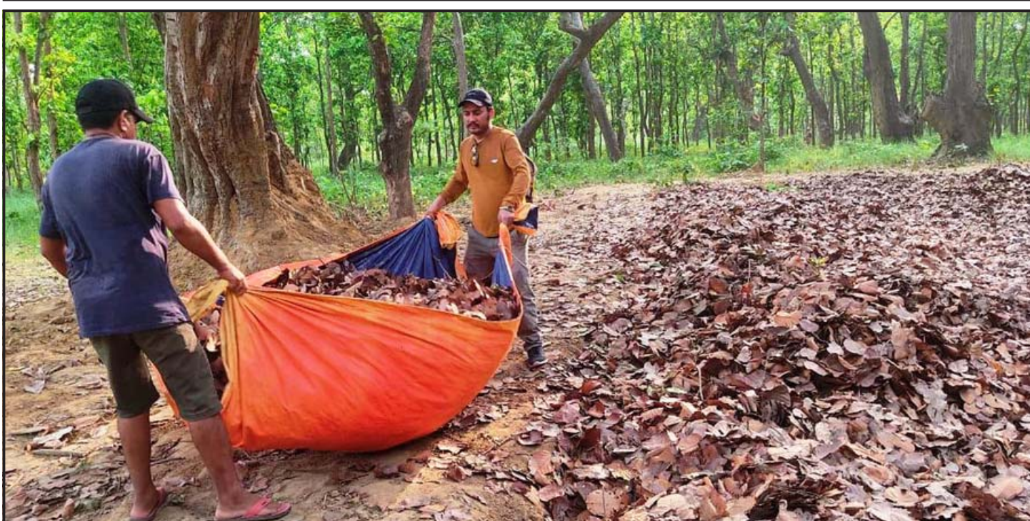
कम्पोष्ट मल बनाउन पतिङ्गर सङ्कलन गर्दै : कपिलवस्तुको मनकामना सामुदायिक वनमा कम्पोष्ट मल बनाउनको लागि पात पतिङ्गर सङ्कलन गर्दै बनका कर्मचारीहरू।

मधेस प्रदेश सरकारको भूमि व्यवस्था, कृषि तथा सहकारी मन्त्रालयले गत वर्ष नै किसानलाई राहत दिने बताए पनि ग्रामीण बस्तीका किसानले यो फाइदा लिन सकेका छैनन्। कुलो नहर नपुग्ने जग्गामा सिंचाइका वैकल्पिक उपाय अवलम्बन, कृषि बजारको वैज्ञानिक व्यवस्थापन र आधुनिक खेती प्रणालीका लागि किसानलाई बीउबिजन, मल र उपकरण (कृषि ज्याबल) सहज र सुलभ मूल्यमा पाउने व्यवस्था गरिने प्रदेश सरकारले जनाएको छ।