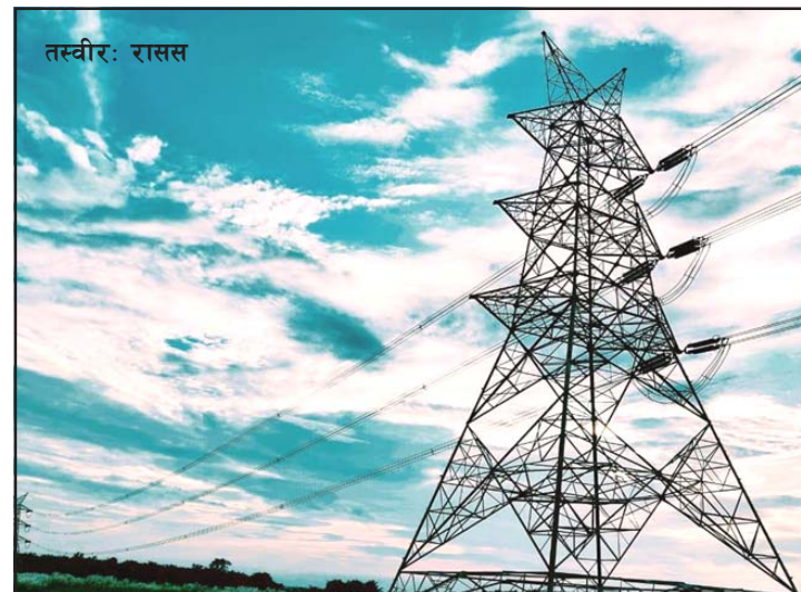
प्राधिकरणले आज छ हजार ८३१.६ मेगावाट घण्टा बिजुली ऊर्जा निर्यात गर्ने भएको छ । भारतमा, शेरबजारजस्तै हरेक १५ मिनेटमा

नेपाल विद्युत् प्राधिकरणले आजमात्रै मस्यौडदी र मध्यमस्यौडदीको बिजुली पनि निर्यात हुने जनाएको छ । भारतमा यति बेला ऊर्जाको अत्यधिक माग छ । सो माग पूर्तिको लागि सामान्यरूपमा नै भए पनि प्राधिकरणले बिजुली निर्यात गरेको हो । त्यसको मात्रामा क्रमशः वृद्धि भएको छ ।