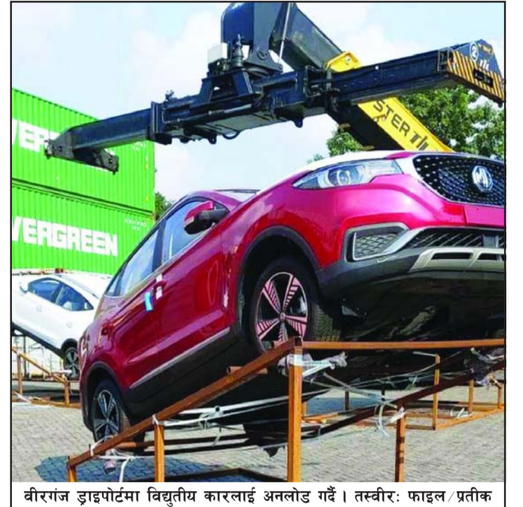
वीरगंज ड्राइपोर्टमा विद्युतीय कारलाई अनलोड गर्दै।

यस्तै, बजेटमाफर्त १०० किलोवाटदेखि २०० किलोवाटसम्मका ३० प्रतिशत, २०० देखि ३०० किलोवाट सम्मकामा ३०