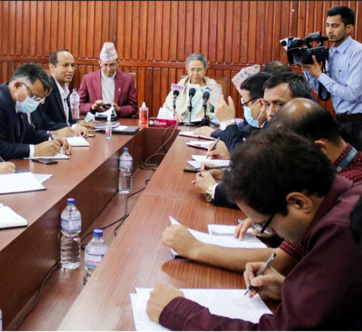
मन्त्रालयमा जेठ १८ गते आयोजित पत्रकार सम्मेलनलाई सम्बोधन गर्दै मन्त्री शशी श्रेष्ठ।

नियमावलीले प्रदेश र स्थानीय सरकारले जग्गाको चकलाबन्दी कार्यक्रम, जग्गा एकीकरण, चकलाबन्दी, बस्ती विकास, सामूहिक खेती तथा सहकारी खेतीसम्बन्धी आधार, मापदण्ड र योजना तयार गरी कार्यान्वयन गर्न सक्ने प्रावधान ल्याएको छ। स्थानीय सरकारले कृषिको आधुनिकीकरण, यन्त्रीकरण, व्यवसायीकरण, सहकारी खेती, सामूहिक खेती तथा सार्वजनिक खेती गर्ने प्रयोजनका लागि सम्बन्धित जग्गाधनीको सहमतिमा साँध सिमाना जोडिएको कित्ता जग्गाको एकीकरण गरी चकलाबन्दी कार्यक्रम सञ्चालन गर्न सक्ने व्यवस्था नियमावलीमा गरिएको छ।