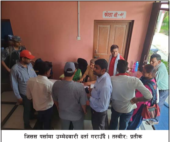
जिसस पर्सामा उम्मेदवारी दर्ता गराउँदै।

सार्वजनिक कायम गरी पाउँ भनी तत्कालीन जीतपुर गाविसका अध्यक्ष