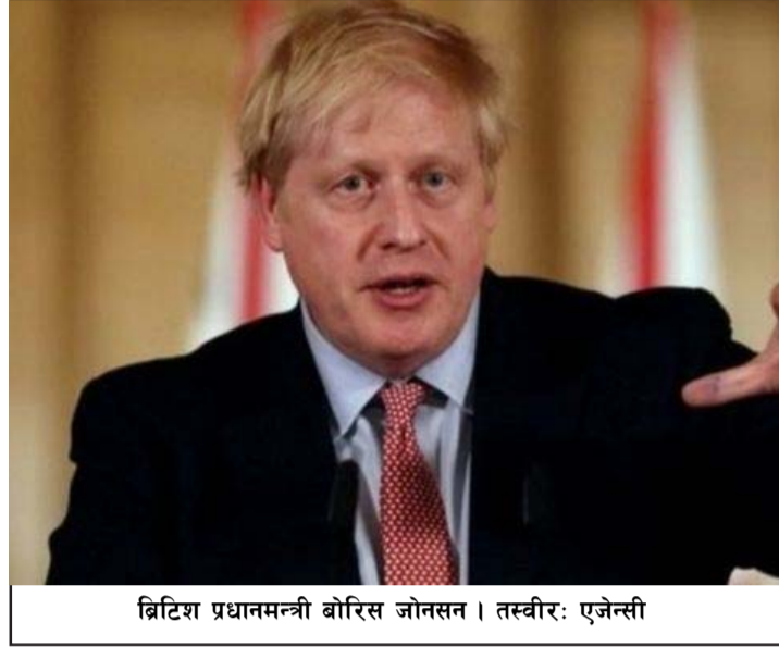
ब्रिटिश प्रधानमन्त्री बोरिस जोनसन।

आफ्नै पार्टीबाट अविश्वासको प्रस्ताव आएपछि उनलाई कतिपय मानिसले राजीनामा दिन पनि आह्वान गरेका छन्। रासस