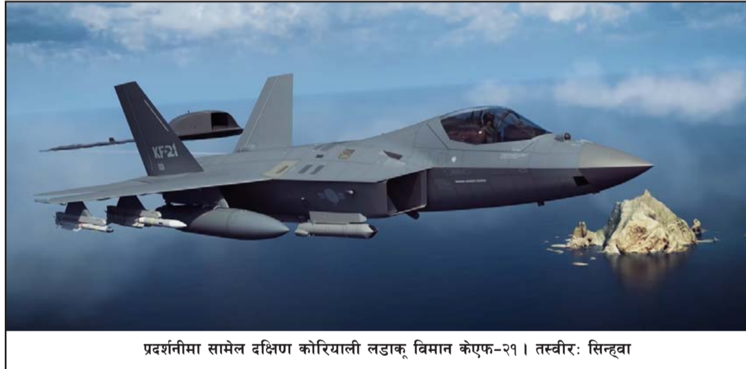
प्रदर्शनीमा सामेल दक्षिण कोरियाली लडाकु विमान कोएफ-२१।

वाशिंगटन र प्योङयाङबीच आणविक वार्ता उत्तरको