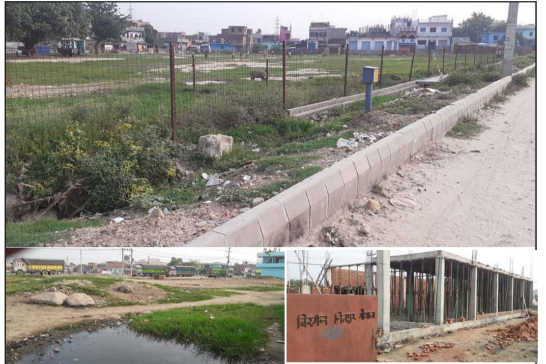
वीरगंज-जीतपुर गौशालाको जग्गा र निर्माणाधीन भवन।

अहिलेसम्म विभिन्न चरणको चुनावमा जसपा र नेका एक भई चुनाव लड्दै आएकोमा समन्वय समितिको चुनावमा फरक गठबन्धनगरेपछि नेताहरूबीच विवाद शुरु भएको छ। महानगर र वीरगंज मनपाको कार्यसमिति सदस्यको छुट्टाछुट्टै निर्वाचनमा नेका र जसपाले आआफ्नो उम्मेदवारलाई जिताएका थिए भने जिससको निर्वाचनमा नेका र जसपा फरक धारमा गएपछि जिल्ला नेतृत्वका नेताहरूबीच विवाद चुलिएको छ।