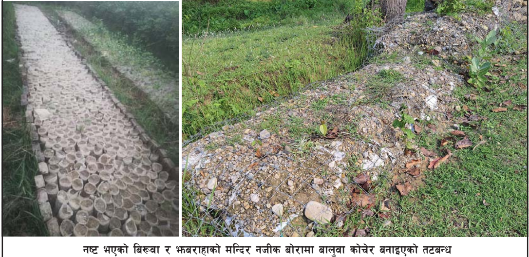
नष्ट भएको बिस्वा र भबराहाको मन्दिर नजीक बोरोमा बालुवा कोचेर बनाइएको तटबन्ध

डिभिजन वन कार्यालय, पर्सामा भएको भ्रष्टाचारको विषयमा अख्तियार दुरुपयोग अनुसन्धान कार्यालयले छानबीन शुरू गरेको छ ।