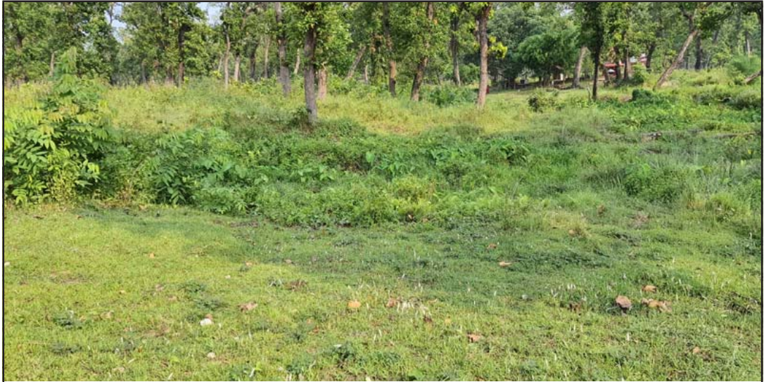
सबैयामा पोखरी बनाइएको भनिएको स्थान तर पोखरी छैन ।

प्रस, वीरगंज, १५ जेठ / कर्मचारीहरूले कामै नगरी नक्कली बिल ठाउँमा बोटबिस्वा नरहे पनि नक्कली मधेश प्रदेश सरकार अन्तर्गत रहेको भर्णाई बनाई भुक्तानी लिएको उजुरीको हेरालु खडा गरी भुक्तानी लिएको समेत