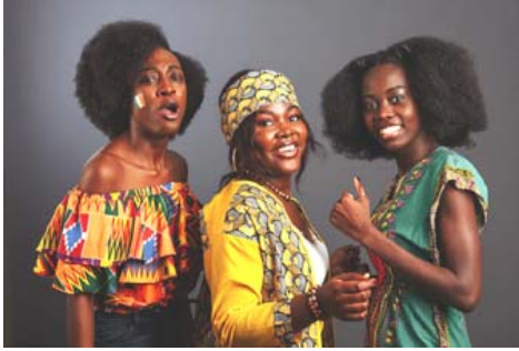
- प्रतीक डेस्क (एजेन्सीको सहयोगमा)

मानव अधिकार समूहका अनुसार कोभिड महामारीपछि किशोर युवतीहरू ठूलो सङ्ख्यामा गर्भवती भएका थिए र त्यसपछि उनीहरूले विद्यालय छाडेका थिए।