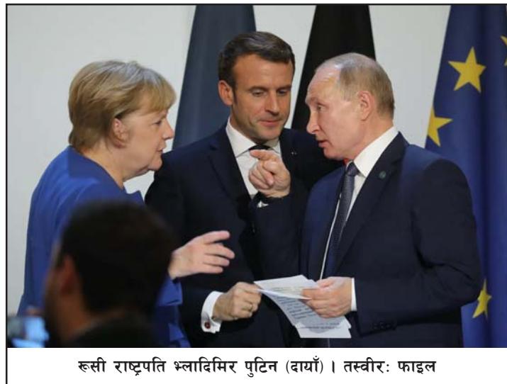
रूसी राष्ट्रपति भ्लादिमिर पुटिन (दायाँ)।

त्यस अवसरमा रूसी राष्ट्रपति पुटिनले युक्रैनको पछिल्लो अवस्था र विशेषगरी युक्रैनमा रूसले गरेको सैन्य कारबाहीबारे जानकारी गराएका थिए।