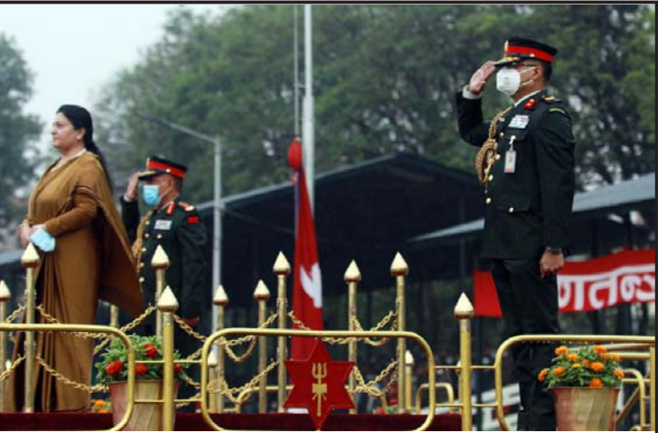
राष्ट्रपति विद्यादेवी भण्डारी, उपराष्ट्रपति नन्दबहादुर पुन, प्रधानमन्त्री शेरबहादुर देउवालागायत गणतन्त्र दिवस २०७९ को अवसरमा गणतन्त्र दिवस मूल समारोह समितिद्वारा आइतवार टुँडिखेलमा आयोजित समारोहमा सहभागी हुँदै र सलामी ग्राहण गर्दै राष्ट्रपति भण्डारी ।