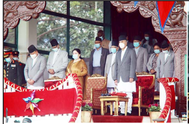
राष्ट्रपति विद्यादेवी भण्डारी, उपराष्ट्रपति नन्दबहादुर पुन, प्रधानमन्त्री शेरबहादुर देउवालागायत गणतन्त्र दिवस २०७९ को अवसरमा गणतन्त्र दिवस मूल समारोह समितिद्वारा आइतवार टुँडिखेलमा आयोजित समारोहमा सहभागी हुँदै र सलामी ग्राहण गर्दै राष्ट्रपति भण्डारी ।

यसैबीच पोखराबाट जोमसोम उडानका क्रममा हराइरहेको तारा