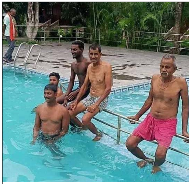
पर्सा धोबिनीका निर्वाचित जनप्रतिनिधिहरू कार्यपालिका सदस्यको मतदानको पूर्व सन्ध्यामा सौराहाको एउटा स्विमिङपुलमा रमाइलो गरेको दृश्य।

सदस्यमध्येबाट पाँचजना महिला सदस्य तथा अन्य तीनजना खुला पुरुषमा दलित तथा अल्पसङ्ख्यक र गापालमा चारजना