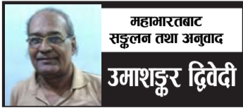
महामारवाट सङ्कलन तथा अनुवाद उमाशङ्कर द्विवेदी

यो सुनेर युधिष्ठिरले अर्जुनलाई अङ्गमाल गरेर पिठ्यौं सुम्सुम्याउँदै