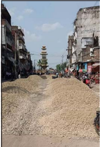
घण्टाघर-आदर्शनगर सडक बन्दै र वीरगंजको सरसफाइ अनुगमन गर्दै नवनिर्वाचित नगरप्रमुख सिंह ।

यसैगरी नगरप्रमुख सिंहले चौबीस घण्टाभित्र वीरगंजमा परिवर्तनको