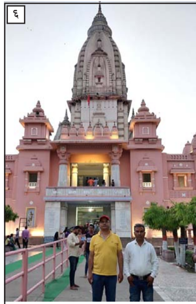
६. बिच्यु स्थित नयाँ काशी विश्वनाथ मन्दिरमा सम्पादक तथा लेखकद्वय, ७. गंगा घाटको सन्ध्याकालीन तस्वीर, ८. ललिताघाट अवस्थित श्रीसाम्राज्येश्वर पशुपतिनाथ महादेव मन्दिरमा हामी।

प्रवेशद्वारमा सुरक्षा चेकजाँचपछि मन्दिर क्षेत्रमा प्रवेश गरेलगत्तै मन्दिरको सौन्दर्य देखेर हामी अचम्मित थियौं। कता-कता हेर्ने ? यता हेरे उताको छटा छुट्टै अवस्था