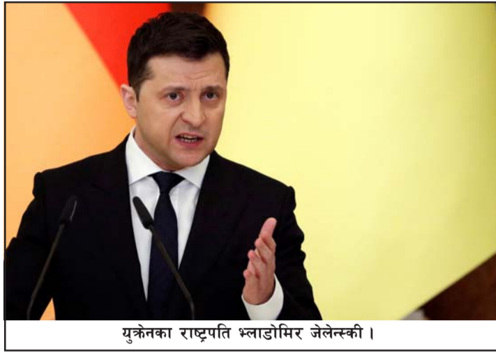
युक्रेनका राष्ट्रपति भ्लाडोमिर जेलेन्स्की।

लागि पनि आग्रह गर्न दिएको प्राप्त समाचारमा जनाइएको छ। रुसले युक्रेनमा गरेको सैन्य हमलापछि हाल युक्रेन दृष्टमा परेको छ। यहाँका