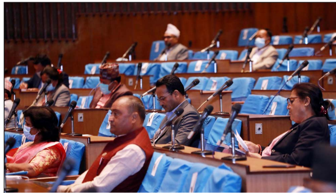
बुधवार बसेको प्रतिनिधिसभाको बैठक।

राष्ट्रपति विद्यादेवी भण्डारीले वैशाख २५ गते प्रमाणीकरण गरेको अध्यादेश मङ्गलवार स्वास्थ्यमन्त्री खतिवडाले प्रतिनिधिसभामा पेश गरेका हुन्। राष्ट्रपतिले जारी गरेको उक्त अध्यादेश राजपत्रमा पनि प्रकाशित भइसकेको छ। उपचारका क्रममा बिरामीको मृत्यु भएपछि मृतकका आफन्तले स्वास्थ्यकर्मीमाथि हातपात तथा कुटपिट गर्ने, स्वास्थ्य संस्थामा आगजनी गर्ने जस्ता गतिविधि हुन थालेपछि सरकारले त्यसलाई नियन्त्रण गर्न सो कानून ल्याएको हो।