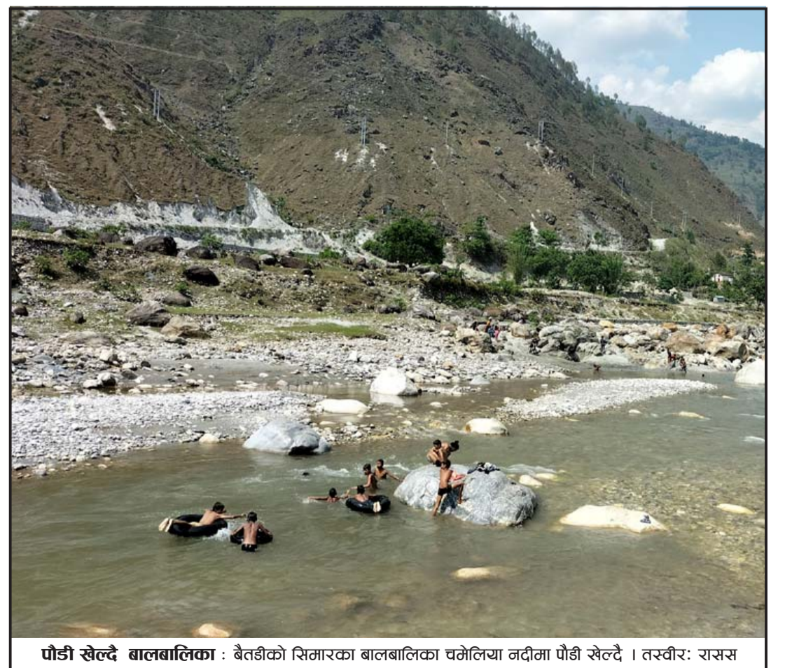
पौडी सेल्दे बालबालिका : बैतडीको सिमारका बालबालिका चलेलिया नदीमा पौडी सेल्दे।