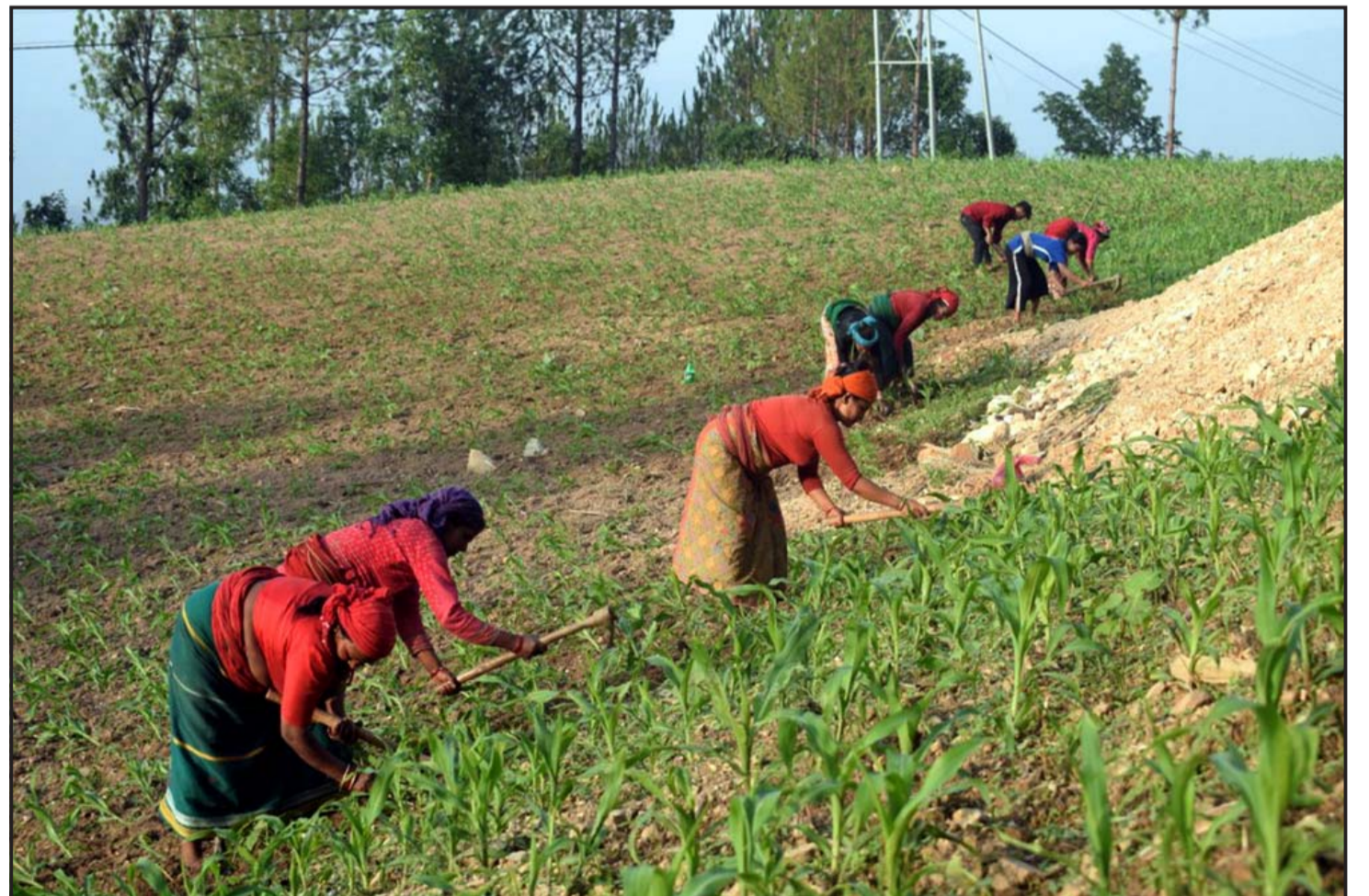
मकै गोड्दै किसान : गुल्मीको घुर्कोट गाउँपालिका-४ जैसीथोकमा मकै गोड्दै किसान ।

यस्तै, वडा सदस्यमा काङ्ग्रेसले चार हजार १११ मा जीत हासिल गरी ६६ स्थानमा अग्रता कायम गरेको छ । सो पदमा एमालेले तीन हजार ५४५ स्थानमा जीत हासिल गरी ८६ मा अग्रता कायम गरेको छ । माओवादी केन्द्रले वडा सदस्यमा एक हजार ५१८ स्थानमा जीत र १५ मा अग्रता कायम गरेको छ । जनता समाजवादी पार्टी नेपालले सो पदमा ३३९ स्थानमा जीत र १३ स्थानमा अग्रता कायम गरेको छ । स्वतन्त्रसहित अन्यले ८०४ स्थानमा विजय हासिल गरी पाँच स्थानमा अग्रता कायम गरेका छन् । विसं २०७४ मा पहिलो चरणमा भएको स्थानीय तहको निर्वाचनका आधारमा यही जेठ ५ गते स्थानीय सरकारका जनप्रतिनिधिको कार्यकाल सकिँदैछ ।