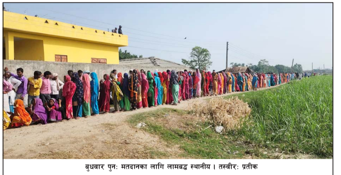
बुधवार पुनः मतदानका लागि लामबद्ध स्थानीय ।

जनाएका छन् । मतदान गर्न बुधवार बिहानैदेखि बुथमा