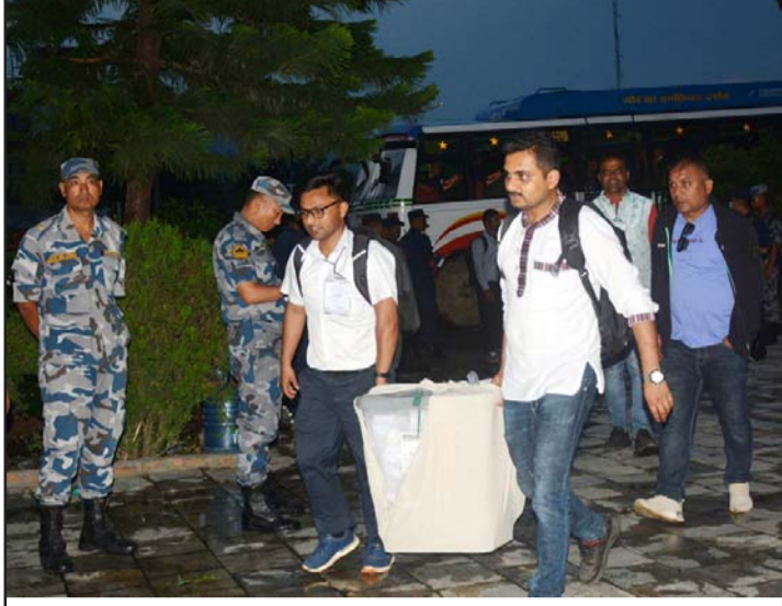
व्यास नगरपालिका-८ रिस्तीस्थित गाविस भवन फेदीमा भएको पुनः मतदानपश्चात् मतपेटिका मुख्य निर्वाचन अधिकृतको कार्यालयमा ल्याउँदै ।

कुल २५ वटा वडा रहेको जनकपुरधाम उपमहानगरपालिकाको हालसम्म सातवटा वडाको मतगणना