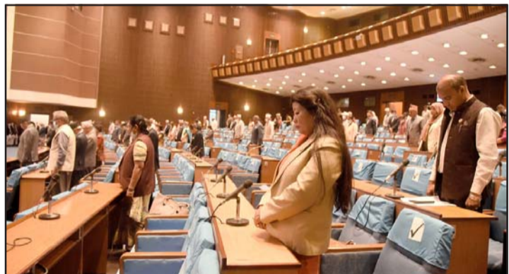
मङ्गलवार बसेको प्रतिनिधिसभाको बैठक।