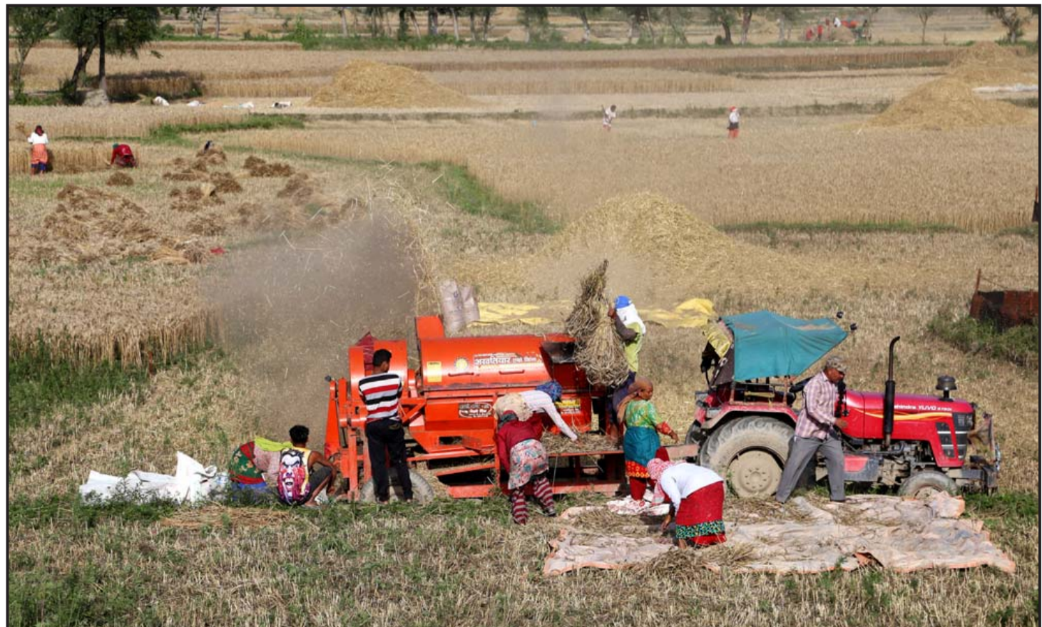
मकपुरको चाँगुनारायणमा गर्हुँ भिन्साउँदै स्थानीय किसानहरू।

नेप्सेका अनुसार सामुदायिक लघुवित्त ४.९६, बोटलस नेपाल २, एनआइबिएल समुद्धि फन्ड १.६६, सनराइज फस्ट म्युचुअल फन्ड १.०४ र एनएमबी ५० का लगानीकर्ताले ०.९३ प्रतिशतले कमाए। त्यस्तै, युनाइटेड इन्स्योरेन्स, लुम्बिनी जनरल इन्स्योरेन्स र सूर्योदय बोमी लघुवित्तका लगानीकर्ताले १० प्रतिशतले गुमाए। बुद्धभूमि नेपाल हाइड्रोपावर ९.८४ र इमर्जिड नेपाल ९.५६ प्रतिशतले गुमाए।