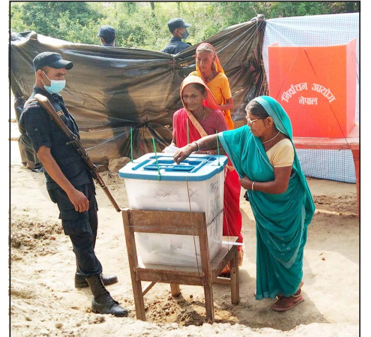
रुपनी गाउँपालिका-५ बसबिट्टीस्थित वडा कार्यालय भवनको मतदान केन्द्रमा मतदान गर्दै महिला।