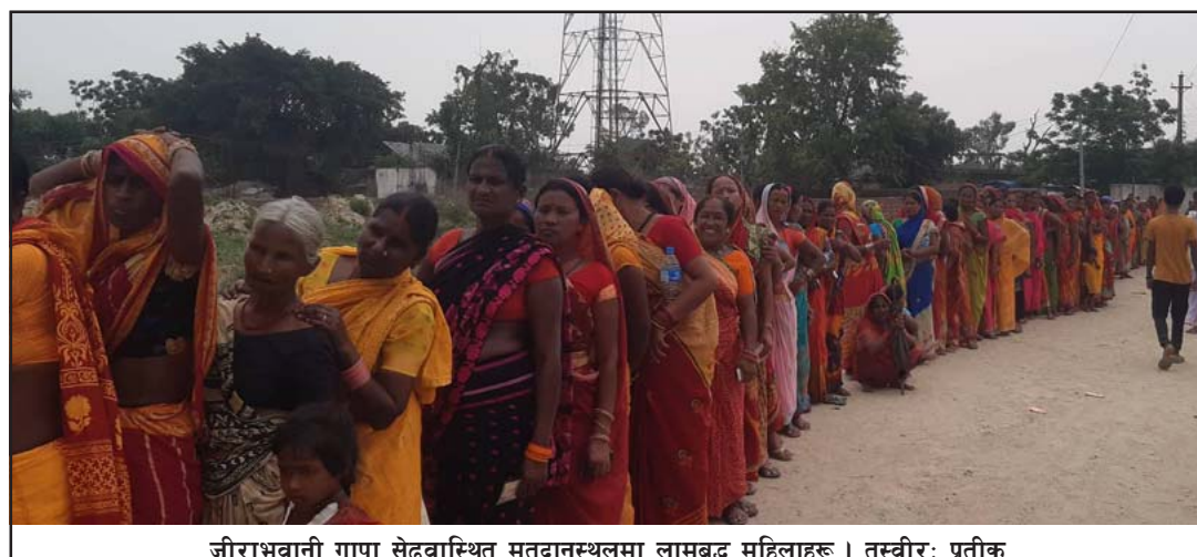
जीराभवानी गापा सेढवास्थित मतदानस्थलमा लामबद्ध महिलाहरू।

त्यस्तै, फरक-फरक नामावलीको क्रम सङ्ख्या फरक-फरक भएकाले पनि मतदाताहरू परिचयपत्र लिएर केन्द्र भौतारिन परेको पनि थुप्रैले गुनासो गरे। अनलाइनबाट पनि मतदाता क्रम सङ्ख्या फरक परेका कारण मतदाताहरू मतदान गर्न लामो समयसम्म दुःख भेल्नुपरेको थियो।