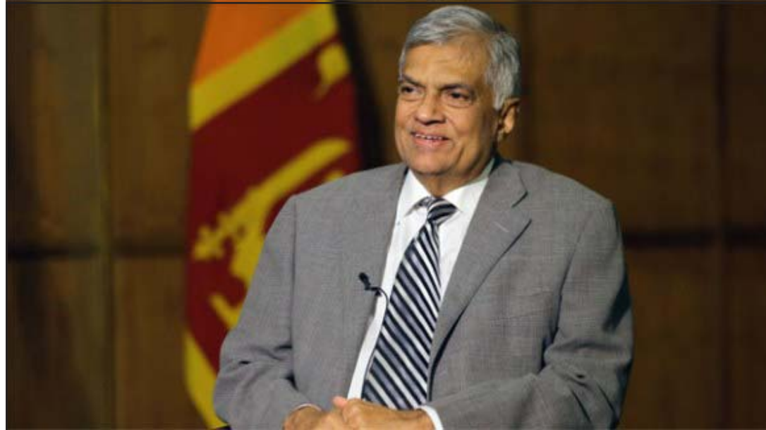
श्रीलङ्काका नवनियुक्त प्रधानमन्त्री रनिल विक्रमासिंघे।

बिहीवार नयाँ प्रधानमन्त्रीका रूपमा राष्ट्रपति गोटाबाया राजापाक्षेले रनिल विक्रमासिंघेलाई नियुक्त गरेका हुन्।