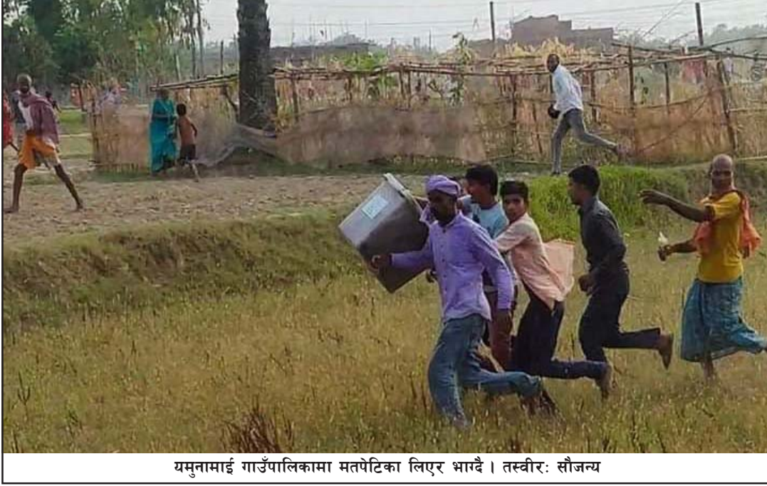
यमुनामाई गाउँपालिकामा मतपेटिका लिएर भाग्यै।

सर्लाहीको धनकौलमा पनि गोली चलेको छ। मतदान शुरू हुनुअगावै कार्यकर्ताबीच झडप हुन थालेपछि प्रहरीले छ राउन्ड गोली प्रहार गरेको थियो। धनकौल गापा-२ पशु सेवा केन्द्र मतदानस्थलमा