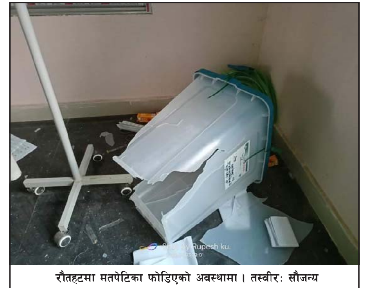
रौतहटमा मतपेटिका फोडेको अवस्थामा।

यस्तै, रौतहटको गढीमाई नपा-३ लक्ष्मीपुरमा मतदानको क्रममा झडप भएको छ। लक्ष्मीपुरस्थित खरिदी प्राथमिक