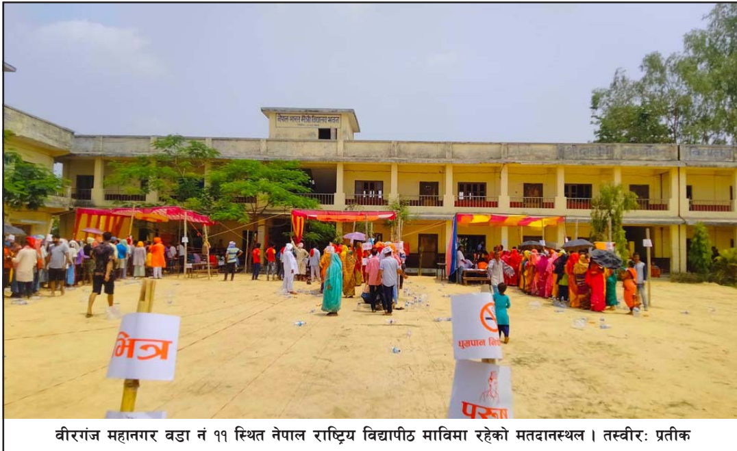
वीरगंज महानगर वडा नं ११ स्थित नेपाल राष्ट्रिय विद्यापीठ माविमा रहेको मतदानस्थल।

व्यवस्था मिलाएको थियो। त्रुटिका कारण मतदानबाट वञ्चित निर्वाचन आयोगले जारी गरेको मतदाता नामावलीमा भएको त्रुटिका कारण दर्जनौं मतदाता मतदान गर्नबाट वञ्चित भए। आयोगले दिएको मतदाता