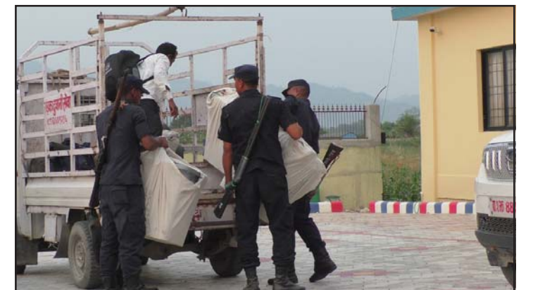
निजगढमा शान्तिपूर्ण मतदानपश्चात् मतपेटिका मतगणनास्थलमा लैजाँदै सुरक्षाकर्मी।

प्रस, वीरगंज, ३० वैशाख/ निजगढ नगरपालिकामा उत्साहजनक मतदान भएको छ। निजगढ नपाका १३ वटै वडामा शान्तिपूर्णरूपमा मतदान सम्पन्न भएको बताइएको छ। निजगढ नपामा कुल २८ हजार ३७६ जना मतदाता रहेकामा २१ हजार