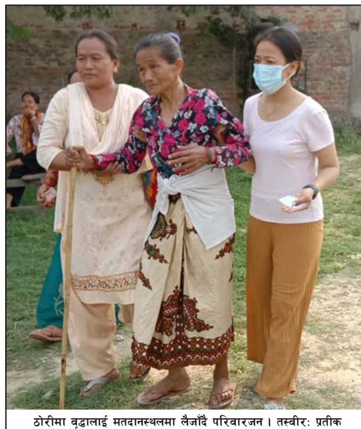
ठोरीमा वृद्धालाई मतदानस्थलमा लैजाँदै परिवारजन।