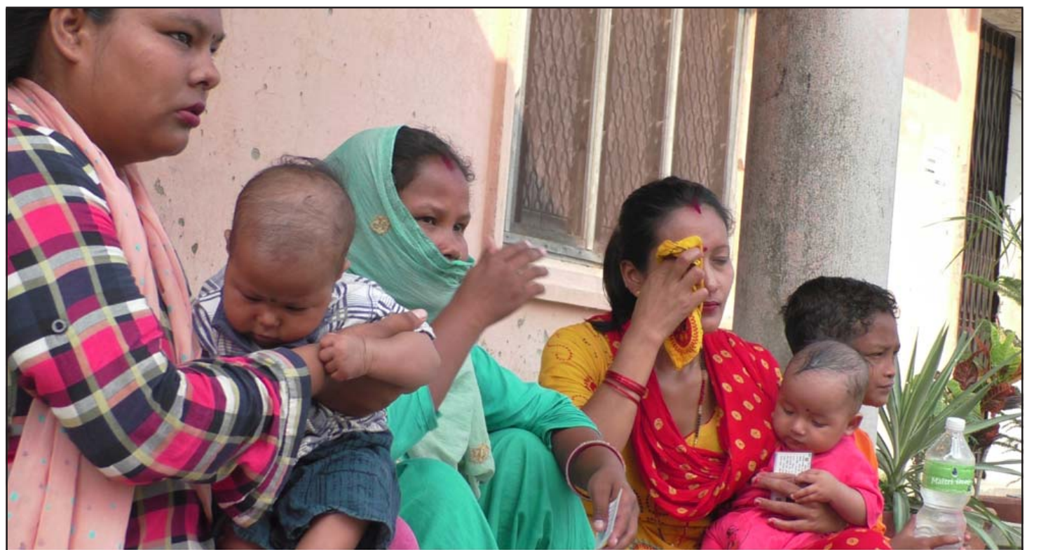
हातमा मतदाता परिचयपत्र र साना नानीबाबु बोकी मतदान गर्न आएका मतदाता केहीबेर शीतलमा थकाइ मार्यै। निजगढमा केही दिनयता बिहानैदेखि गर्मी बढेको छ।

Aadarsh Nagar, Birgunj, Nepal, www.lordshotels.com,