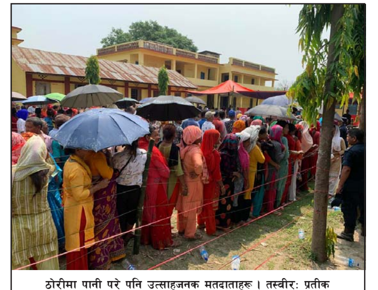
ठोरीमा पानी परे पनि उत्साहजनक मतदाताहरू।

छ। शुक्रवार बिहान ७ देखि साँझ ५ बजेसम्मको मतदान समयमा १४ वटै पालिकामा उत्साहजनक सहभागितामा मतदान सम्पन्न भएको छ। छिटपुट्टैरूपमा