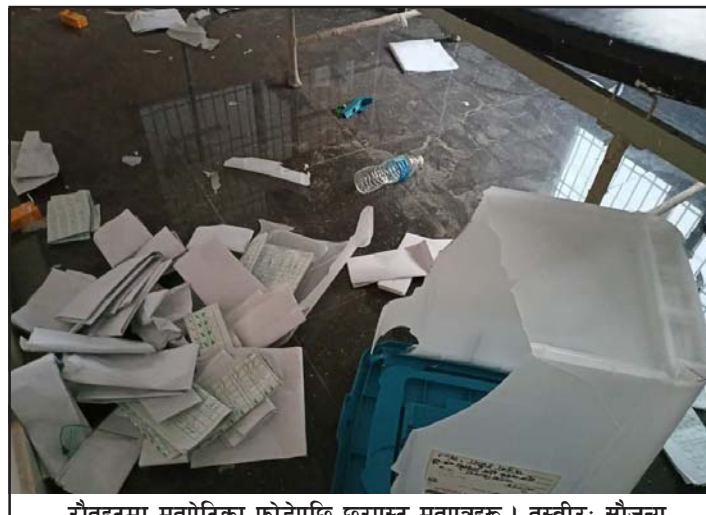
रौतहटमा मतपेटिका फोडेपछि छरपस्ट मतपत्रहरू।

मतदान केन्द्रमा प्रवेश गर्दा अवरोध गरेका