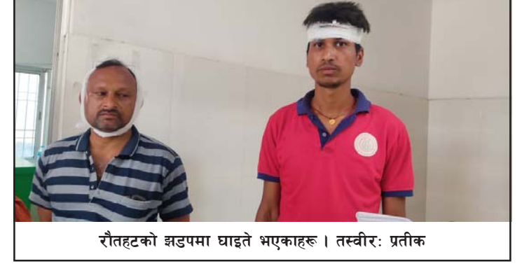
रौतहटको झडपमा घाइते भएकाहरू।

छिपहरमाई गापामा दुई पक्षबीचको झडप साम्य पार्न प्रहरीले चार राउन्ड हवाई फायर गरेको थियो।