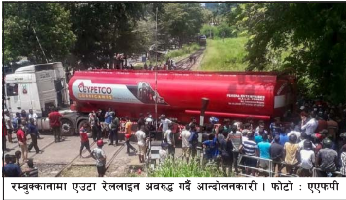
रम्बुक्कानामा एउटा रेललाइन अवरुद्ध गर्दै आन्दोलनकारी।

कोलम्बो, ७ वैशाख/एएफपी श्रीलङ्काको मध्य भागमा पर्ने रामबुक्कानामा बुधवार कर्फ्यु लगाइएको छ। सरकार विरोधी आन्दोलनका क्रममा मङ्गलवार एकजना व्यक्तिको मृत्यु भएपछि भोलिपल्ट कर्फ्यु लगाइएको हो। आन्दोलन थप चर्किने देखिएकोले सरकारले शान्ति सुरक्षा कायम गर्न भन्दै कर्फ्यु लगाउनुपरेको जनाएको छ। घटनाको निष्पक्ष छानबीन गरी सत्य-तथ्य पत्ता लगाई दोषीलाई कारबाई गरिने सरकारी अधिकारीहरूले प्रतिबद्धता जनाएका छन्। आर्थिक सङ्कटका कारण मुलुकमा अभाव र मूल्य वृद्धि भएकोले त्यसको न्यूनीकरणका लागि आम जनता आन्दोलन गर्दैछ। आन्दोलनकारीहरूले समस्या समाधानका लागि राष्ट्रपति गोटावाय राजापाक्षले पदबाट राजीनामा दिनुपर्ने माग राखेका छन्। मुलुकमा आर्थिक सङ्कट उत्पन्न हुनु,