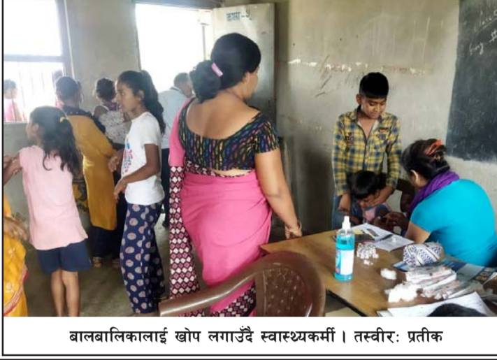
बालबालिकालाई खोप लगाउँदै स्वास्थ्यकर्मी ।