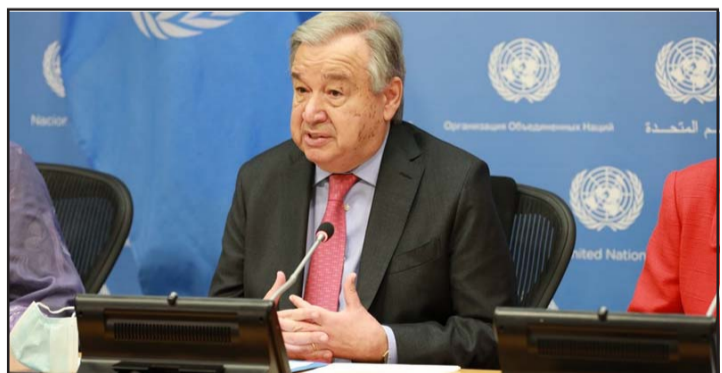
सञ्चारकर्मीलाई सम्बोधन गर्दै महासचिव एन्टिनिओ गुटर्रेस।

संयुक्त राष्ट्रसङ्घ, ७ वैशाख/सिन्हा संयुक्त राष्ट्रसङ्घका महासचिव एन्टोनियो गुटर्रेसले युक्रेनमा क्रिश्चियन बिदाको समय, इस्टरका समयमा कम्तीमा चार दिन आक्रमण रोकन आग्रह गरेका छन्। उनले क्रिश्चियनको बिदाका समयमा आक्रमण नगर्न आग्रह गर्दै सो समयमा मानवीय सहायता वितरणका