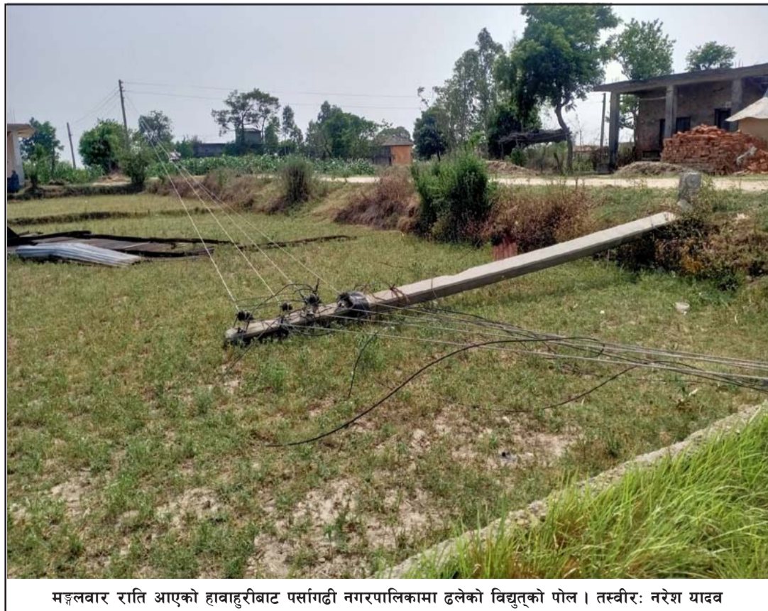
मङ्गलवार राति आएको हावाहुरीबाट पर्सगढी नगरपालिकामा ढलेको विद्युत्को पोल।