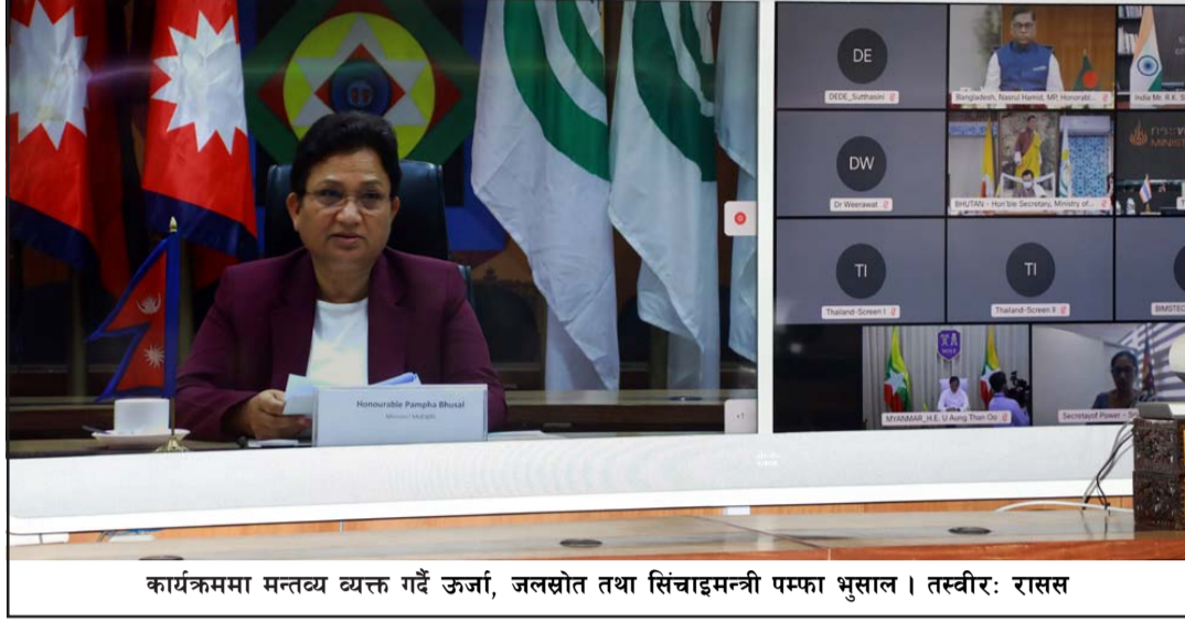
कार्यक्रममा मन्त्रव्य व्यक्त गर्दै ऊर्जा, जलस्रोत तथा सिंचाइमन्त्री पम्फा भुसाल।

ऊर्जाको रूपमा प्रयोग गर्न जोड दिइन्। ऊर्जा प्रवर्द्धनमा पर्याप्त आर्थिक लगानी गर्न जोड दिँदै उनले बिस्टेक क्षेत्रमा प्रविधि हस्तान्तरणलाई प्रवर्द्धन गर्दै जानुपर्ने बताइन्।