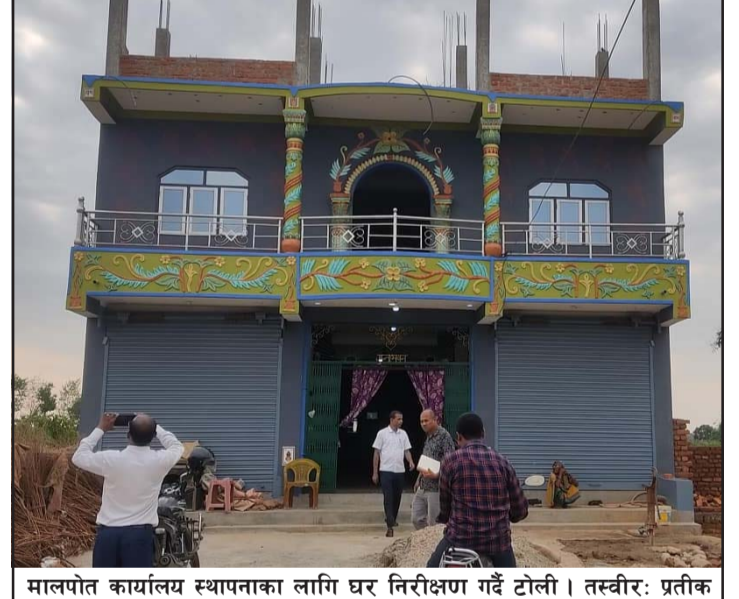
मालपोत कार्यालय स्थापनाका लागि घर निरीक्षण गर्दै टोली ।