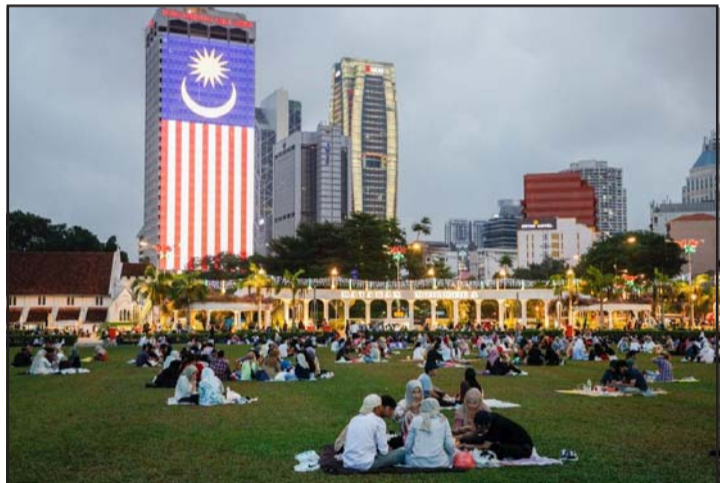
क्वालालम्पुरमा रमदान महीनाको व्रत तोड्दै (अफ्तारी) को खाजा खाँदै दातार न मेडेका मस्जिदमा श्रद्धालुहरू।

भारतमा कोरोना भाइरसबाट पछिल्लो एक दिनमा थप दुई हजारजना सङ्क्रमित भएका छन्। सरकारी अधिकारीहरूले बुधवार दिएको जानकारी अनुसार पछिल्लो २४ घण्टामा भारतमा दुई हजार ६७ जना सङ्क्रमित भएका हुन्। सङ्घीय स्वास्थ्य मन्त्रालयले अघिल्लो दिनभन्दा ८२० जना बढी सङ्क्रमित देखिएको जनाएको छ। मङ्गलवार सार्वजनिक गरिएको विवरणमा एक हजार २४७ जना कोरोना भाइरसबाट सङ्क्रमित भएको उल्लेख थियो। भारतमा अहिले १२ हजार ३४० जना कोरोना भाइरसका सक्रिय सङ्क्रमित रहेका अधिकारीहरूले जनाएका छन्। पछिल्लो २४ घण्टामा एक हजार ५४७ जना कोरोना भाइरसबाट सङ्क्रमणमुक्त भएको मन्त्रालयले जनाएको छ। महामारी शुरू भएदेखि अहिलेसम्म कुल चार करोड २५ लाख १३ हजार २४८ जना सङ्क्रमणमुक्त भएका छन्। त्यसैगरी कोरोनाका कारण अहिलेसम्म भारतमा पाँच लाख २२ हजार छजनाको मृत्यु भएको छ। तीमध्ये ४० जनाको पछिल्लो एक दिनमा मृत्यु भएको हो। रासस