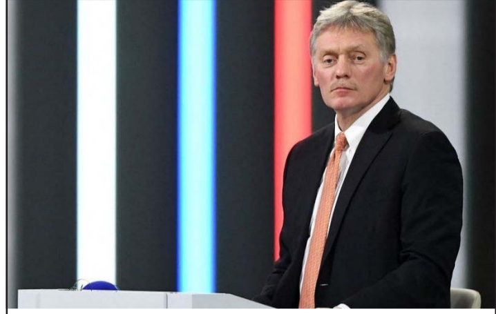
नाटो विस्तारले युरोपको स्थायित्वलाई जोखिममा पार्ने रुसी प्रवक्ता दमित्री पेस्कोभको चेतावनी।

थुप्रै विदेशी नेता र उच्च अधिकारीहरूले हालै युक्रेन भ्रमण गरिरहेका छन् र रुसी सैन्य कारबाई विरुद्ध युक्रेनको पक्षमा समर्थन व्यक्त गरेका छन्। रासस