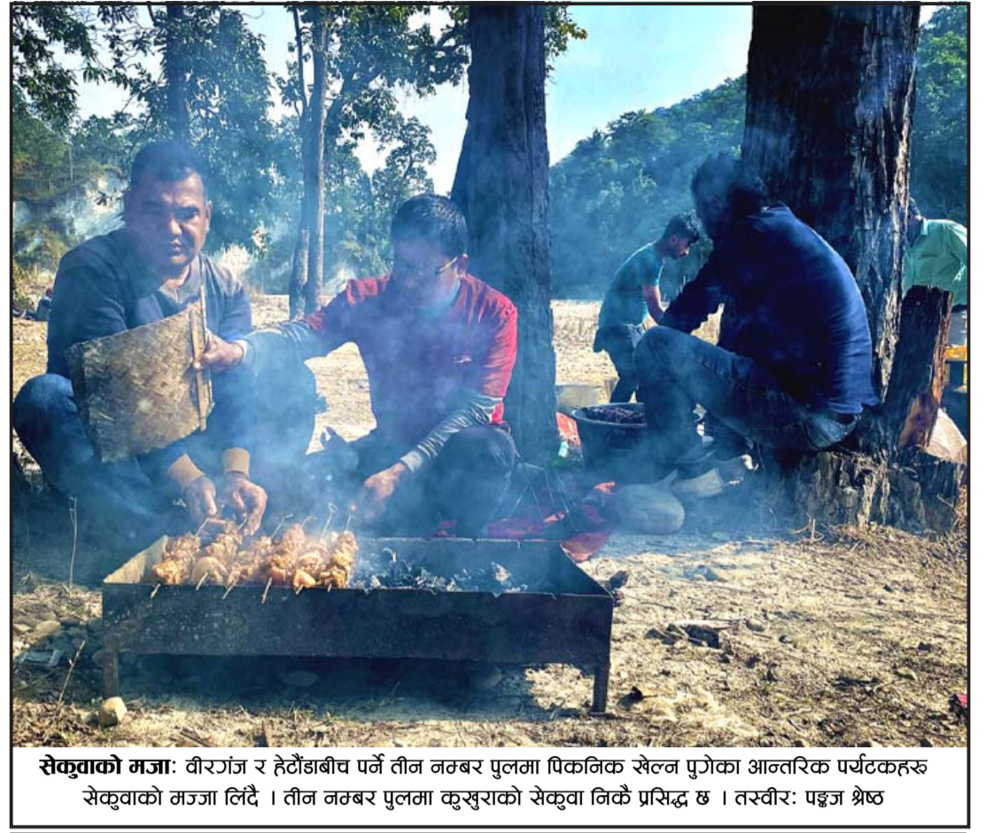
सेकुवाको मजा: वीरगंज र हेटौडाबीच पर्ने तीन जठबर पुलमा पिकनिक सेलन पुगेका आन्तरिक पर्यटकहरू सेकुवाको मजा लिँदै। तीन जठबर पुलमा कुसुराको सेकुवा निकै प्रसिद्ध छ।

बालभ्रम दण्डनीय अपराध हो बालबालिकालाई कुनै पनि भ्रमजन्य कार्यमा नलागाऔं। वीरगंज महानगरपालिका