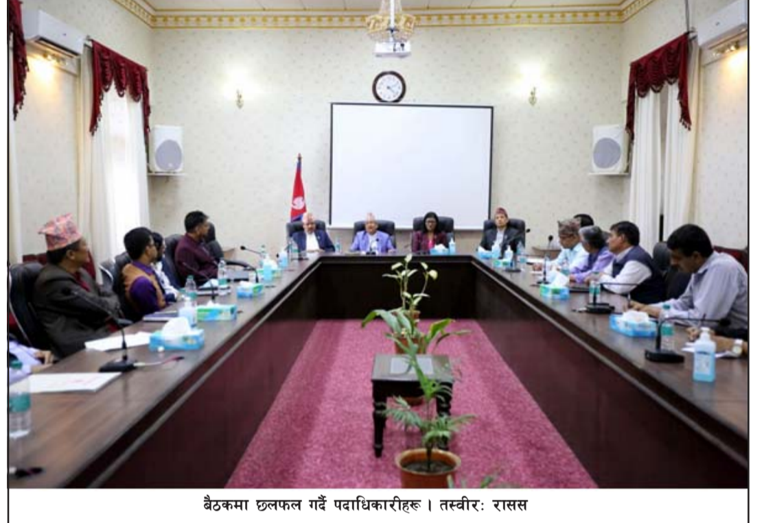
बैठकमा छलफल गर्दै पदाधिकारीहरू ।

कार्यक्रम र गतिविधिलाई निर्वाचनसँग जोडेर लैजान सल्लाह दिए । सार्वजनिक सञ्चारमाध्यम आफैं