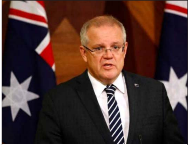
अस्ट्रेलियाका प्रधानमन्त्री स्कट मोरिसन ।

वाशिंग्टन, २३ चैत / सिन्धुवा प्रधानमन्त्री बोरिस जोनसन, अस्ट्रेलियाका संयुक्त राज्य अमेरिका, बेलायत र प्रधानमन्त्री स्कट मोरिसनले