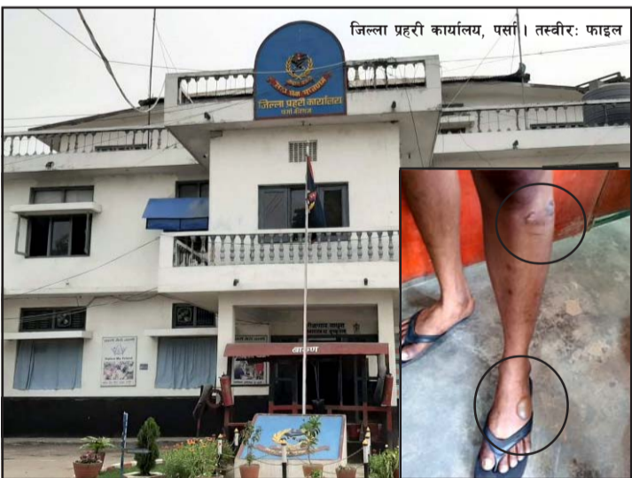
जिल्ला प्रहरी कार्यालय, पर्सा ।