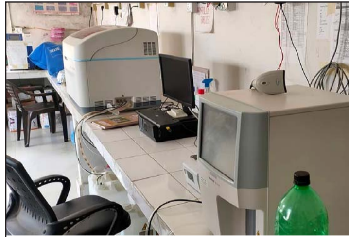
केमिकल अभावमा प्रयोगशालामा थन्किएको मेसिन ।

सरोकारवालाहरु मौन छन् । प्रयोगशालामा चार महीनादेखि विभिन्न केमिकलहरूको अभाव रहेको