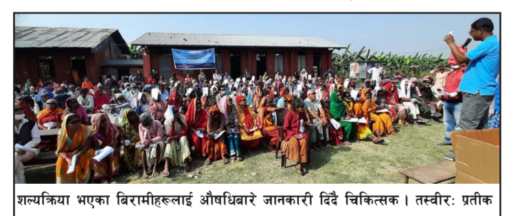
शल्यक्रिया भएका बिरामीहरूलाई औषधिबारे जानकारी दिँदै चिकित्सक ।