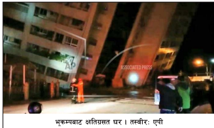
भूकम्पबाट क्षतिग्रस्त घर।

बेइजिङ/ताइपेई, ९ चैत/सिन्धुवा अक्षांश र १२१.५५ डिग्री पूर्वी देशान्तरमा अनुगमन गरिएको सिइएनसीले जनाएको