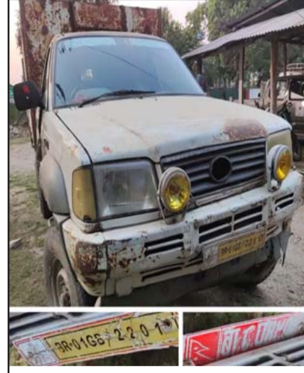
तामागढी साझेदारी वन सिम्री क्षेत्रबाट सालको गोलियासहित पिकअप नियन्त्रणमा लिई वन सुरक्षाकर्मी ।

जीतलाल श्रेष्ठ, निजगढ, ६ चैत / बारामा काठ चोरी तस्करीका