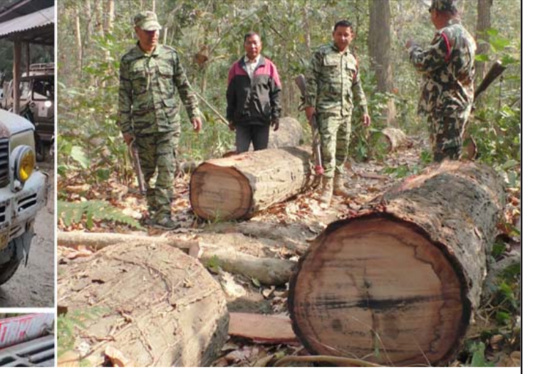
तामागढी साझेदारी वन सिम्री क्षेत्रबाट सालको गोलियासहित पिकअप नियन्त्रणमा लिई वन सुरक्षाकर्मी ।

बाराका जमदार एवं सशस्त्र वनरक्षक धुवकुमार कटुवालले बताए ।