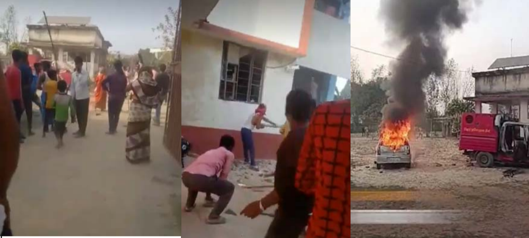
प्रहरी थानामा तोडफोड, आगजनी गर्दै स्थानीय।