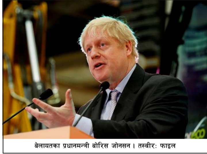
बेलायतका प्रधानमन्त्री बोरिस जोनसन ।

लन्डन, ६ चैत/एएनआई/ स्पुतनिक बेलायतका प्रधानमन्त्री बोरिस व्यक्तित्व र प्रेरणाको स्रोत पनि साबित भएका छन् ।