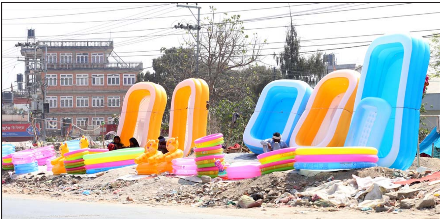
सामग्री विज्ञानी गर्न ग्राहकको प्रतीक्षामा व्यापारी : गर्मी बढेसँगै काठमाडौंको बालाजुस्थित चक्रपथ छेउमा बालबालिकालाई पौडी खेल प्रयोग गरिने विभिन्न सामग्री राखेर ग्राहकको प्रतीक्षामा बसेका सडक व्यापारी।

नेप्सेका अनुसार इमर्जिन्ट नेपाल ९.९८, सगरमाथा इन्स्योरेन्स ६.६४, सोल्टी होटल ६.५१, युनाइटेड इवी मर्दी हाइड्रोपावर ५.८१ र नेपाल पुनर्बीमा कम्पनीका लगानीकर्ताले ४.८७ प्रतिशतले कमाए। नेपाल दूरसञ्चार कम्पनी ५.१३, मैलुङ खोला जलविद्युत् कम्पनी ४.८६, सिफ्टी हाइड्रोपावर ३.९१, माउन्टेन हाइड्रो ३.४५ र नारायणी डेभलपमेन्ट बैंकका लगानीकर्ताले ३.२७ प्रतिशतले गुमाए।