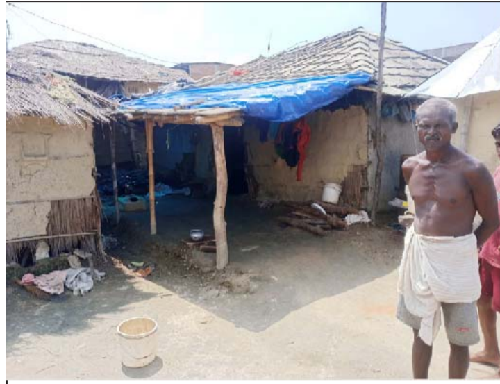
वीरगंज महानगरपालिका-३१ बेलवा रहेको मुसहर बस्ती।

छ। 'कमाइ ल्यायो, भूटी खायो' आहानका उदाहरण मुसहर समुदायमा अहिले पनि नागरिकता बनाउने, पढ्नुपर्ने र सामाजिक/राजनीतिक गतिविधिमा सरिक हुने मालिक (मुसहर गाउँका उपल्लो जात भनिने अरू जाति