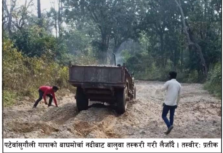
पटेवासुगौली गापाको बाघमोर्चा नदीबाट बालुवा तस्करी गरी लैजाँदै ।

साँझ चार बजेदेखि बिहान आठ बजेसम्म भेडाहा खोलाबाट सयौं ट्याक्टर बालुवा, गिट्टी तस्करी हुने गरेको छ । त्यसैगरी बयलगाडाबाट दिनभरि नै बालुवा ओसारिन्छ । तस्करीगरी ल्याइएको बालुवा, गिट्टी,