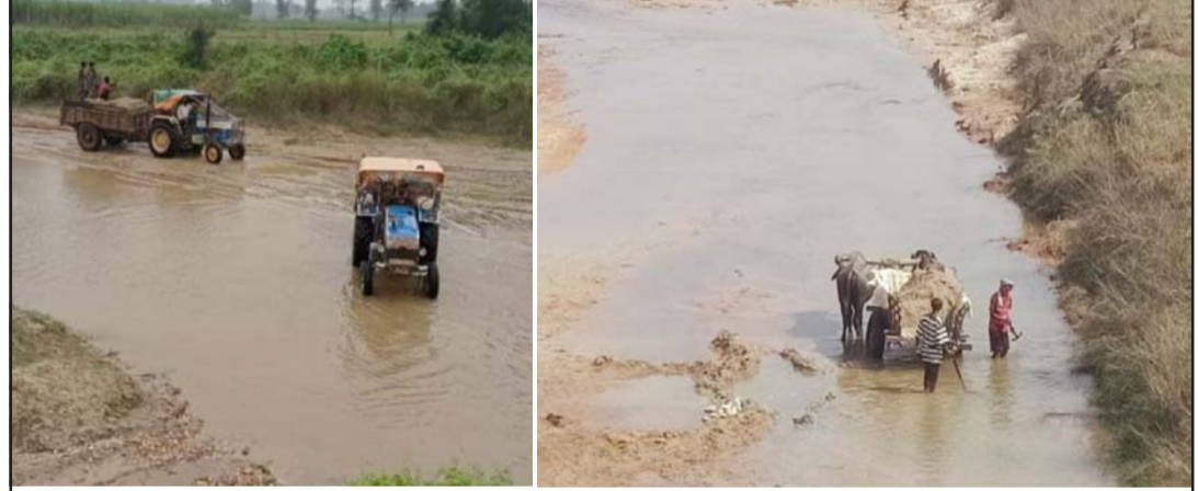
भेडाहा खोलाबाट ट्याक्टर र बयलगाडाबाट बालुवा, ढुङ्गा, ग्रेभलको तस्करी गरिँदै ।

देखेर प्रहरी र स्थानीय तहलाई खबर गर्नुको साटो स्थानीय बासिन्दा