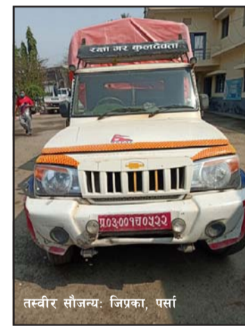
नियन्त्रणमा लिएको जि.प्र.का, पर्साले जनाएको छ।

प्रस, वीरगंज, २६ फागुन/ जिल्ला प्रहरी कार्यालय, पर्साले भन्सार छली भारतबाट ल्याएको ११८ बोरा चामलसहित पिकअप भ्यान नियन्त्रणमा लिएको जनाएको छ। बुधवार राति वीरगंज-११ रानीघाट सडकखण्डबाट प्रदेश ०३-००१ च ०५२२ नम्बरको पिकअप गाडी र सोमा लोड गरिएको ११८ बोरा चामल नियन्त्रणमा लिई आज राजस्व अनुसन्धान कार्यालय, पथलैया, बारामा बुझाइएको जि.प्र.का, पर्साले जनाएको छ। प्रजापनपत्रविनाको भारतीय चामल वीरगंजबाट बाराको जीतपुरतर्फ लार्दै गरेको अवस्थामा प्रहरीले