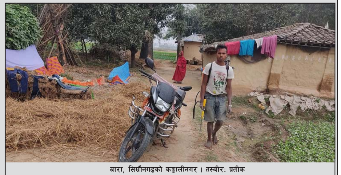
बारा, सिम्रौनगढको कङ्कालीनगर।