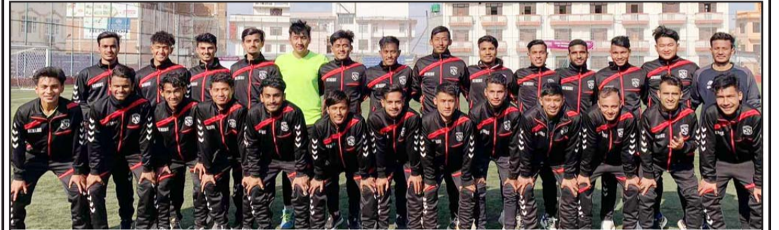
खुमलटार युथ क्लब।

काठमाडौं, २५ फागुन/रासस राजधानीमा जारी शहीद स्मारक 'बी' डिभिजन लिग फुटबल प्रतियोगिता अन्तर्गत आज भएको खेलमा खुमलटार युथ क्लब विजयी भएको छ।