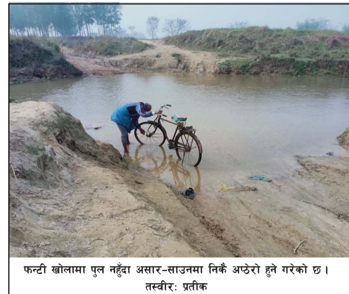
फन्टी खोलामा पुल नहुँदा असार-साउनमा निकै अठेरो हुने गरेको छ ।

वीरगंज तथा औद्योगिक क्षेत्र जान कम समय लाग्ने स्थानीयवासीले बताएका छन् ।