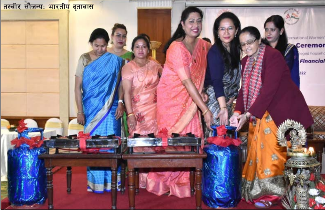
मधेश प्रदेशका सलाही, रौतहट र सप्तरी जिल्लाका पिछडिएका घरपरिवारलाई गराउन भारतीय राजदूतावास, काठमाडौं र नेपाल-भारत महिलामैत्री समाजबीच अवसरमा भारत-नेपाल विकास सहकार्य कार्यक्रम अन्तर्गत समझदारीपत्रमा हस्ताक्षर भएको हो।

प्रस, वीरगंज, २५ फागुन/ एलपी ग्याँस चुलो, ग्याँस सम्झौता भएको छ। भारत सरकारको आर्थिक सहयोगमा सिलिन्डरलगायतका सामग्री उपलब्ध अन्तर्राष्ट्रिय महिला दिवसको