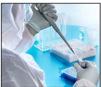
जिका, डेङ्गु र चिकनगुनिया रोगको

काठमाडौं, २५ फागुन/ रासस स्वास्थ्य तथा जनसङ्ख्या मन्त्रालयले