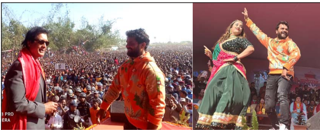
मधानी महोत्सवमा नेपालका महानायक राजेश हमाल, भोजपुरी नायक खेसारीलाल यादव ।

अधिकांश मानिस परिचित कलाकारको अभिनय हेर्न चाहन्छन् । कलाकारसित मानिस उनको अभिनयले नै परिचित हुन्छन् । कलाकारको अभिनय हेर्ने दुई माध्यम छन्- प्रत्यक्ष र अप्रत्यक्ष । यदि धरातलमा उभिएर हेर्ने हो भने सबैभन्दा बढी मानिसले कलाकारको अभिनयलाई अप्रत्यक्ष माध्यमले नै देख्दछन् । अप्रत्यक्ष माध्यममा पनि दुई माध्यम हुन्छन्- सम्पादित अप्रत्यक्ष र असम्पादित अप्रत्यक्ष । सम्पादित अप्रत्यक्ष माध्यममा हामीले सोभो भाषामा भन्ने गरेका सितेमा, टेलिसिरियलहरू पर्दछन् । एकचोटि छायाङ्कन गरेर त्यसलाई न्याब्रमा सम्पादन गरी दर्शकमात्र पुऱ्याइने यस प्रकारका सामग्रीले दर्शकलाई बढी तानेको हुन्छ । यसको कारण के हो भने संवाद तथा गीत वा अन्य क्रियात्मक अभ्यासको समयमा पछाडिबाट अभिनयको भाव अनुसारको सङ्गीत बजिरहेको हुन्छ । सङ्गीतले बुझाइको उत्तेजनामा वृद्धि गरेको हुन्छ । बुझाइको उत्तेजना मात्र नभई सङ्गीतले त दृश्यको भावलाई पनि स्पष्ट पार्न सहयोग गरेको हुन्छ । असम्पादित अप्रत्यक्ष माध्यम भनेको 'लाइभ' हो । आजभोलि लाइभ अर्थात् प्रत्यक्ष प्रसारणको चलन धेरै बढेको छ । सामाजिक सञ्जाल फेसबुक, युट्युब, टेलिभिजन र यस्ता अन्य सामग्रीबाट धेरै दृश्यलाई प्रत्यक्ष प्रसारण गरिने चलन त बढेकै छ । यसरी प्रत्यक्ष प्रसारण भएपनि जो दर्शकले कुनै माध्यमले देख्दछन्, तिनको लागि त असम्पादित