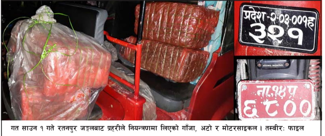
गत साउन १ गते रतनपुर जङ्गलबाट प्रहरीले नियन्त्रणमा लिएको गाँजा, अटो र मोटरसाइकल।