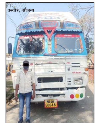
जिप्रका, पर्साले जनाएको छ।