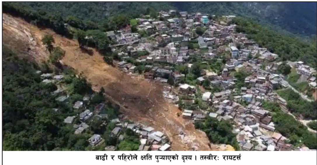
बाढी र पहिरोले क्षति पुऱ्याएको दृश्य।

गर्दा पेट्रोपोलिस र छिमेकी शहरहरू नोभा फ्रिबर्गो र टेरेसोपोलिसलगायतका ठूलो