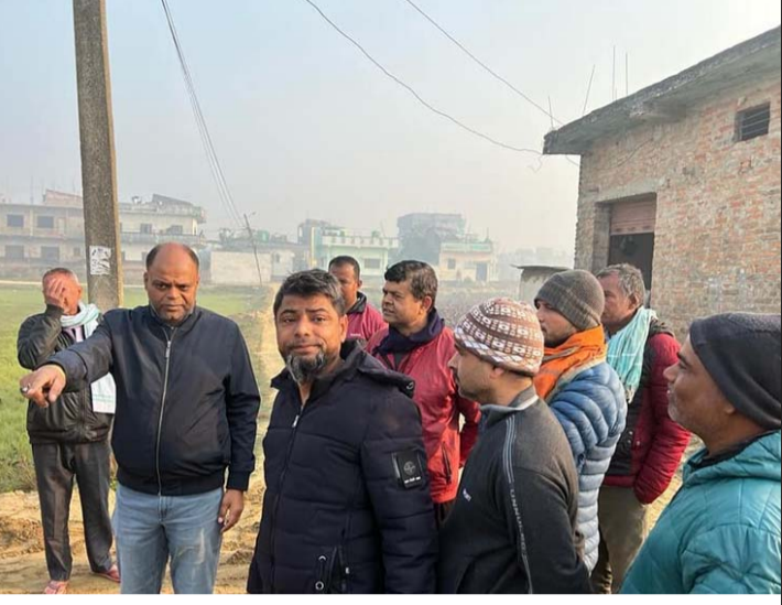
वीरगंज-१६ नगवाको सडक, नाला अनुगमन गर्दै नगरप्रमुख।

निर्माण भइरहेको सो स्थानको निरीक्षण गर्दै गुणस्तरीय काम गर्न ठेकेदारलाई सुझाएका थिए। उनले स्थानीयलाई ठेकेदारले गुणस्तरीय काम गरे नगरेको सम्बन्धी निगरानी गर्न र सोबारे आफूलाई जानकारी गराउन सुझाए। उनले स्थानीयको निगरानी बढेको खण्डमा गुणस्तरीय काम हुने र महानगरपालिकाले एउटै कामको लागि पटकपटक बजेट विनियोजन गर्नुपर्ने बताए। विकास निर्माणको सवालमा स्थानीयको सहभागिता र चासो कम हुँदा गुणस्तरीय काम नहुने गरेको र त्यसबाट बजेट अनावश्यक खर्च भइरहेको तर्फ सबैको चिन्ता हुनुपर्ने बताए। असल कामको लागि खबरदारी गर्ने कार्य कमजोर भएकोले पनि असल काम नगर्ने प्रवृत्ति बढ्दै गएको भन्दै स्थानीयलाई सक्रियतापूर्वक चासो देखाउन आग्रह गरे।