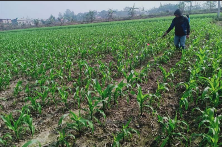
मकैबालीमा फौजी कीराको प्रकोप बढेपछि कीटनाशक औषधि छर्दै ।

किसानहरूले लगाएको मकैखेतीमा फौजी कीराको प्रकोप बढेको छ ।