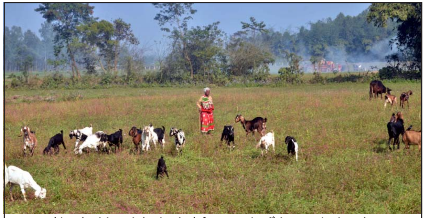
तोरी, मुसुरो बाली मिश्रणपछि खेतबारीमा उम्रिएको घाँसमा बाखा, खसी चराउँदै किसान।

पानले कब्जियत हटाउँछ कब्जियत आजकल एक सामान्य समस्या बनेको छ। यो हाम्रो बिग्रिएको जीवनशैलीसँग सम्बन्धित समस्या हो। यदि तपाईंलाई पनि कब्जियतको समस्या छ भने केही दिन खाना खाइसकेपछि पानको नियमित सेवन गर्नुहोस्। यसका साथै एक गिलास पानीमा पानको पातको टुक्रा हालेर रातभर राख्नु। यो पानी भोलिपल्ट बिहान खाली पेटमा पिउनुहोस्। तपाईंले पक्कै यसबाट लाभ उठाउनुहुनेछ। - प्रतीक डेस्क (एजेन्सीको सहयोगमा)