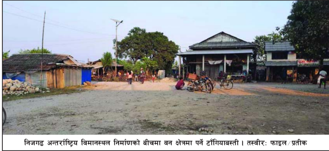
निजगढ अन्तर्राष्ट्रिय विमानस्थल निर्माणको बीचमा वन क्षेत्रमा पर्ने टाँगियाबस्ती ।

गरेका थिए । उनले नचाहिने माग राखेर विमानस्थल बनाउन बाधा व्यवधान खडा