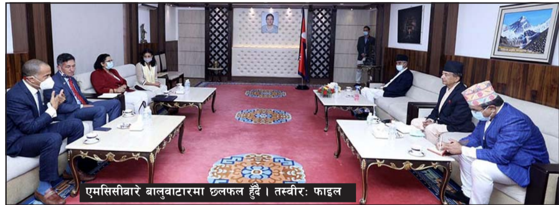
एमसिसीबारे बालुवाटारमा छलफल हुँदै।

त्यसका लागि मात्रै ह नौ खर्बभन्दा बढी लगानी आवश्यक पर्नेछ। आगामी पाँच वर्षमा १३ हजार मेगावाट विद्युत् उत्पादन भएको खण्डमा जलविद्युत् क्षेत्रमा मात्रै करीब ३० खर्बको हाराहारीमा लगानी हुनेछ।