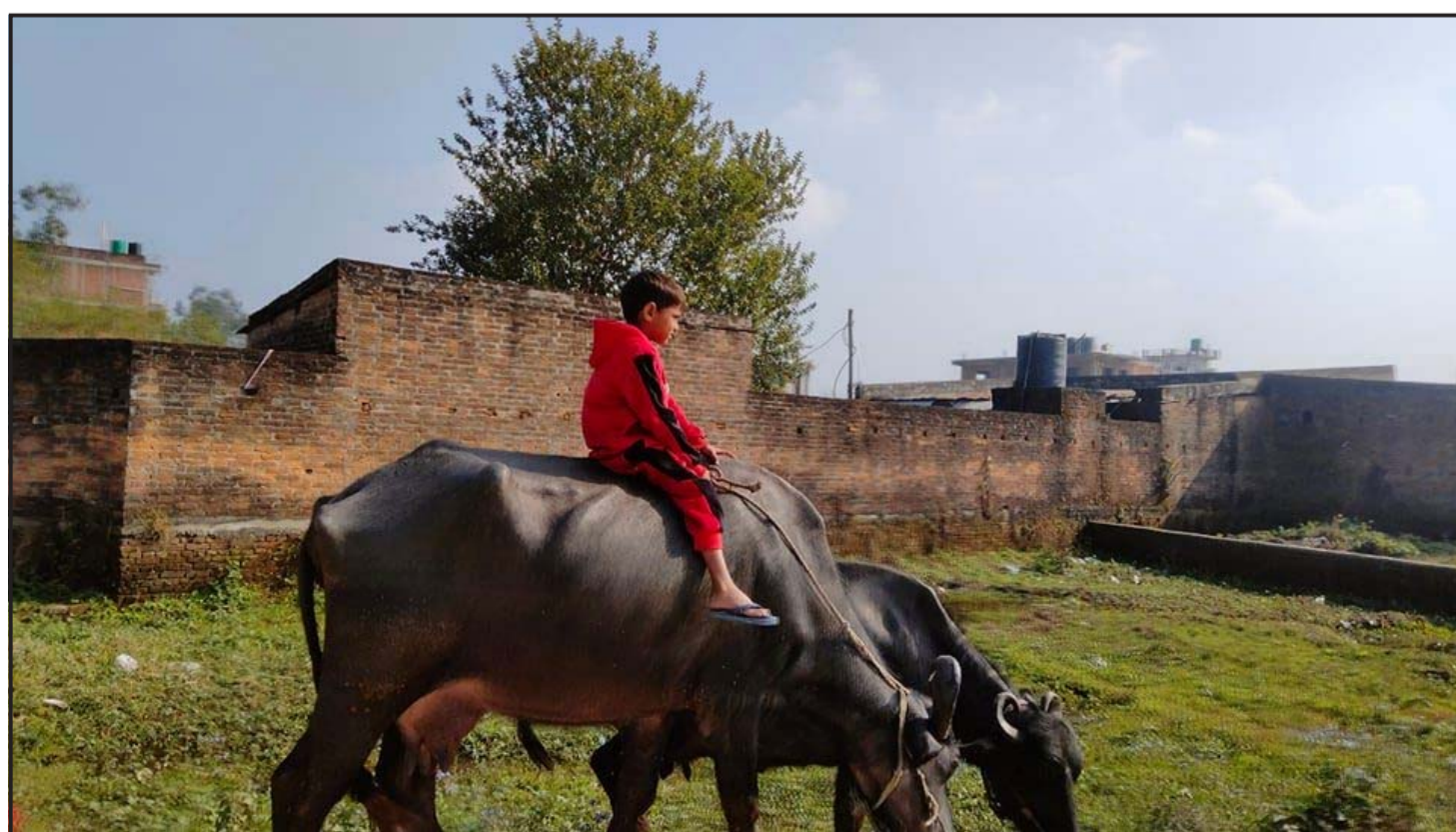
मैसी चराइरहेका बालक स्कूले विद्यार्थी हुन् । शनिवार र बिदाको दिन उनले परिवारका सदस्यहरूसँगै मैसी चराएर सघाउँदै आएका छन् । वीरगंज महानगर-१ जिल्ला शिक्षा समन्वय कार्यालयछेउमा शनिवार मैसी चराउँदै ।

विद्युत् प्रसारण र वितरणतर्फसहित चालू आवको छ महीनामा चुहावट १४.४५ प्रतिशतमा झरेको हो । प्रणालीमा हुने चुहावटमध्ये सबैभन्दा बढी हिस्सा वितरणतर्फको हुन्छ । यस अवधिमा (बाँकी पाँचौँ पातामा)