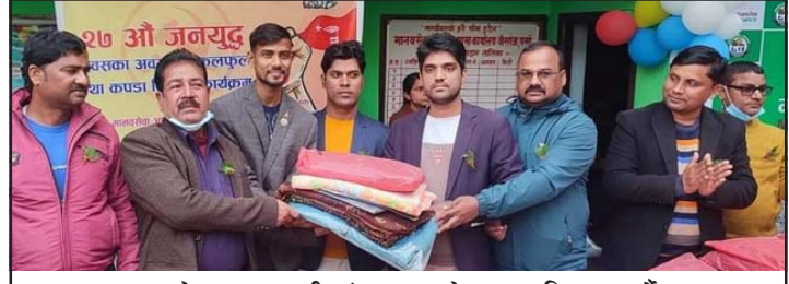
मानवसेवा आश्रम वीरगंजमा न्यानो कपडा वितरण गर्दै।