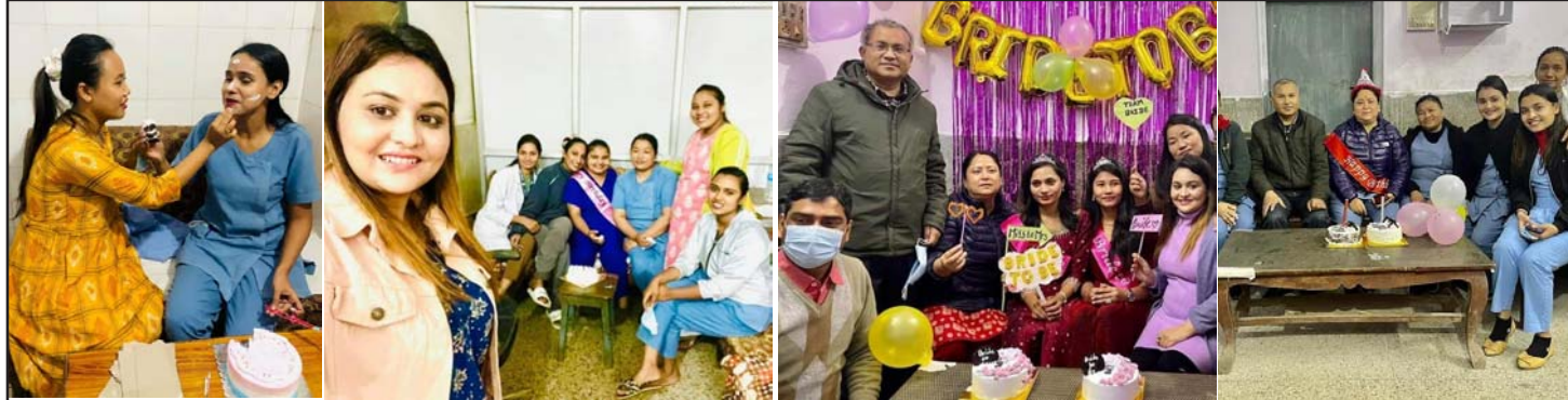
एनआइसियू र गाइनो वार्डमा जन्मदिन मनाउँदै तथा गाइनो वार्डमै बेहुली बन्नेलाई बिदाइ गर्दै ।

प्रस, पोखरिया, १ फागुन/ पोखरिया नगरपालिकाले