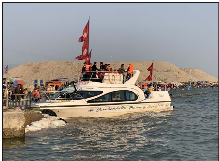
सलाही जिल्लाको वागमती नगरपालिका-१२ मा १२१ बिघा क्षेत्रफलमा निर्माण गरिएको भरत तालमा पर्यटकहरू।