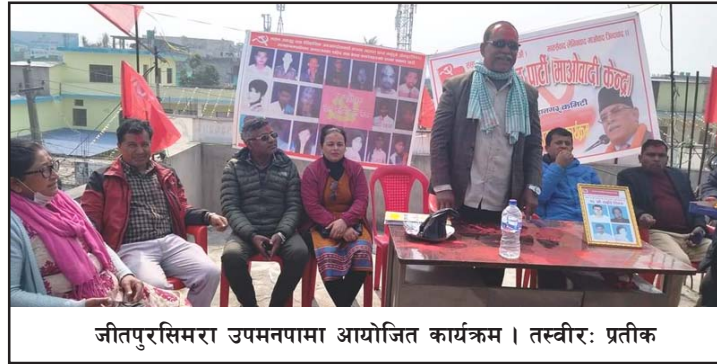
जीतपुरसिमरा उपमहानगरमा आयोजित कार्यक्रम।