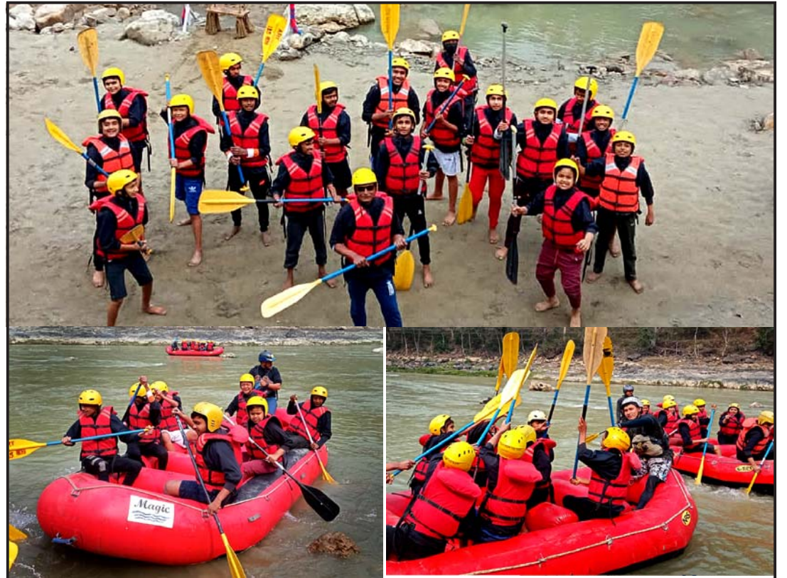
राफ्टिङको मजा: पृथ्वी राजमार्ग अन्तर्गत धादिङ जिल्लाको त्रिशूली नदीमा राफ्टिङ गर्दै कञ्चनजङ्घा माविका विद्यार्थीहरू । राफ्टिङ गर्ने उचित समय कात्तिक महीनादेखि पुस महीनासम्मको हो तर जाडो मौसममा पनि राफ्टिङ गर्न सकिन्छ, यतिबेला पानीको सतह सामान्य नै रहने गरेको छ । कोभिड-१९ को कारण सुनसान भएको यस क्षेत्रमा अहिले स्कूल, कलेजका विद्यार्थीहरूलाई सहूलियत दिने गरेपछि आन्तरिक पर्यटक बढेका छन् ।

निर्वाचनको तीव्र तयारीका क्रममा निर्वाचन आयोग र अन्तर्गत कार्यालयको कार्यालय समय बिहान ९ देखि साँझ ६ बजेसम्म कायम गरिएको छ भने बिदाका दिनमा समेत नियमित कार्यसम्पादन गर्ने