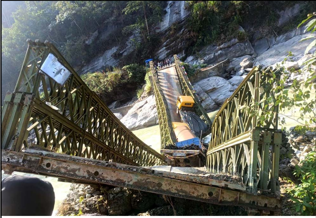
बेलिब्रिज माँचियो : संसुवासभाको मकालु गाउँपालिका वडा नं ५ को जुम र वडा नं १ को वालुङ जोड्ने बेलिब्रिज माँचिएको छ । शनिवार निर्माण सामग्री बोकेको लोवेट तार्ने क्रममा माँचिएको हो ।