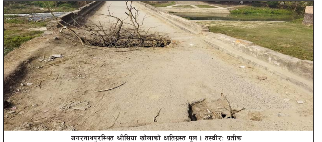
जगरनाथपुरस्थित श्रीसिया खोलाको क्षतिग्रस्त पुल।

कार्यालयले गण्डक नहरको सर्भिस लेनलाई कालोपत्र गर्ने योजना अघि