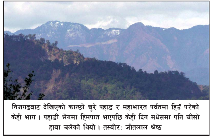
निजगढबाट देखिएको कान्छो चुरे पहाड र महाभारत पर्वतमा हिउँ परेको केही भाग। पहाडी भेगमा हिमपात भएपछि केही दिन मधेसमा पनि चीसो हावा चलेको थियो।

नेपालमा पाइने चुनढुङ्गाको गुणस्तर राम्रो भएकोले यहाँ उत्पादित सिमेन्टको गुणस्तर पनि राम्रै मानिन्छ। अहिलेसम्म गुणस्तरमा समस्या आएको देखिएको छैन। भारत र नेपालको सिमेन्टको गुणस्तर लगभग उस्तै हो। तर भारतमा कम लागतमा सिमेन्ट उत्पादन हुन्छ र उनीहरूसँग सिमेन्टको प्रकार पनि धेरै छ। आर्थिक वृद्धि तथा विकासका लागि अपरिहार्य बन्दै गएको सिमेन्टको वातावरणीय प्रभावबारे बेलाबखत बहस चल्ने गरेको पाइन्छ। सिमेन्ट उद्योगले बढी कार्बन उत्सर्जन गर्ने गरेको पाइन्छ। फलस्वरूप उद्योग स्थापना भएका क्षेत्रका स्थानीयवासीले पटकपटक सिमेन्ट उद्योगविरुद्ध आवाज उठाउँदै आएका छन्। त्यसैले सिमेन्ट उद्योगबाट हुने वातावरणीय प्रभाव न्यूनीकरणका लागि ग्रीन टेक्नोलोजीमा लगानी गर्नु आवश्यक देखिन्छ। विश्व बजारमा प्रतिस्पर्धा गर्न सक्ने वस्तुका रूपमा सिमेन्ट निर्यात हुन थाल्यो भने त्यसले यो प्रदेशले मात्र होइन, समग्रमा मुलुकको निर्यात व्यापारमा एकोहोरो बढिरहेको घाटा कम गर्न ठूलो सहयोग पुर्‍याउँछ। त्यसैले नेपाल र यो प्रदेशको समग्र औद्योगिक विकासका लागि सरकारले सुमधुर औद्योगिक सम्बन्ध, ऊर्जा आपूर्ति, औद्योगिक पूर्वाधार तथा संस्थागत र नीतिगत सुधार गरी लगानीमैत्री वातावरण सिर्जना गर्नुपर्ने अहिले आवश्यक देखिएको छ। यसका साथै मधेश प्रदेशमा उद्योग स्थापनाका लागि स्वदेशी तथा विदेशी लगानीकर्तालाई आकर्षित गर्ने नीति प्रदेश सरकारको हुनुपर्दछ। औद्योगिक प्रवर्द्धन तथा उद्यमशीलताको माध्यमबाट रोजगार सिर्जना गरी समतामूलक एवं दिगो आर्थिक विकास हासिल गर्नु प्रदेश सरकारको प्रमुख कार्यभार हुनुपर्दछ।