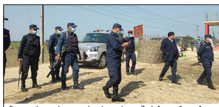
छिपहरमाई गापाको मतदान केन्द्रको अवलोकन गर्दै टोली।

प्रस, वीरगंज, २७ माघ/ स्थानीय तहको निर्वाचन वैशाख ३० गते एकै चरणमा हुने सरकारको निर्णयपछि पर्सा जिल्लामा जिल्ला सुरक्षा