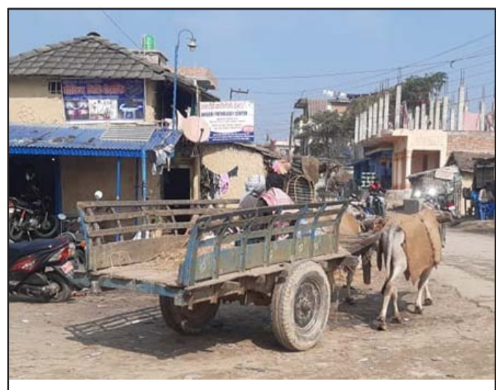
सखुवाप्रसौनी गापा-२ पचगावौं बजारमा देखिएको बयलगाडा।

ग्रामीण क्षेत्रमा सवारीसाधन उपलब्ध हुन थालेपछि किसानहरूले गोरू पाल्न