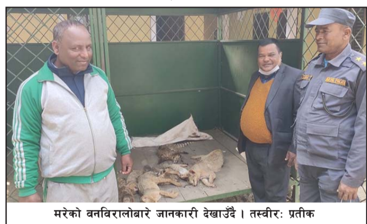
मारेको वनबिरालोबारे जानकारी देखाउँदै।