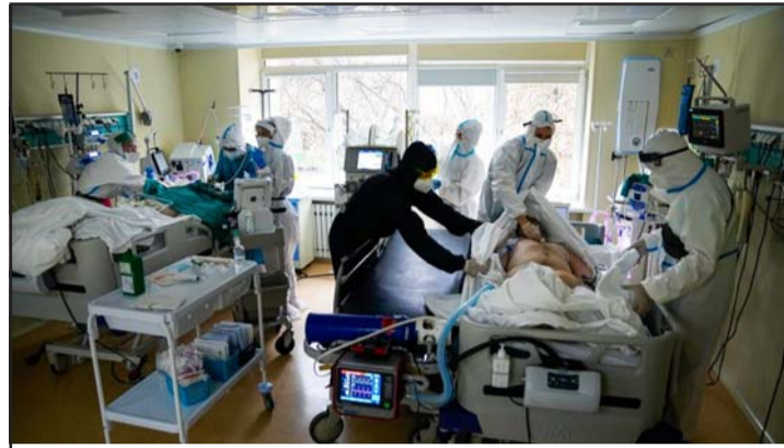
मस्कोस्थित एक अस्पतालमा कोरोना सङ्क्रमितको उपचार गर्दै चिकित्सकहरू।

उनले अब बेलायत सरकारले कोभिड लागेका र कोभिडका विरुद्धका प्रतिबन्धहरूमा पनि धेरै परिवर्तन गर्ने तयारी गरेको जानकारी गराएका हुन्। रासस