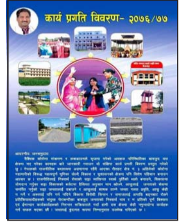
कार्य प्रगति विवरण- २०७६/७७

जाने सडकको स्तरोन्नति गरेको, खानेपानीमा सुधार गरेको, शिक्षाको उचित व्यवस्थापन, घरघरमा गाँस चुलो, सिलिन्डर पुऱ्याएको, छात्राहरूलाई साइकल र विद्यार्थीहरूलाई प्रविधिसँग जोड्न ल्यापटपलगायत उपकरणहरू उपलब्ध गराएको, चोकहरूको नामकरण गरेको, जनताको जमीनलाई ल्यान्डपुलिङ गरी शहरसँग जोड्ने प्रयास गरेकोजस्ता राम्रा कामहरू गरेको दाबी गरेका छन्। बूकलेटमा उनले सबै नेताले आफूसरहको उत्तरदायीपूर्ण काम गरेको भए देशको विकास हुने बताएका छन्।