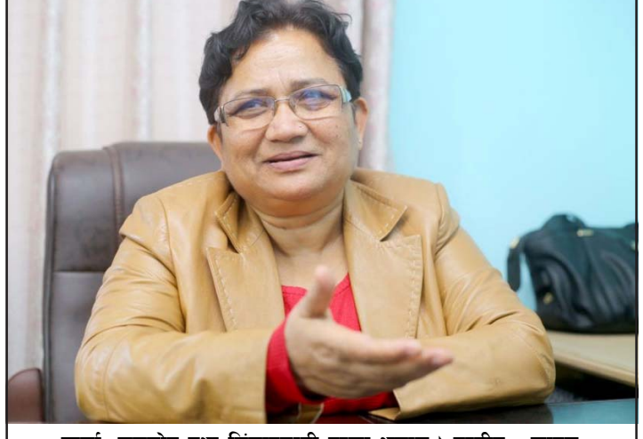
ऊर्जा, जलस्रोत तथा सिंचाइमन्त्री पम्फा भुसाल ।

बोर्डमार्फत लगानी गर्ने उद्योगी-व्यवसायीले पनि नाफासँगै देशको माया गरेर विद्युतीय ऊर्जा खपतलाई प्रोत्साहन