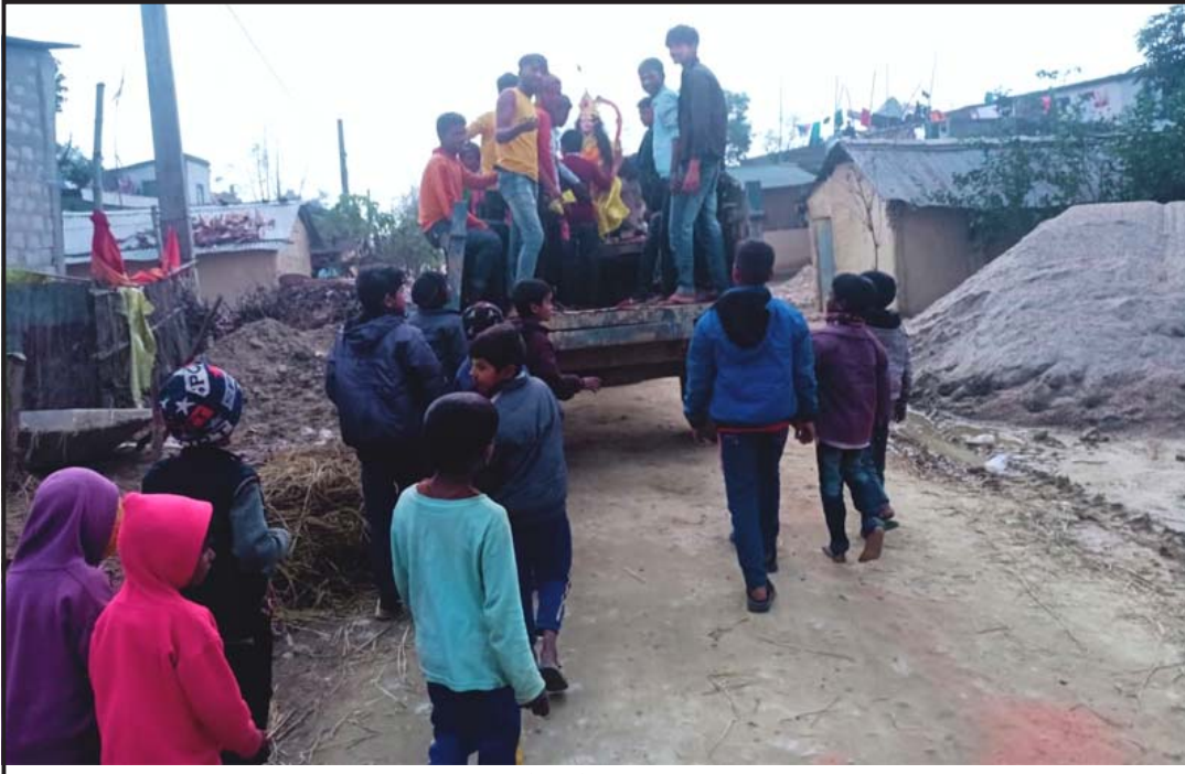
सरस्वतीमाताको मूर्ति नदीमा सेलाउन डिजे बजाउँदै जाँदै पर्सागढी नगरपालिका-४ का विद्यार्थी।