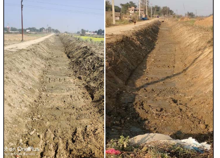
सर्भिस लेन र पर्सा तथा बारामा गण्डक नहरको अवस्था ।

गर्ने काम अलपत्र परेको छ । निर्माणको ठेक्का पाएको दिवा निर्माण सेवा, काठमाडौंले तीस महिनामा पनि काम सम्पन्न गरेको छैन ।