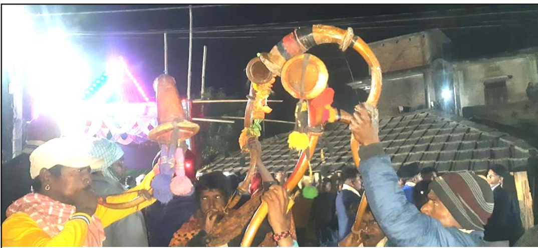
विवाहमा थारू समुदायको परम्परागत बाजा बजाइँदै।

परम्परागत बाजाको संरक्षणका लागि केही गर्न नसकेको उनको आरोप छ। तामाङ समुदायका अगुवा ठोरी