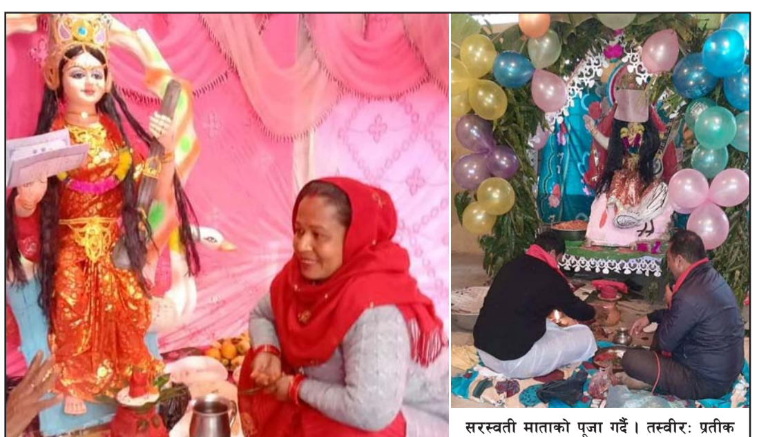
सरस्वती माताको पूजा गर्दै ।

तर यस वर्ष कोरोनाको तेस्रो लहरमा ओमिक्रोन भेरियन्ट सामान्यरूपमा मात्र देखिएकोले कोही पनि डराएका छैनन् । स्थानीय प्रशासनले स्वास्थ्य सुरक्षाका मापदण्ड पूरा गर्न अनिवार्य मास्क लगाउन र नलगाउनेलाई जरिवाना गर्ने (बाँकी पाँचौँ पातामा)