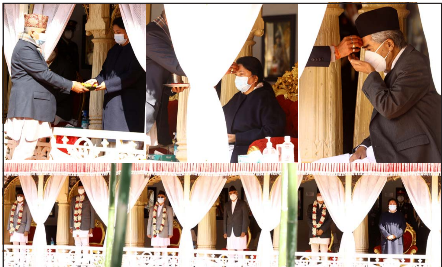
वसन्त पञ्चमीको अवसरमा काठमाडौंको हनुमानढोका दरबारस्थित नासलचोकमा आइतवार आयोजित विशेष समारोहमा (दायाँबाट) राष्ट्रपति विद्यादेवी अण्डारी, उपराष्ट्रपति नन्दबहादुर पुन, प्रधानमन्त्री शेरबहादुर देउवा, प्रधानन्यायाधीश चोलेन्द्र शर्शेर जबरा, सभामुख अजिजप्रसाद सापकोटा र राष्ट्रियसभाका अध्यक्ष ज्ञानेश्वरप्रसाद तिमिल्सिना।