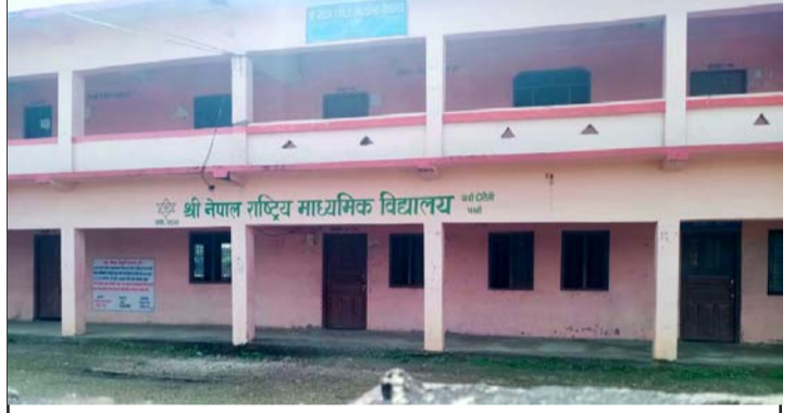
बन्द रहेको बर्वाछोटेटी, पर्सस्थित नेरामावि ।

सोमवारदेखि पर्सका १३ वटा पालिकामा १२ देखि १७ वर्ष उमेर समूहका बालबालिकालाई कोरोनाविरुद्धको खोप दिइनेछ ।