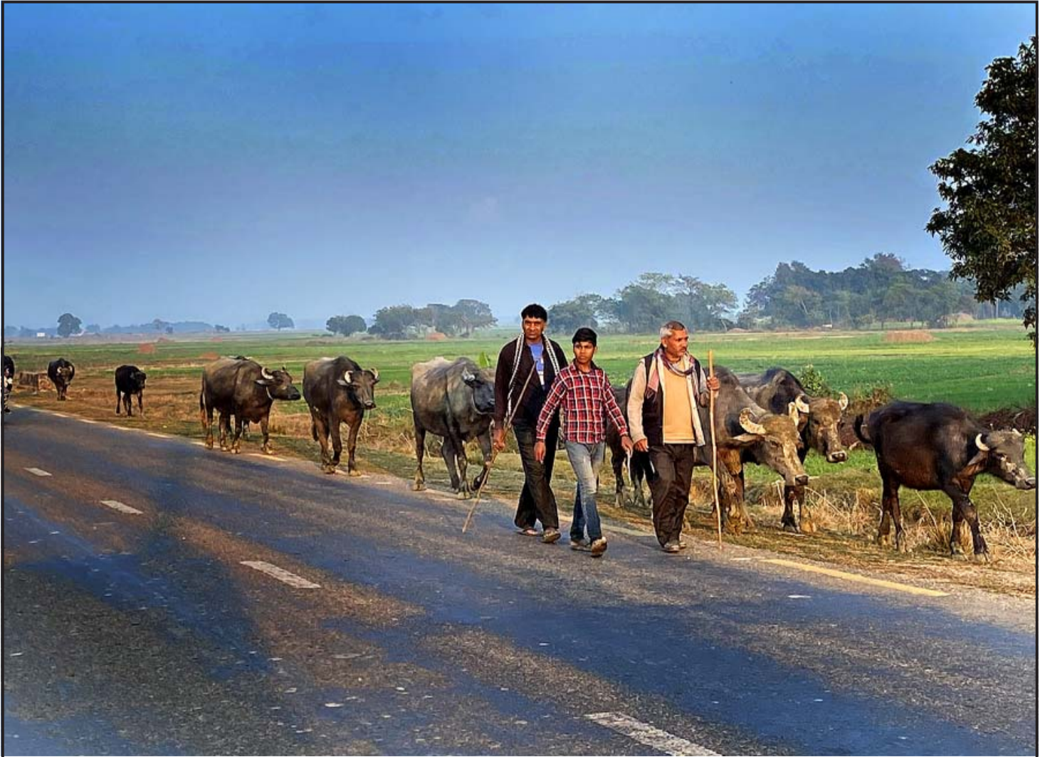
लुम्बिनी प्रदेशको कपिलवस्तु जिल्लाको तिलौराकोटको दृश्य हो । मुस्लिम समुदायको बाहुल्य रहेको यहाँका मानिसहरूको मुख्य पेशा किसानी हो । यसका साथै आरतबाट अन्सार छली मैसी, राँगा मिश्याउले र नेपालका विभिन्न स्थानमा पुऱ्याउने काम पनि गरिन्छ । सो जातिविधि गर्दाको दृश्य ।

र अधिकतम तापक्रम १३.० डिग्री सेल्सियस छ । त्यस्तै आज सबैभन्दा कम जुम्लाको न्यूनतम तापक्रम -३.३ डिग्री र सबैभन्दा धेरै डोटी, विपायलको अधिकतम तापक्रम १९.३ डिग्री सेल्सियस छ ।