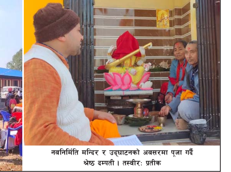
नवनिर्मित मन्दिर र उद्घाटनको अवसरमा पूजा गर्दै श्रेष्ठ दम्पती।

नवनिर्मित सरस्वती मन्दिरको आइतबार सरस्वतीपूजाको दिन उद्घाटन भएको छ।