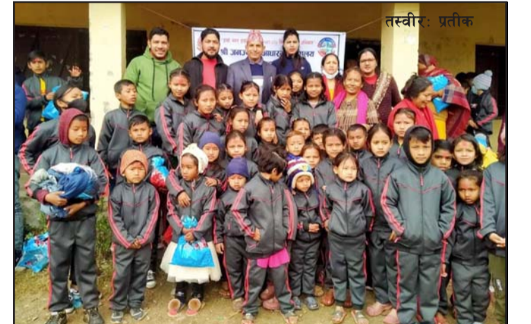
निशुल्क न्यानो कपडा ट्याकसुट वितरण गरेको छ।

पोशाकको रूपमा न्यानो ट्याकसुट वितरण गरिएको उनले बताए। चीसोका कारण पोशाक अभावमा कसैले