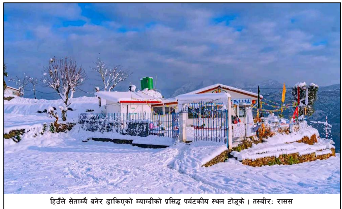
हिउँले सेताम्यै बनेर ढाकिएको म्याग्दीको प्रसिद्ध पर्यटकीय स्थल टोड्के ।