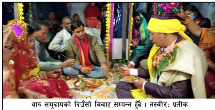
थारु समुदायको दिउँसो विवाह सम्पन्न हुँदै ।

विवाहलाई प्राथमिकता दिँदै आएको छ । राति विवाह गर्दा बेहुलाबेहुली पक्षबीच आर्थिक भार बढी हुने गरेकाले अहिले दिउँसो विवाह गर्ने प्रचलन बढेको हो ।