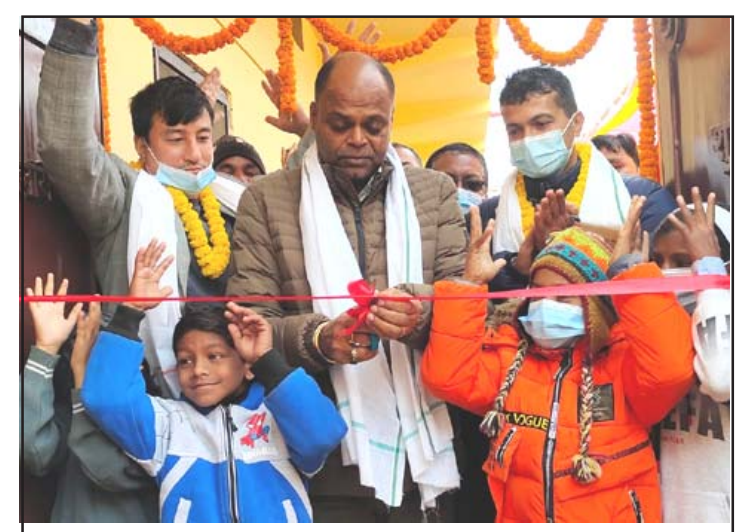
भवनको उद्घाटन गर्दै नगरप्रमुख सरावगी ।

उनले शारीरिकरूपमा फरक क्षमता भएपनि अपाङ्गहरूमा सपाङ्गसरहको मानसिक क्षमता हुने भएकोले फरक क्षमता भएका व्यक्तिलाई समाजले हौसला प्रदान गर्नुपर्ने सुझाव दिए ।