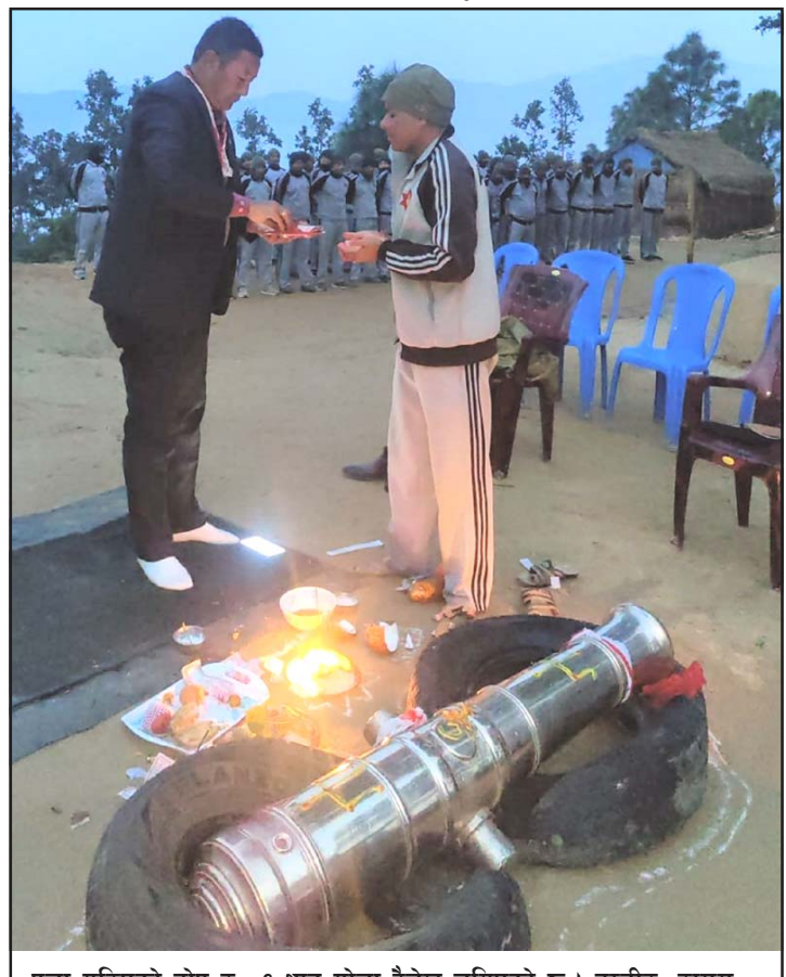
पूजा गरिएको तोप र ८१ थान गोला दैलेख लगाएको छ।

सैनिक तोप र गोला ५० वर्षपछि पुनः दैलेखमै फर्काइएको छ। विसं २०२८ मा दैलेख कोतगढीमा रहेको ज्वाला दल गण सुर्खेत सारिएसँगै यहाँ ल्याइएका तोप-गोला बुधवार फर्काइएको नेपाली सेनाको