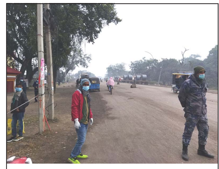
शङ्कराचार्यद्वारनजीकै खटेका स्वास्थ्यकर्मी र सुरक्षाकर्मी ।

उनले पुस ८ देखि २० गतेसम्म एकजना चौध वर्षीय बालक, १६ वर्षीया किशोरी र १५ जना वयस्क गरी सत्रजना सङ्क्रमित पुष्टि भएको बताइन् । सङ्क्रमित पुष्टि हुनेहरूमा दुईजना नेपाली र पन्ध्रजना भारतीय छन् ।