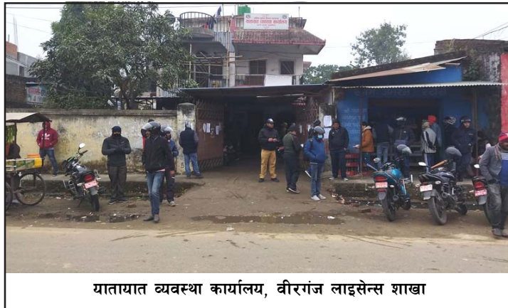
यातायात व्यवस्था कार्यालय, वीरगंज लाइसेन्स शाखा

गरेको तथ्याङ्क छ । प्रतिव्यक्ति र एक सयको दरले दिनको आम्दानी र ४० हजार निरोगिता प्रमाणपत्र र र २० हजार रगत समूहबाट हुँदै आएको छ । तर यो रकम यातायात कार्यालयको खातामा जौँदैन । चिकित्सक, कर्मचारी र बिचौलियाबीच दैनिक र ६० हजार बौँडफाँड हुने गरेको छ । चन्द्रपुरको अस्पतालमा कार्यरत चिकित्सकलाई नै निरोगिता प्रमाणपत्र, रक्त समूह छुट्याउने जिम्मेवारी दिनुले कर्मचारीको मिलेमतो देखिन्छ । सामान्य सेवाग्राहीको लागि बिहान १० देखि ३ बजेसम्म निर्धारण छ भने त्यसपछिको समय बिचौलियाहरूको हुन्छ । खासगरी लेखापढी व्यवसायमा लागेकाहरूले यो समयको उपयोग गर्छन् । कार्यालयमै उपस्थित भएर निरोगिता