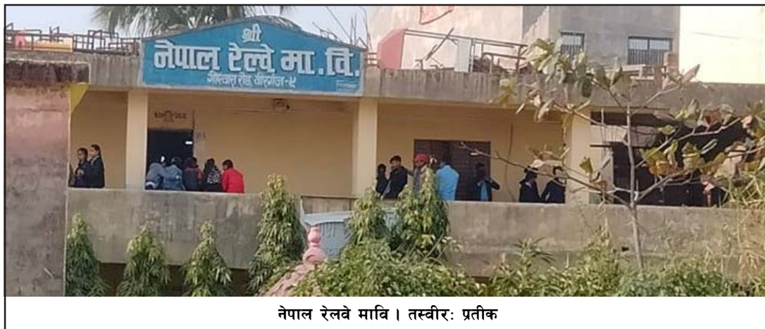
नेपाल रेलवे मावि । तस्वीरः प्रतीक

गर्न सिफारिस गर्दा नगरप्रमुखले संस्थागत विद्यालयहरूबाट यस्तो सिफारिस