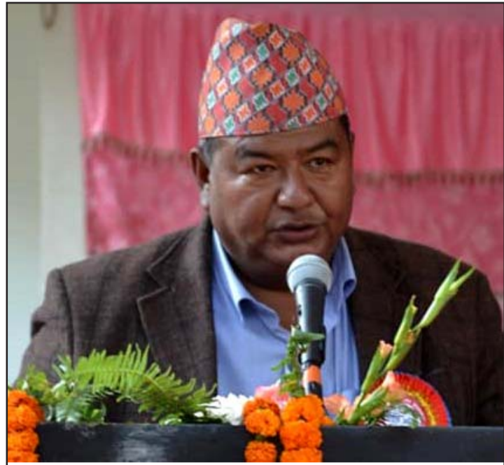
श्रम रोजगार तथा सामाजिक सुरक्षामन्त्री कृष्णकुमार श्रेष्ठ ।

कल सेन्टर तथा वैदेशिक रोजगारसम्बन्धी गुनासो सुनुवाइ कक्षमा कस्ता खालका समस्या र गुनासो आउँछन्, त्यसले सरकारलाई नीति निर्माणमा पनि सहयोग पुग्ने मन्त्री श्रेष्ठले बताए । वैदेशिक रोजगारका नाममा हुने कुनै प्रकारको रकम सङ्कलन, ठगीलागयतका क्रियाकलापमा संलग्न व्यक्ति, मेनपावर कम्पनी वा अन्य संस्था उपर वैदेशिक रोजगार ऐन, २०६४ र अन्य सम्बन्धित कानूनबमोजिम पक्राउ गर्ने, अनुसन्धान गर्ने र आवश्यक कारबाई अगाडि बढाउने मन्त्रालयले जनाएको छ ।