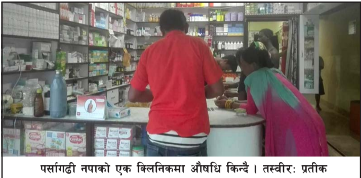
पर्सागढी नपाको एक क्लिनिकमा औषधि किन्दै ।

सदस्यलाई ज्वरो, रुघाखोकी, टाउको तथा जीउ-हात दुख्ने र कसैकसैलाई