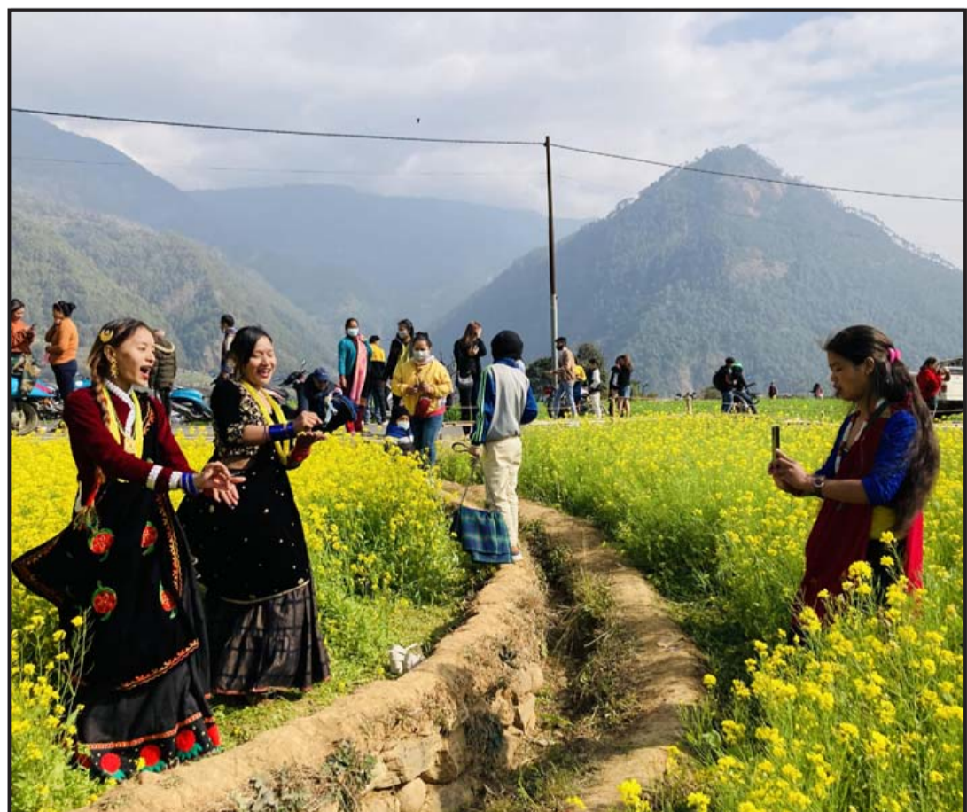
म्याग्दी जिल्लाको बेनी नगरपालिका-१ रत्नेचौरको फाँटमा रहेको तोरीसँगै टिकटक बनाउँदै आन्तरिक पर्यटक । अहिले उक्त स्थान भाइरल तोरीबारीका रूपमा प्रचलित भएको छ ।

देशको आर्थिक अवस्थालाई ध्यानमा राखेर प्रदेश सरकारले आफ्नो सरकार विस्तार गर्नुपर्ने र प्रदेश सरकार पारदर्शी, जवाफदेही र उत्तरदायी हुनुपर्छ भने ।