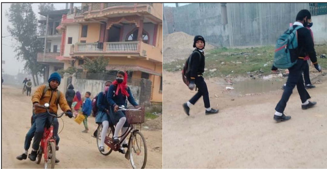
विद्यालय जाँदै विद्यार्थीहरू ।

विद्यालयमा अध्ययनरत १२ देखि १७ वर्ष उमेरका विद्यार्थीलाई आजदेखि विद्यालय खुला गरे पनि खोप भने उपलब्ध भएन । स्वास्थ्य कार्यालय, पर्साका निमित्त प्रमुख