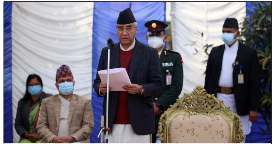
शहीद दिवसका अवसरमा आइतवार काठमाडौंको लैनचौरस्थित शहीद स्मारकमा आयोजित कार्यक्रमलाई सम्बोधन गर्दै प्रधानमन्त्री शेरबहादुर देउवा ।

गरियो । शहीद सप्ताहको पहिलो दिन यही माघ १० गते सीमित व्यक्तिको