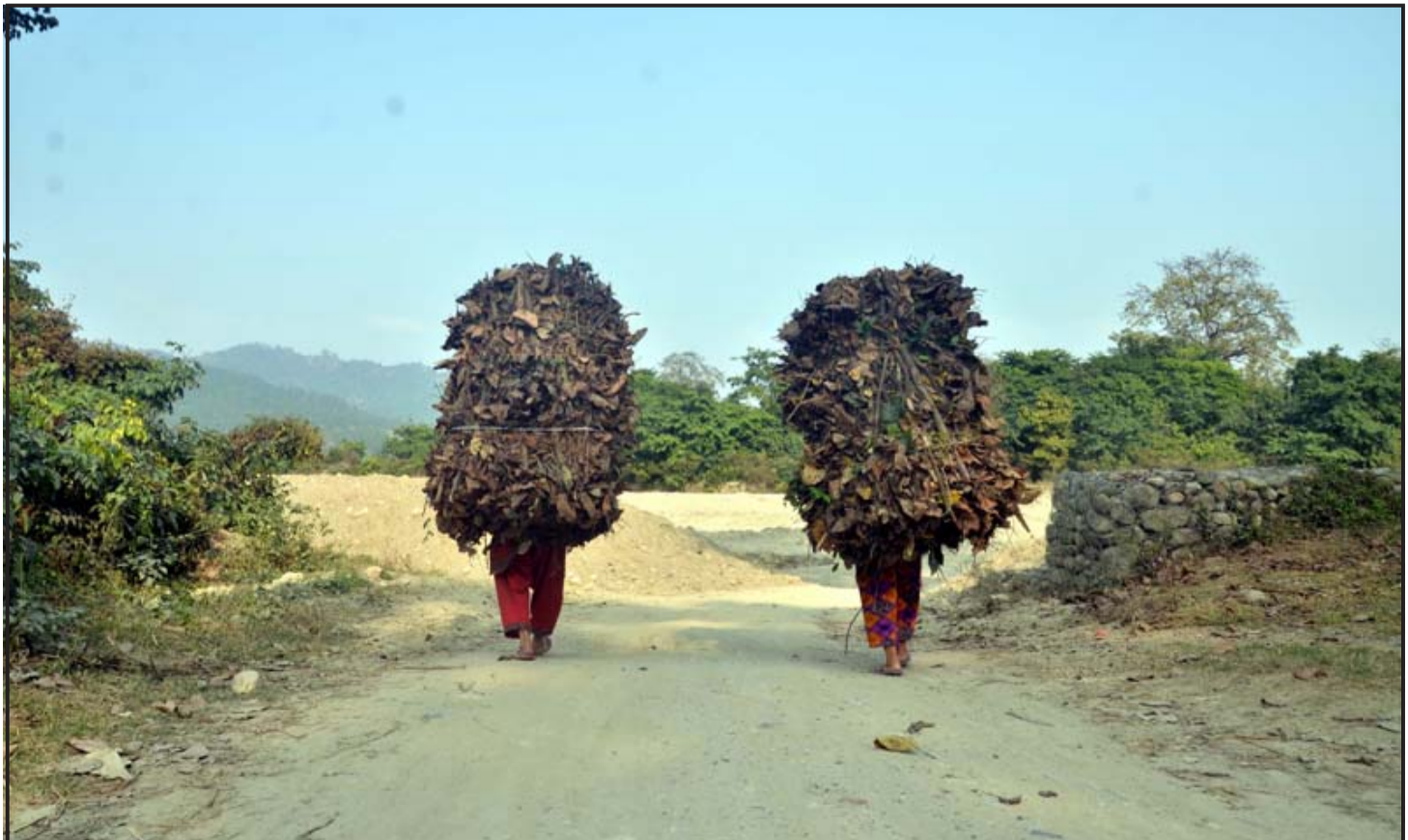
मान्छेलाई जाडो भए ओट्ने, वस्तुमाउलाई सोत्तर: जाडो बढेपछि घरमा पालिएका वस्तुमाउ राखिएको ठाउँ वा जोठलाई न्यानो बनाउन नजीकैको वनक्षेत्रबाट सोत्तर लिइएर फर्कँदै निजगढ नगरपालिका-१० का स्थानीय बासिन्दा।

शरीरमा रातको कमी भएपछि नियमित एक गिलास अनारको रस पिउँदा रातको कमी र कमजोरी हुँदैन। - प्रतीक डेस्क (एजेन्सीको सहयोगमा)