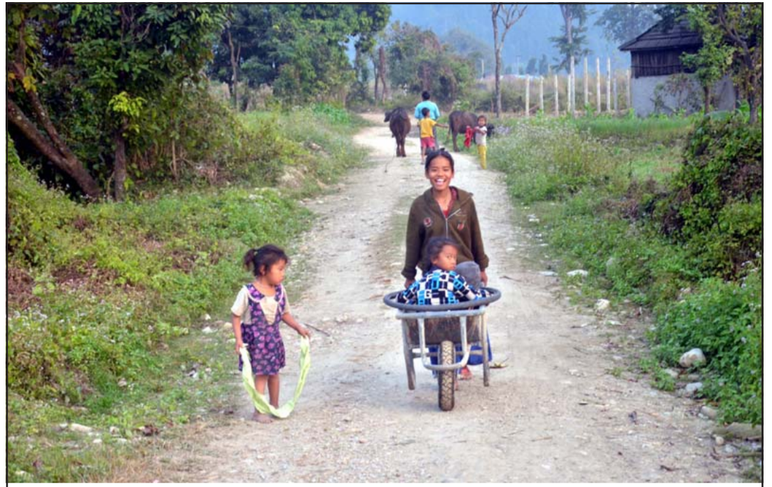
रमाइलो गर्ने तरीका: निजगढ नगरपालिका-१२ रामथलीमा ठेलागाडामा बालबालिकालाई राखेर रमाइलो गर्दै। कोरोनाको कारण विद्यालय बन्द भएपछि यसैगरी दिन कटाउँदै बालबालिकाहरू।