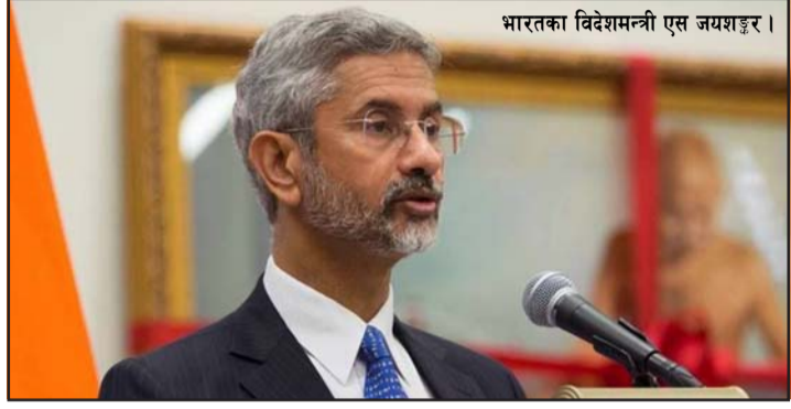
भारतका विदेशमन्त्री एस जयशङ्कर।

त्यसैगरी, बिहीवार सार्वजनिक भएको सो तथ्याङ्कमा गएको २४ घण्टामा मात्र ६७३ जनाको यो सङ्क्रमणबाट निधन भएको बताइएको थियो। केही दिनयता सङ्क्रमण घटेको जस्तो देखिए पनि अहिले भने फेरि यहाँ सङ्क्रमितहरूको सङ्ख्या बढ्दै गएको देखिएको जनाइएको छ। रासस