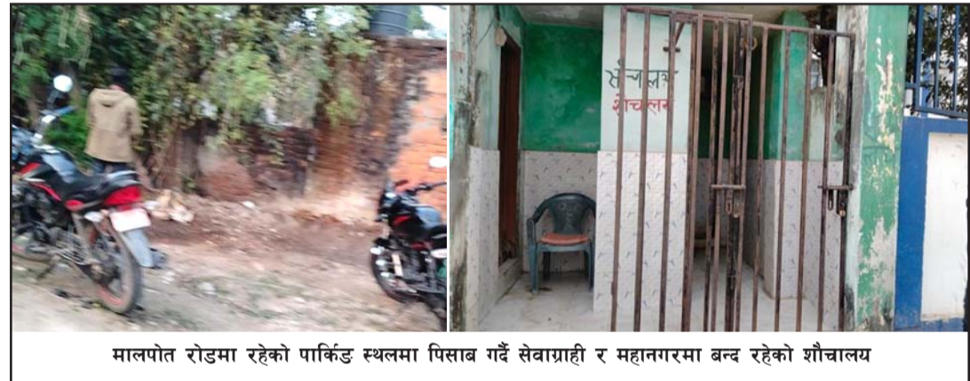
मालपोत रोडमा रहेको पार्किङ स्थलमा पिसाब गर्दै सेवाग्राही र महानगरमा बन्द रहेको शौचालय

गरिएको थियो। त्यसपछि सरसफाइ अभावमा सञ्चालनमा छैन। बनेको शौचालय पनि प्रयोगविहीन