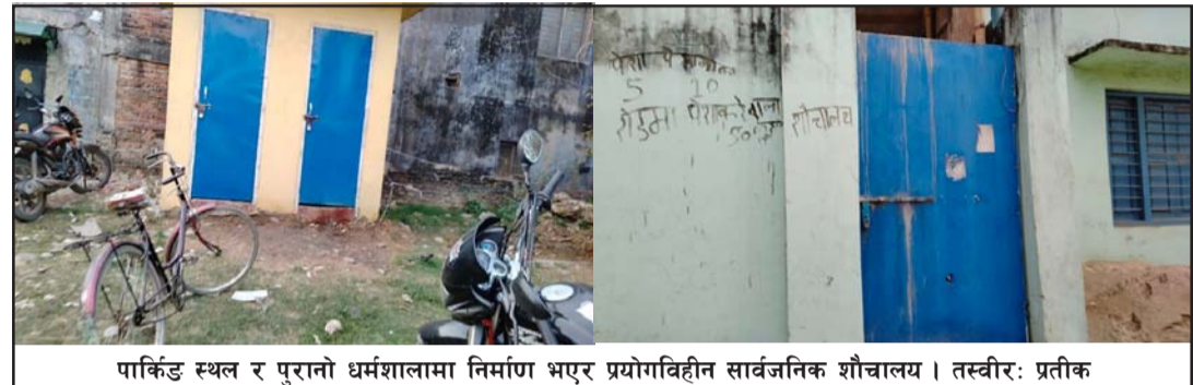
पार्किङ स्थल र पुरानो धर्मशालामा निर्माण भएर प्रयोगविहीन सार्वजनिक शौचालय।

व्यवस्थित वीरगंज अभियान अन्तर्गत दुई वर्षअगाडि सो शौचालयको सरसफाइ