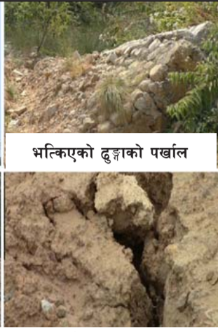
भत्किएको ढुङ्गाको पर्खाल