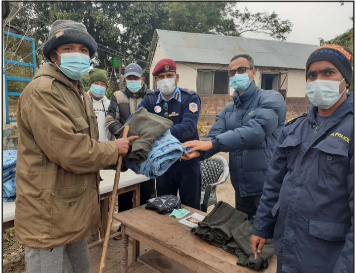
ठोरीमा न्यानो कपडा वितरण गरिँदै ।

जानकारी दिए । समितिले उपलब्ध गराएको ४० सैट