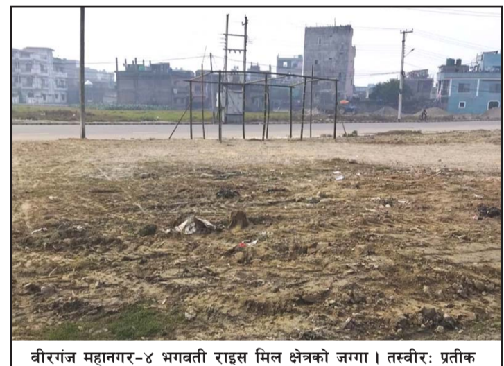
वीरगंज महानगर-४ भगवती राइस मिल क्षेत्रको जग्गा ।

विभागलाई २०६६ सालमा निर्देशन गरेबमोजिम मालपोत विभागले नेपाल