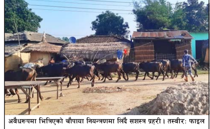
अवैधरूपमा भित्रिएको चौपाया नियन्त्रणमा लिँदै सशस्त्र प्रहरी ।

बजारबाट वैध बनाएर विभिन्न स्थानमा लगेर बिक्री गरिन्छ । यसैगरी