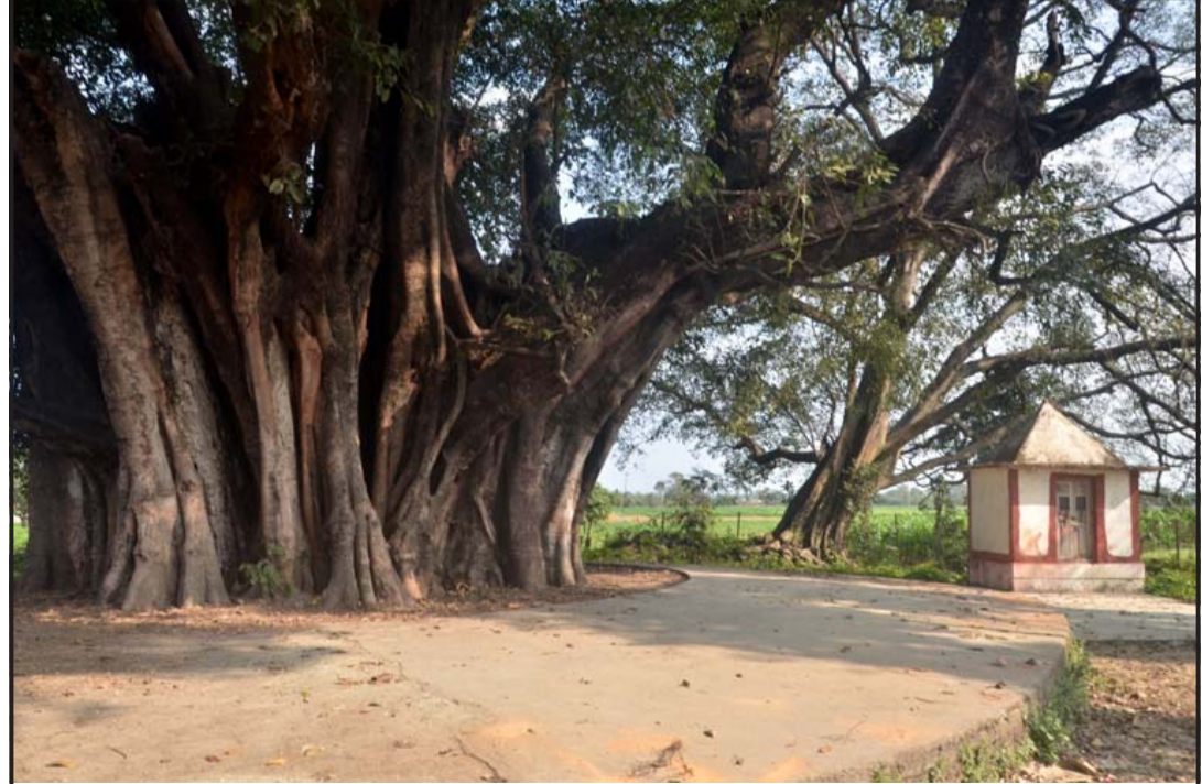
दुई सय वर्ष पुरानो निजगढ नगरपालिका-४ कछाडियाटोलमा रहेको शमीको रूख। गर्मीमा शीतल खोज्न यस चौतारामा मानिसको घुईचो लै जाउछ।

भई सकारात्मक सर्किट लाग्यो। ज्योति लाइफ इन्श्योरेन्स १.८२, गुर्खाज फाइनेन्स १.५१, र सानिमा लार्ज क्याप फण्डका लगानीकर्ताले १.५० प्रतिशतले कमाए। त्यस्तै कर्णाली डेभलपमेन्ट बैंक ७.८२, माउन्टेन हाइड्रो नेपाल ७.७१, आशा लघुवित्त ७.१०, ओरिएण्टल होटल ७.०९ र सामलिड पावर कम्पनीका शेयरधनीले ६.८८ प्रतिशतले गुमाए।