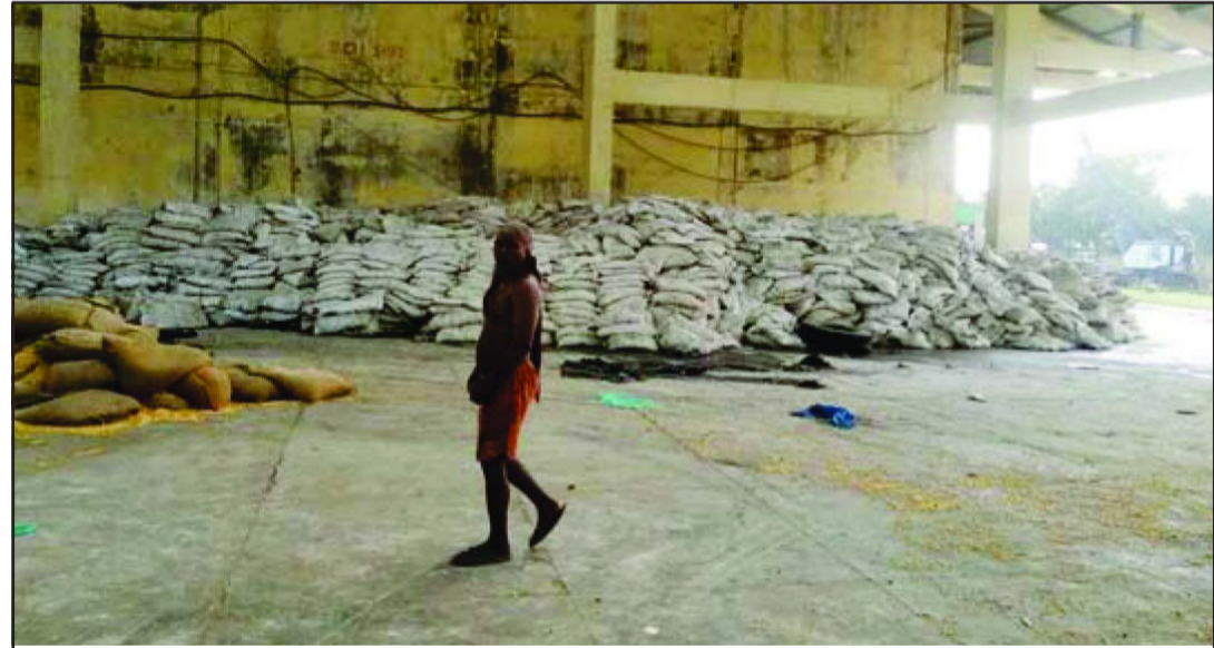
वीरगंज सुख्खा बन्दरगाहमा अलपत्र अवस्थामा डिएपी मल।

वीरगंज सुख्खा बन्दरगाहमा डेढ वर्षदेखि असरल परेको रासायनिक मलको घटनालाई लिन सकिन्छ।