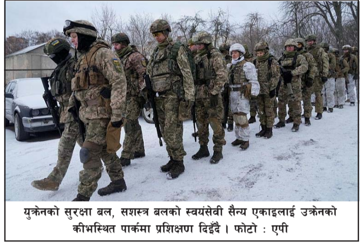
युक्रेनको सुरक्षा बल, सशस्त्र बलको स्वयंसेवी सैन्य एकाइलाई उक्रेनको कीर्तिस्थित पार्कमा प्रशिक्षण दिइँदै।

सो दूतावासमा रहेका मात्र नभएर युक्रेनमा रहेका सबै अमेरिकी नागरिकलाई पनि सम्भव भएसम्म युक्रेन छाड्ने विषयमा विचार गर्न अमेरिकाले अनुरोध गरेको छ। अमेरिकी गुप्तचर रिपोर्टमा रूसले युक्रेनमा आक्रमण गर्ने योजना बनाएको पाइएको बताइएको छ। त्यसैले पनि अमेरिकाले आफ्ना नागरिकहरूलाई उक्त आदेश जारी गरेको बताइएको छ। उता रूसले भने युक्रेनमा आक्रमण गर्ने योजना नरहेको बताएको छ। रूसले पछिल्ला समयमा अमेरिकाले लगाउँदै आएको सो आरोपको खण्डन पनि गर्दै आएको छ। तर पनि अघिल्लो महीनादेखि नै रूसले युक्रेनसँग जोडिएको सीमा क्षेत्रमा करीब एक लाख सैनिक तैनाथ गरेको छ। अन्तर्राष्ट्रिय समाचार संस्थाहरूले यो कुरा उल्लेख गरेका छन्। रासस