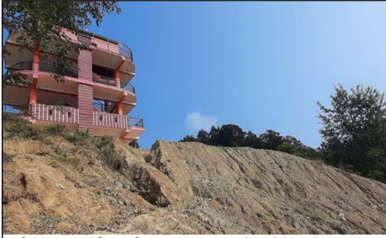
पहिरोको उच्च जोखिममा निजगढ भ्यू टावर।