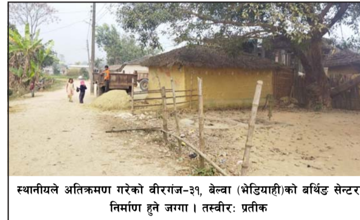
स्थानीयले अतिक्रमण गरेको वीरगंज-३१, बेल्वा (भेडियाही)को बर्थिङ सेन्टर निर्माण हुने जग्गा ।

उनीहरूले पसां जिल्ला अदालत र उच्च अदालत जनकपुरको अस्थायी इजलास