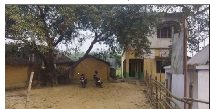
वीरगंजबाट जग्गाको स्वामित्वसम्बन्धी मुद्दा हारिसकेको तर जग्गा खाली गर्न आनाकानी गरिरहेको बेल्वा स्वास्थ्य

बर्थिङ सेन्टर निर्माण गर्न ढिलाइ भइरहेको छ । निर्माण कार्यमा ढिलाइ हुँदा चालू आवामा बर्थिङ सेन्टर निर्माणको लागि महानगरले छुट्याएको करीब पौने २ करोड रुपियाँ फिज हुने चिन्ता बढेको गाउँलेहरूले बताएका छन् ।