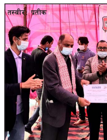
माईस्थान पार्कमा आयोजित रक्तदान कार्यक्रममा ३२ जनाले रक्तदान गरेको