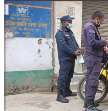
मास्क नलगाउनेलाई र १ सय जरिवाना तिराउँदै।

उनले बताए । अहिले घरघरमा रुघाखोकीका बिरामी भएको तर जाँचको दायरा फराकिलो नहुँदा सङ्क्रमण नदेखिएको बताए । उनले जाँचको दायरा बढेको खण्डमा सङ्क्रमितहरू बढ्न सक्ने बताए । अहिले देखापरेका सङ्क्रमितहरूमा ९ देखि १८ वर्षका बालबालिकाहरू पनि छन् । महानगरको विद्यालय सञ्चालनमा रहेको कारण