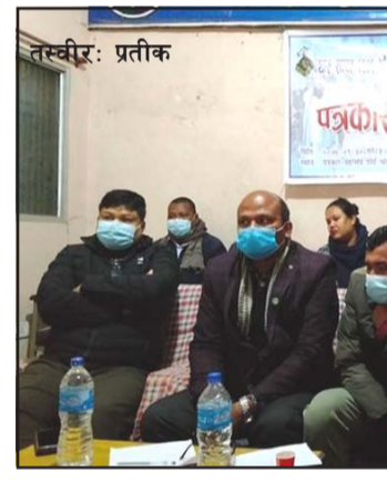
नयाँ वर्ष माघी (खिचडी पर्व) पर्सामा महोत्सवको रूपमा मनाइँदै छ ।