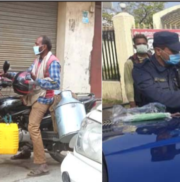
मास्क नलगाउनेलाई र १ सय जरिवाना तिराउँदै।

वीरगंज महानगरमा जरिवाना गरिँदैछ । आज बिहानदेखि प्रहरीले मास्क नलगाउने जोकोहीलाई र एक सय जरिवाना तिराएर मास्क दिन थालिएको छ ।