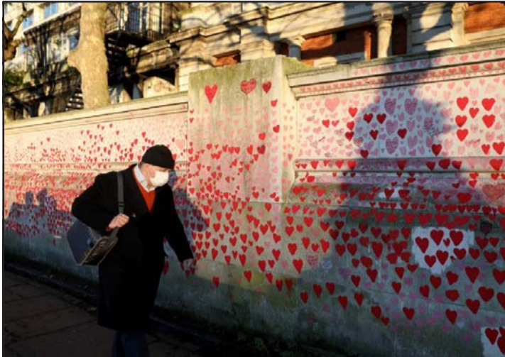
बेलायतले आत्म-एकांकीकरण अवधि सात दिनबाट घटाएर पाँच दिन गरेको विषय नवी फिनारिस्का कोभिड स्मारक पछि भएर हिँडे एकजना मानिस।

सङ्क्रमित भएपछि बस्नुपर्ने सेन्फ आइसोलेशनको समय पाँच दिनमा छोट्याइएको छ। यस अघि सात दिन रहेकोमा कटौती गरेर कोभिड पोजेटिभ देखिएको व्यक्तिले अब सेन्फ आइसोलेशनमा पाँच दिन मात्र बस्नु पर्ने भएको छ।