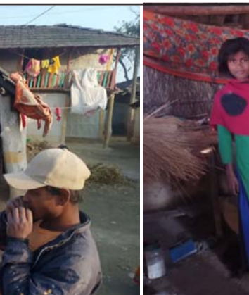
पर्सागढी नगरपालिका-३ पकडियाका मुसहर परिवार ।

दुई सय घरपरिवार मुसहरहरूमध्ये एकजना मुसहरको मात्र जनता आवास कार्यक्रम अन्तर्गत घर निर्माण भएको छ ।