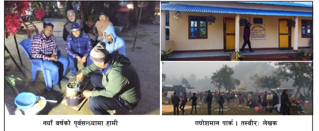
नयाँ वर्षको पूर्वसन्ध्यामा हामी