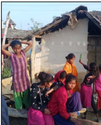
पर्सागढी नगरपालिका-३ पकडियाका मुसहर परिवार ।

फूसको घरमा एउटै कोठामा पाँच जना परिवार जाडोमा रात काट्ने गरेका