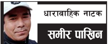
धारावाहिक नाटक समीर पाखिन

उषा : अहँ, बाबाले नै राख्नुभएको होइन र ? बाबा, मलाई साथीहरूले बोलाएको छ । एक क्षण बजार पुगेर