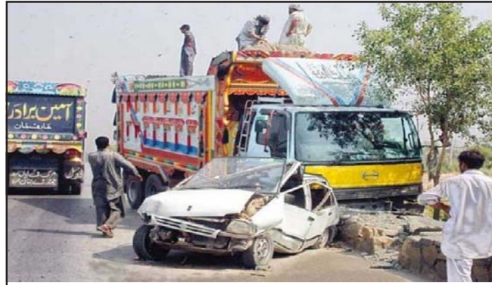
दुर्घटनामा क्षतिग्रस्त वाहन।

मानिस सवार थिए। प्रहरीका अनुसार उनीहरू नातेदारको विवाहमा सहभागी हुन जाँदै थिए। घाइते र शवहरूलाई नजीकैको अस्पतालमा लगिएको छ। घाइतेमध्ये तीनजनाको अवस्था गम्भीर रहेको बताइएको छ। रासस