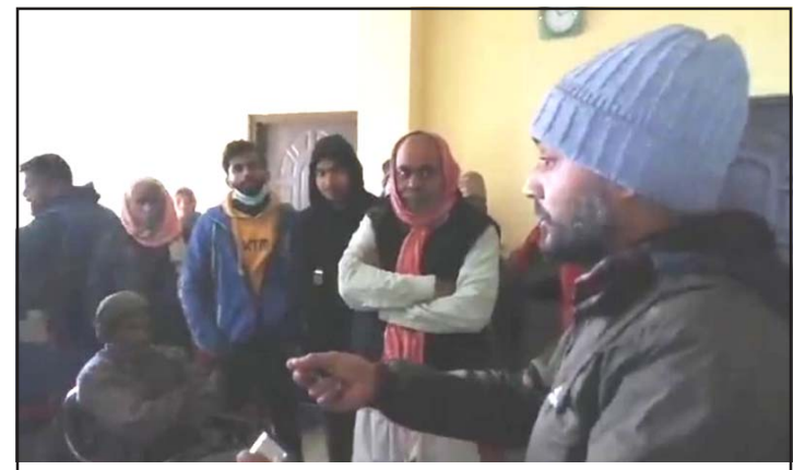
ज्येष्ठ नागरिकको धर्नामा सम्बोधन गर्दै स्थानीय युवक ।

पनि दुई सयजना ज्येष्ठ नागरिकका लागि सामग्री आएको तर वितरण नभएकोमा ज्येष्ठ नागरिकहरूले वितरणको माग गर्दै धर्ना दिएका हुन् ।