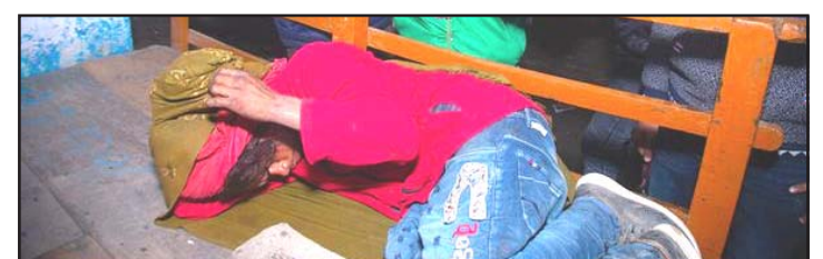
बिहीवार राति उद्धार गरिएका तीनजना।

मानवसेवा आश्रम वीरगंजको टोलीले एकजना ८० वर्षीय वृद्धको उद्धार एकजना युवक, एक एकजना वृद्धवृद्धा गरिएको थियो।