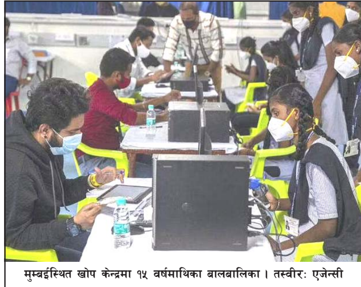
मुम्बईस्थित खोप केन्द्रमा १५ वर्षमाथिका बालबालिका।

सोही अवधिमा थप ३०२ जनाको कोरोना सङ्क्रमणका कारण मृत्यु भएको छ। यसैसँगै भारतमा कोरोनाका कारण ज्यान गुमाउने व्यक्तिको सङ्ख्या चार लाख ८३ हजार १७८ पुगेको मन्त्रालयले थप जानकारी दिएको छ। कोरोना शुरु भएदेखि हालसम्म ६८ करोड ६८ लाखभन्दा बढी व्यक्तिको कोरोना परीक्षण भएको छ। यहाँ सन् २०२१ को जनवरी १६ बाट कोरोना भाइरसविरुद्ध खोप अभियान शुरु भएको थियो। सो समयदेखि हालसम्म एक अर्ब ४९ करोड ६६ लाख ८१ हजारभन्दा बढी मात्रा खोप लगाइएको जनाइएको छ। रासस