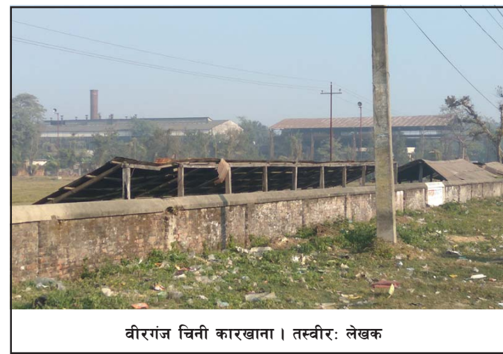
वीरगंज चिनी कारखाना।

उन्नति वीरगंज चिनी कारखानामा निर्भर थियो। उहिलेको धरोहर अहिले खण्डहरमा परिणत भइसकेको छ। अर्बौंको सम्पत्ति खेर गइरहेको छ। सयौँ