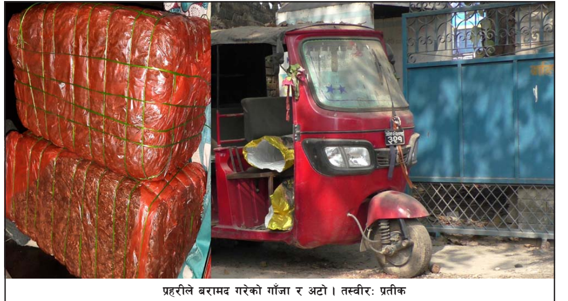
प्रहरीले बरामद गरेको गाँजा र अटो।

रकम माग गरेको र आफूले उक्त रकम दिन नसक्ने भनेपछि अढाई लाख रुपैयाँ