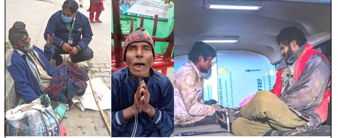
उद्धार अघि र उद्धारपछि वृद्ध र विगतमा उद्धार गरिएका युवकहरू ।