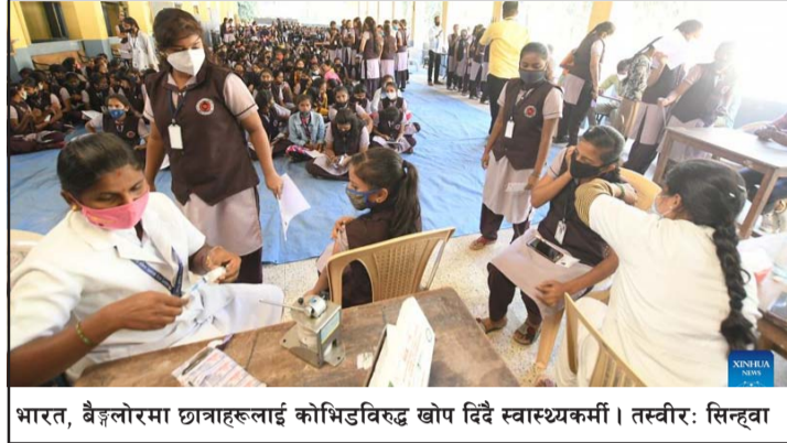
भारत, बैङ्गलोरमा छात्राहरूलाई कोभिडविरुद्ध खोप दिँदै स्वास्थ्यकर्मी।

यो भेरिएन्ट निकै घातक रहेको र यसबाट पूर्ण सतर्क रहनुपर्ने भनिएकोमा यहाँ पहिलोपटक यी दुईजनाको ज्यान गएको स्वास्थ्य अधिकारीहरूले जनाएका छन्। दक्षिण कोरियामा पनि डिसेम्बरको शुरुतिर यो भेरिएन्ट फैला परेको थियो। गत डिसेम्बर २७ मा एक र २९ तारिखमा अर्का एकजनाको यस भेरिएन्टबाट ज्यान गएको अधिकारीहरूले जनाएका छन्। रासस