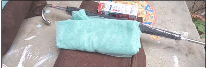
महानगरले वितरण गरेको कम्बल, भुल, छाता, टर्च ।

प्रस, वीरगंज, २० पुस/ अन्तर्गत कम्बल, टर्च, भुल र छाता वीरगंज महानगरपालिकाले उपलब्ध गराएको उनले बताए ।