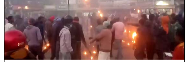
जनमत पार्टीद्वारा निकालिएको मशाल जुलुस ।

चौकीको गोदाममा थन्काएर राखेको थियो । बीउ छर्ने समय बित्न लागेर पालिकाले गहुँ ल्याएकोमा पनि वितरणमा विलम्ब गरेको भनी आलोचना भएपछि पालिकाले किसानलाई बोलाएको थियो । स्वास्थ्य कार्यालय परिसरमा बिहानै किसानहरू भेला भएकामा मध्याह्नसम्म