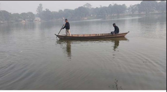
देवताल झरोखर पोखरीमा माछा माडै माझीहरू ।

उनले समयमा माछापालनको लागि भुराको व्यवस्थापन हुन नसक्नु, खरीद गरेको भुराको गुणस्तरको ग्यारेन्टी नहुनु र बाढीमा माछा बगुना साथै बेलाबखत माछाहरू पोखरीमा मर्नेजस्ता घटनाले माछा व्यवसायीहरूलाई खासै मुनाफा नहुने गरेको बताए ।