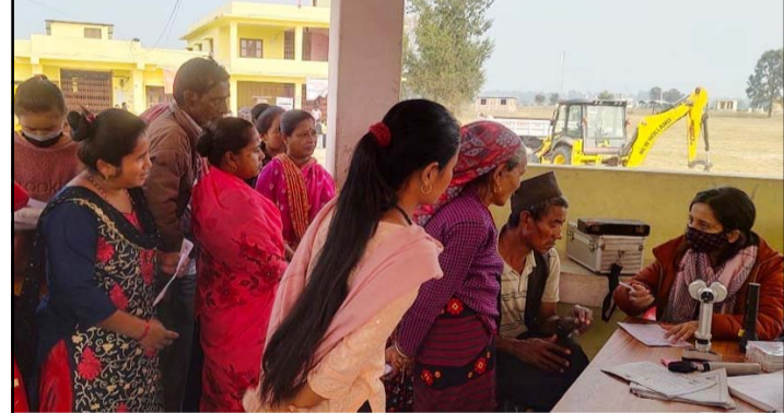
शिविरमा चेकजाँच गर्दै चिकित्सक र उपस्थित स्थानीय ।

समुदाय-प्रहरी साभेदारी कार्यक्रम अन्तर्गत इलाका प्रहरी कार्यालय, ठोरीको आयोजना तथा वीरगंज आँखा उपचार