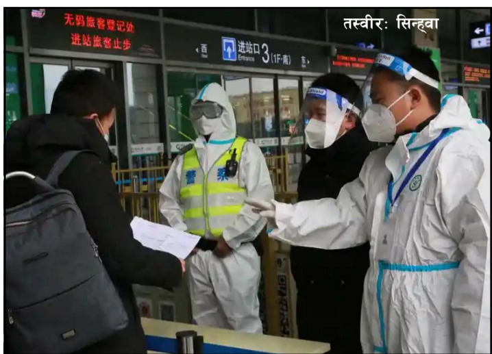
तागरिकले लगाइसकेका छन् । अहिले फेरि सङ्क्रमितको सङ्ख्या बढ्न थालेपछि सतर्कता पनि बढाउन थालिएको अधिकारीले जानकारी दिएका छन् । उनीहरूका अनुसार पछिल्लो २४ घण्टामा १४० जना नयाँ सङ्क्रमित भेटिएको पुष्टि गरिएको हो । तीमध्ये ८७ जना स्थानीय स्थानान्तरण र अरू बाहिरबाट सरेको राष्ट्रिय स्वास्थ्य आयोगले जनाएको छ ।

बेइजिङ, १० पुस/सिन्धुवा चीनमा कोरोना भाइरसबाट दैनिक सङ्क्रमितको सङ्ख्या चार महीनापछि सबैभन्दा धेरै देखिएको छ । विगतमा सङ्क्रमितको सङ्ख्या घट्टै गए पनि अहिले फेरि बढेको देखिएको सरकारी अधिकारीले शनिवार जानकारी दिएका छन् । कोरोना भाइरसको सबैभन्दा पहिला पुष्टि भएको मुलुक चीनमा महामारीको न्यूनीकरण भने अरू देशमा भन्दा राम्रोसँग भएको थियो । सन् २०१९ को डिसेम्बर अन्तिममा कोरोना भाइरसको पुष्टि चीनमा भएको थियो । शुरूमा उच्च सतर्कता गरेकाले चाँडो महामारी न्यूनीकरण गर्न सफल भएको थियो भने चीनले कोरोना भाइरसविरुद्धको खोप पनि उत्पादन गरेको छ । चीनमा उत्पादन गरिएको खोप अहिले विश्वका धेरै देशका