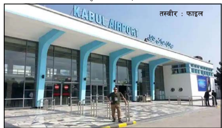
अन्तर्राष्ट्रिय विमानस्थल र अफगानिस्तानका अन्य चारवटा विमानस्थलको व्यवस्थापनका लागि उक्त वार्ता प्रभावकारी रहेको र जसमा उनीहरू आगामी दिनमा सञ्चालनको विवरणमा काम गर्न

प्राविधिक समूह सिर्जना गर्न सहमत भएका छन् । “दोहा र अझारा संयुक्तरूपमा काबुल अन्तर्राष्ट्रिय विमानस्थल सञ्चालन गर्न सहमत भएका छन्,” स्रोतहरूले भने । टर्की-कतारी प्रतिनिधिमण्डलले संयुक्त कार्यलाई निरन्तरता दिन छिट्टै काबुल भ्रमण गर्ने पनि स्पुतनिकले रिपोर्ट गरेको छ । यसअघि अगस्त ३१ मा अमेरिकी सेना फिर्ता भइसकेपछि कतारको प्राविधिक टोलीले काबुल अन्तर्राष्ट्रिय विमानस्थल मर्मत गरेको थियो । अगस्तको मध्यमा तालिबानले सत्ता कब्जा गरेपछि काबुलको अन्तर्राष्ट्रिय विमानस्थल र अफगानिस्तानभरि अन्तर्राष्ट्रिय र स्थानीय उडानहरू स्थगित गरिएको थियो ।