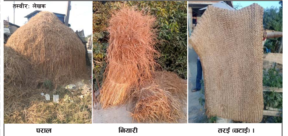
पराल, नियारी, तरई (चटाई)।

पुर्खाहरू अत्यन्तै विवेकशील थिए। जुटको बोराले आवश्यकता अनुसारको आकारमा खोल तयार पारिन्थ्यो। त्यसैभित्र मनग्ये पराल ठुसेर झन्डै एक फिट वा सोभन्दा