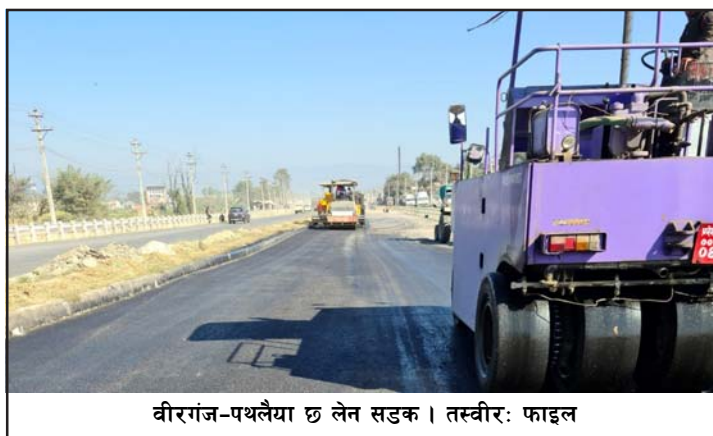
वीरगंज-पथलैया छ लेन सडक ।

जीतपुरबजारसम्म इलाइट/सब्बा जेभीले ७९ प्रतिशत, श्रीसिया खोलादेखि