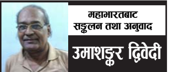
महामारतबाट सङ्कलन तथा अनुवाद उमाशङ्कर दिवेदी

तपाईंका सेनालाई यत्रतत्र छिन्नभिन्न पारी उनी फेरि अर्जुनको रथतिर हानिए।