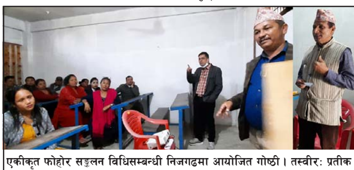
एकीकृत फोहोर सङ्कलन विधिसम्बन्धी निजगढमा आयोजित गोष्ठी ।

जनाउँदै 'तपाईंको घरको फोहोर हामीलाई दिनुस् । तपाईंलाई हामी नगद दिन्ौं'