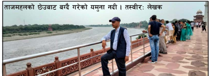
ताजमहलको छेउबाट गर्दै गरेको यमुना नदी।

भित्र जहाँसम्म जानुपर्ने हो, त्यहाँ गएर रोकिन्छौं र ओलन्छौं अनि ताजमहलको भित्री मुख्यद्वारतर्फ अगाडि बढ्छौं। मुख्यद्वारभन्दा अगाडिको पक्की चौरलाई देखेर आनन्दित हुन्छौं। नजीकैको मूल ठूलो द्वारबाट भित्र जानलाई एकातिर मन आतुर छ भने अर्कातिर यहाँको दृश्यमा नै एकछिन रमाउन पाए हुन्थ्यो भन्नेजस्तो भइरहेको छ। त्यहाँ आएर घरीघरी क्यामराम्यानहरूले फोटो खिचाउनको लागि सोझ आएर सताएको जस्तो लागेको छ। हामीसित मोबाइल छ। मोबाइलविना कोही पनि छैनौं र म त झन् यही यात्राको लागि भनेर नयाँ मोबाइल लिएर आएको छु। मैले चलाइरहेको मोबाइलले राम्रै काम गरेको थियो तर फोटोमा केही समस्या थियो। जब वृन्दावन र आगराजस्तो ठाउँमा पुग्दैछु त राम्रो फोटो आउने एउटा मोबाइल त बोक्नुपर्छ भन्ने लागेको थियो। मोबाइलका कतिपय फोटो त अन्य कामको लागि पनि काम लागिहाल्छ। क्यामराम्यानहरूलाई पन्छाउँदै अगाडि बढेर प्रवेश गर्दछौं र दर्शन हुन्छ एउटा अद्भुत आश्चर्यको। हो, त्यही अद्भुत आश्चर्य जो विश्वका आश्चर्यमा परेको छ। हामी त्यसको अगाडि छौं,