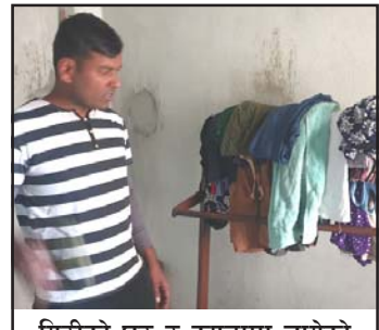
गिरीको घर र कपडामा लागेको आगोबारे बताउँदै।

पोखरिया नगरपालिका-१ वनकटवा टोल घर भई राधेमाईमा घर बनाएर